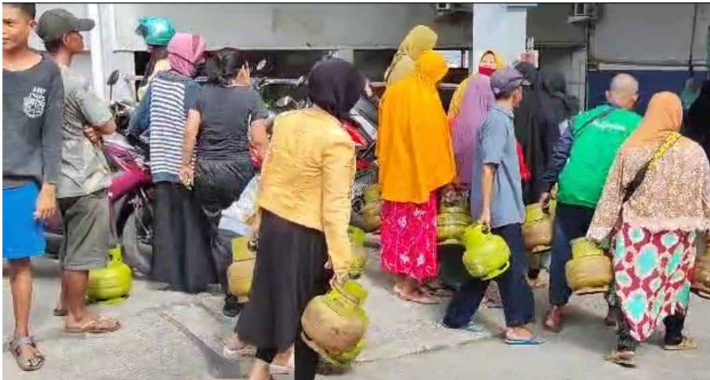
Warga antre untuk membeli gas Elpinj 3 kilogram di salah satu SPBU Batu Ampar.