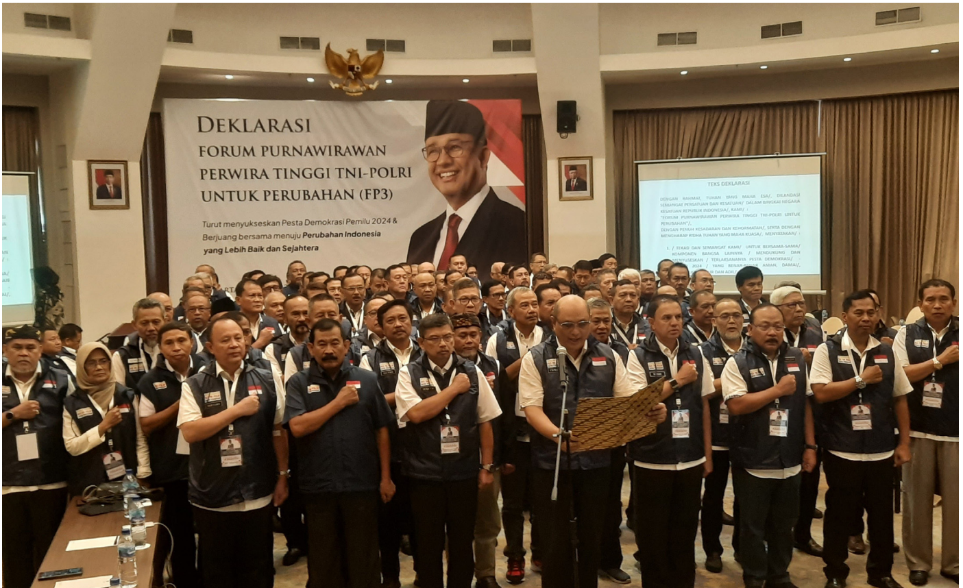
Purnawirawan Pati TNI-Polri yang ditergabung dalam FP3 mendeklarasikan dukungan bagi Anies Baswedan untuk Pilpres 2024.