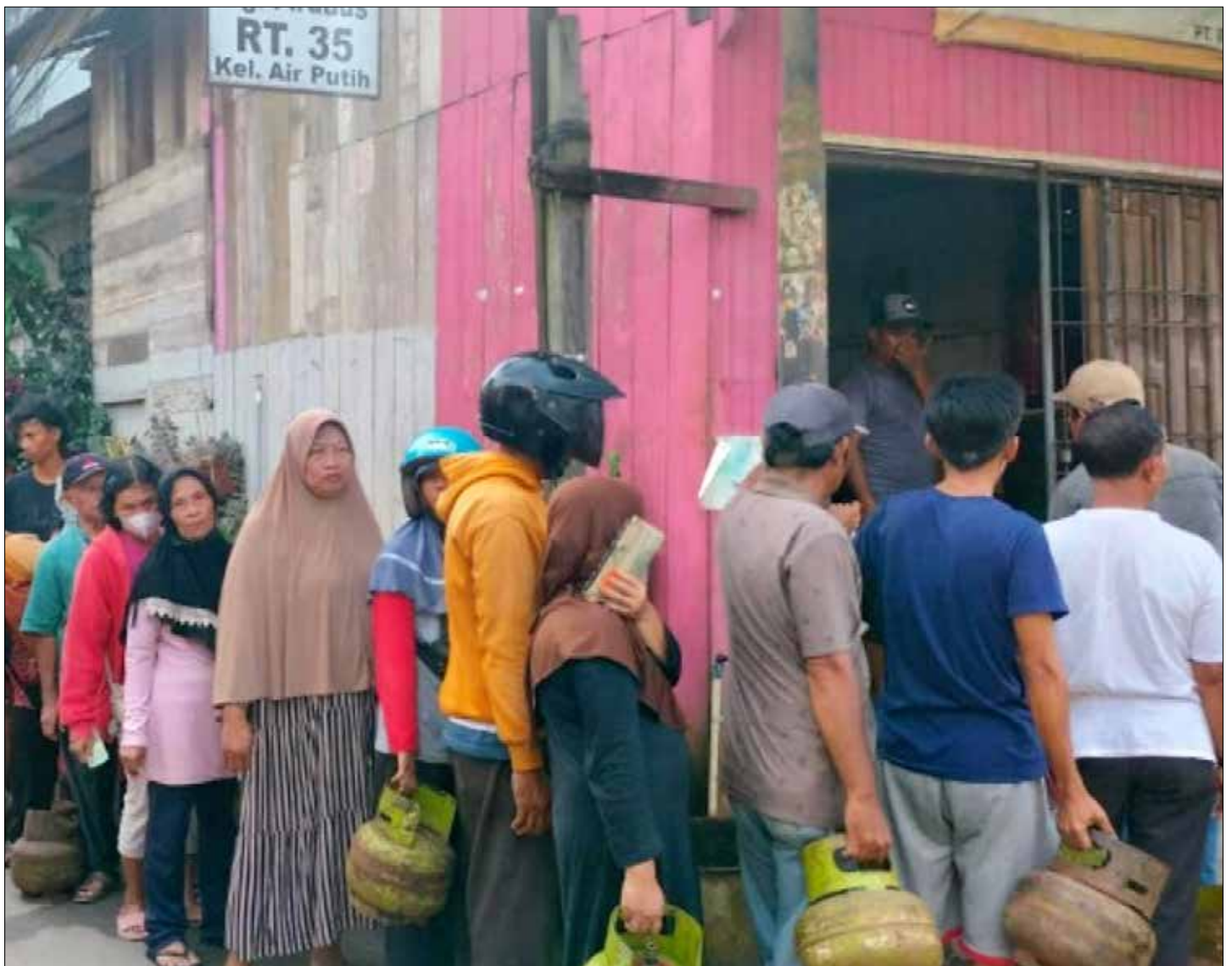
Antrian warga yang mencari gas elpiji di Jalan Suryanata, Kecamatan Samarinda Ulu.

"Sabtu Minggu tidak ada pendistribusian. Pasokan gas mengikuti hari kerja saja. Akibatnya pasokan gas ini kurang lancar," pungkasnya. (vic)