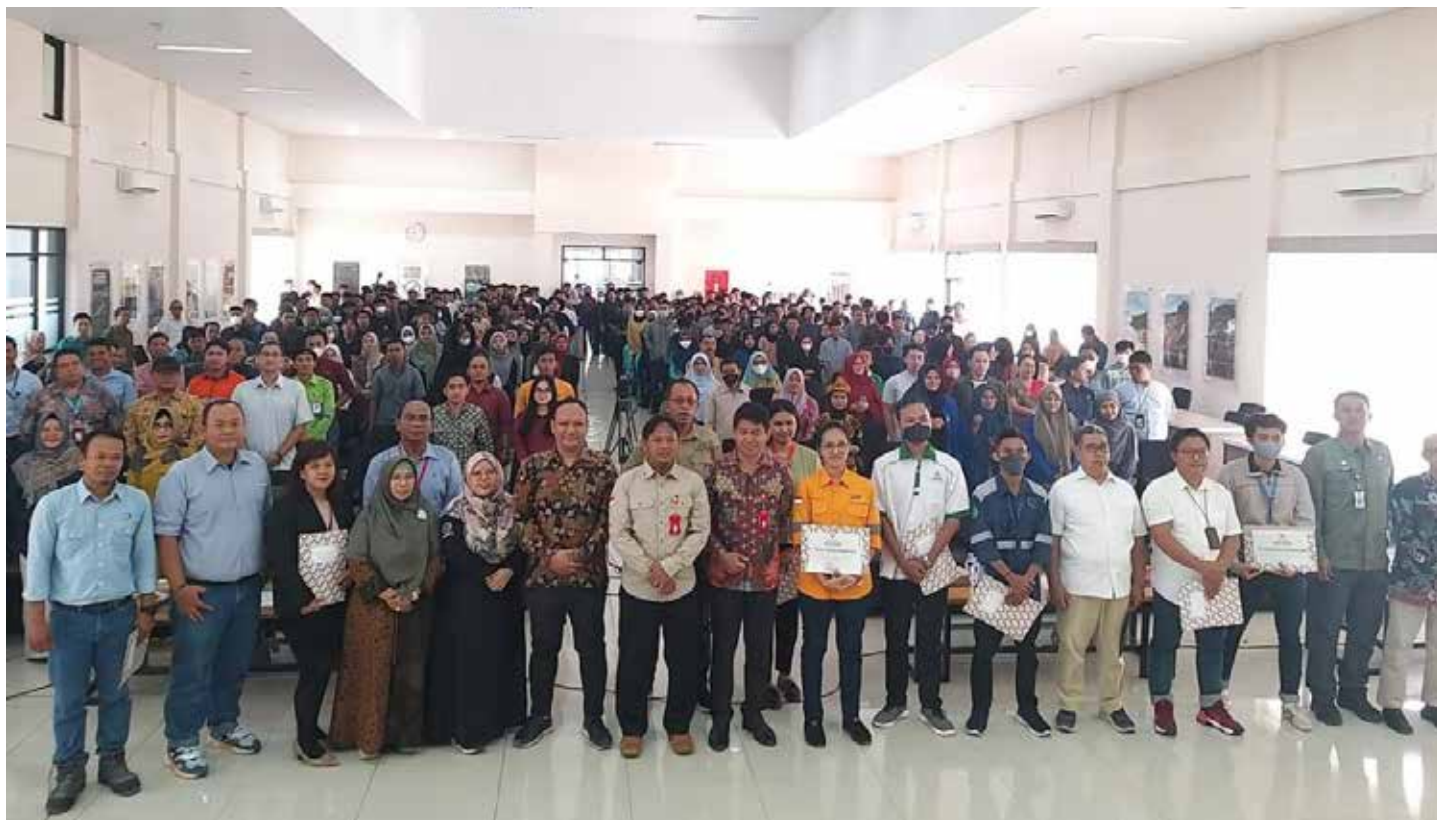
Job fair yang dilaksanakan Disnakertrans Berau di Ruang RPJPD Bapelitbang Berau.