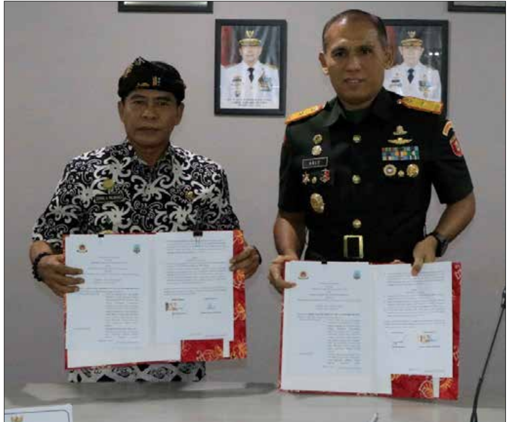
KERJASAMA: Pemprov Kaltara bekerjasama dengan Korem 092/Maharajalila dalam pengerjaan normalisasi Sungai Selor dan Buaya.

Lebih lanjut, mulai pengerjaan normalisasi sungai tersebut akan terbagi menjadi dua. PUPR –Perkim mulai dari Meranti hingga Intake Sungai Buaya, sedangkan Korem dari Kam-