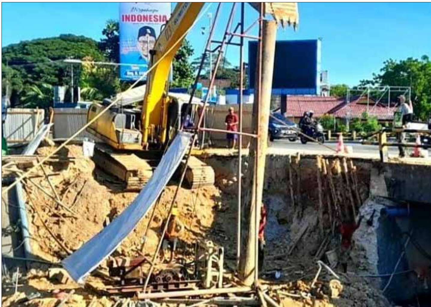
Proses pengerjaan pelebaran selokan di persimpangan BSCC Dome Balikpapan.