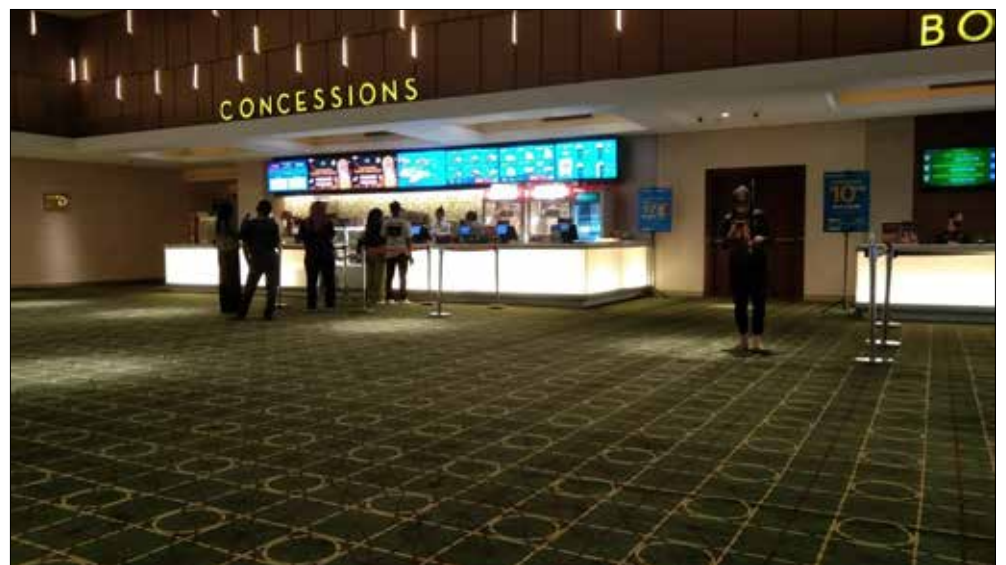
Suasana Bioskop Samarinda Central Plaza.

Meg 2: The Trench memiliki penonton yang tinggi, karena ini merupakan lanjutan peristiwa dari film sebelumnya (The Meg) yang masih menggantung. Rasa penasaran inilah yang menarik penonton untuk