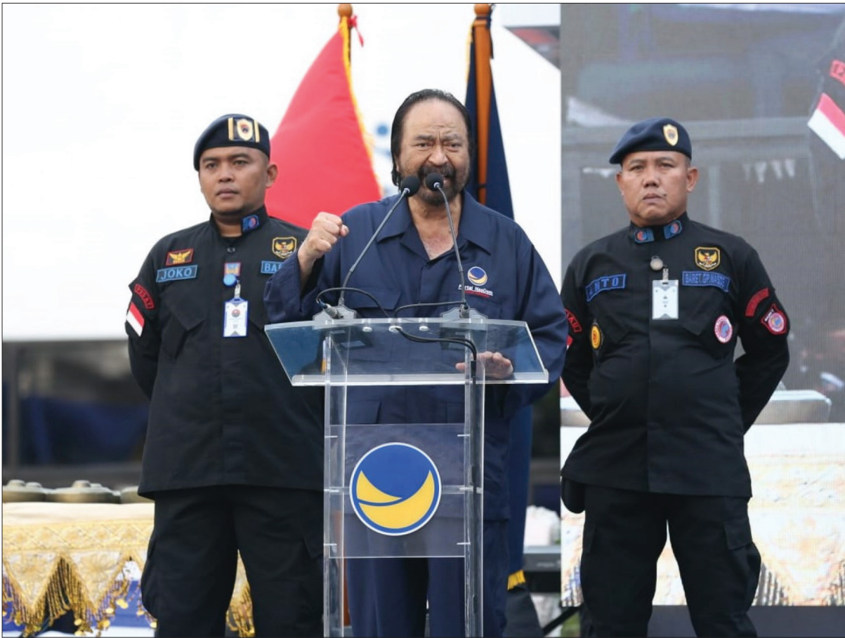
Surya Paloh menghadiri peresmian kantor DPW Nasdem Sumatera Barat.