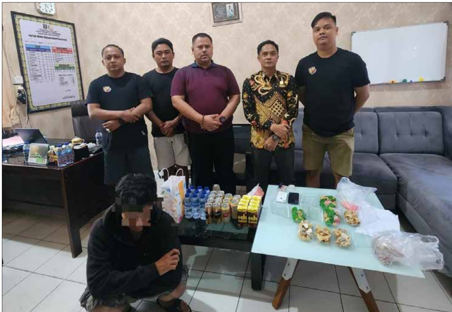
AN saat diamankan petugas Lapas Samarinda.