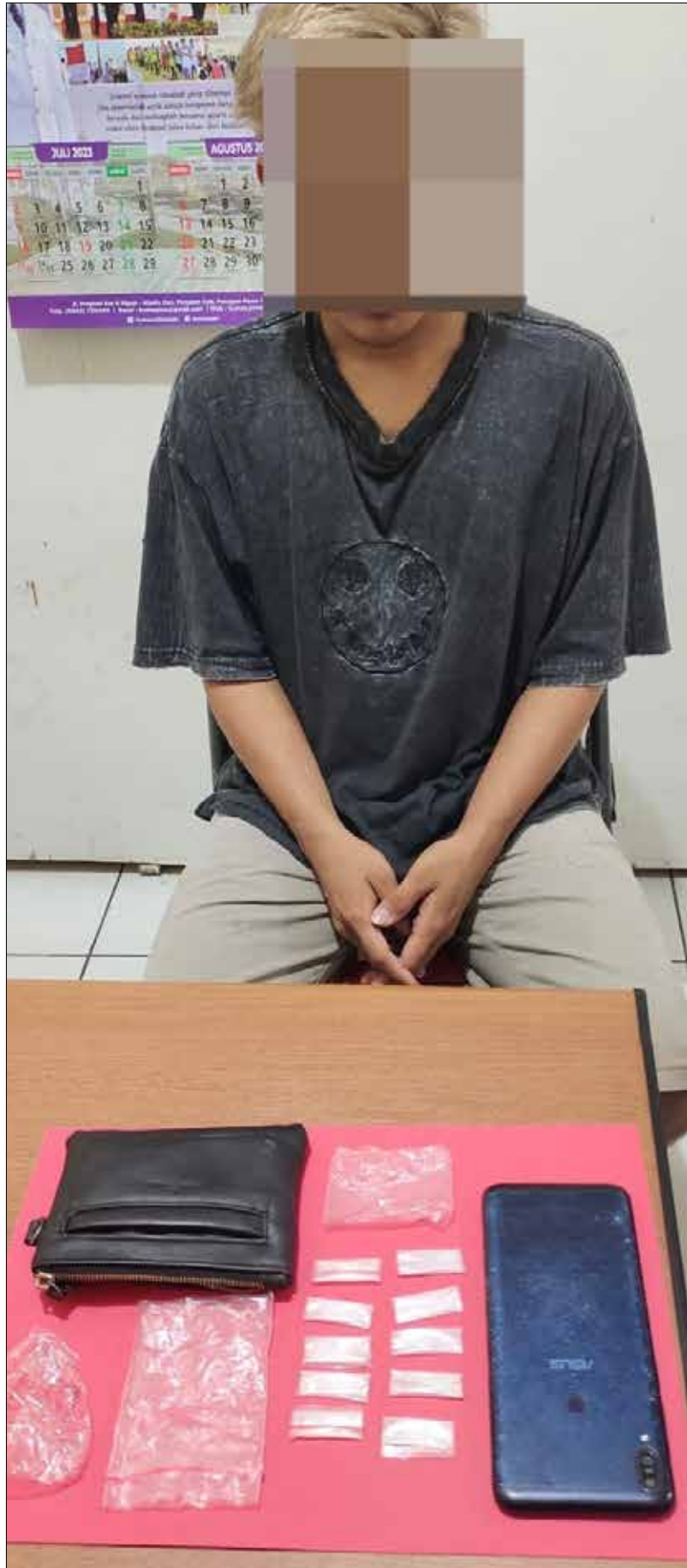
POLRES PPU FOR MEDIAKALTIMGROUP

"Anggota menanyakan dari mana di dapatkan barang tersebut, kemudian HR mengatakan bahwasanya barang tersebut didapatkan dari Do. Terus Kami lakukan penyelidikan," tutupnya. (sbk)