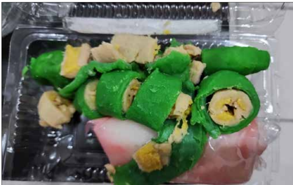
Barang bukti sabu yang ditemukan petugas Lapas Samarinda di dalam makanan pisang ijo.

“Untuk yang mengantar sudah kita serahkan ke Polisi, sementara untuk napi yang memesan kita amankan juga untuk pengembangan lebih lanjut dari pihak kepolisian jika dibutuhkan,” ungkap Hudi.