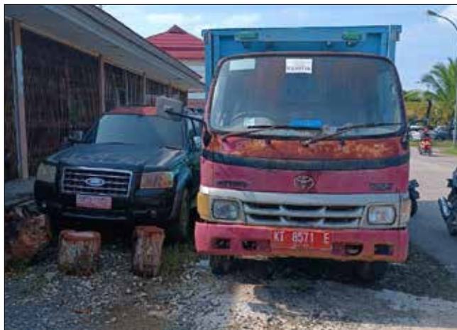
Salah satu unit kendaraan yang bakal dilelang.

"Proses lelang ini terbuka untuk semua pihak, sehingga siapapun dapat mengikuti," tambah Arully.