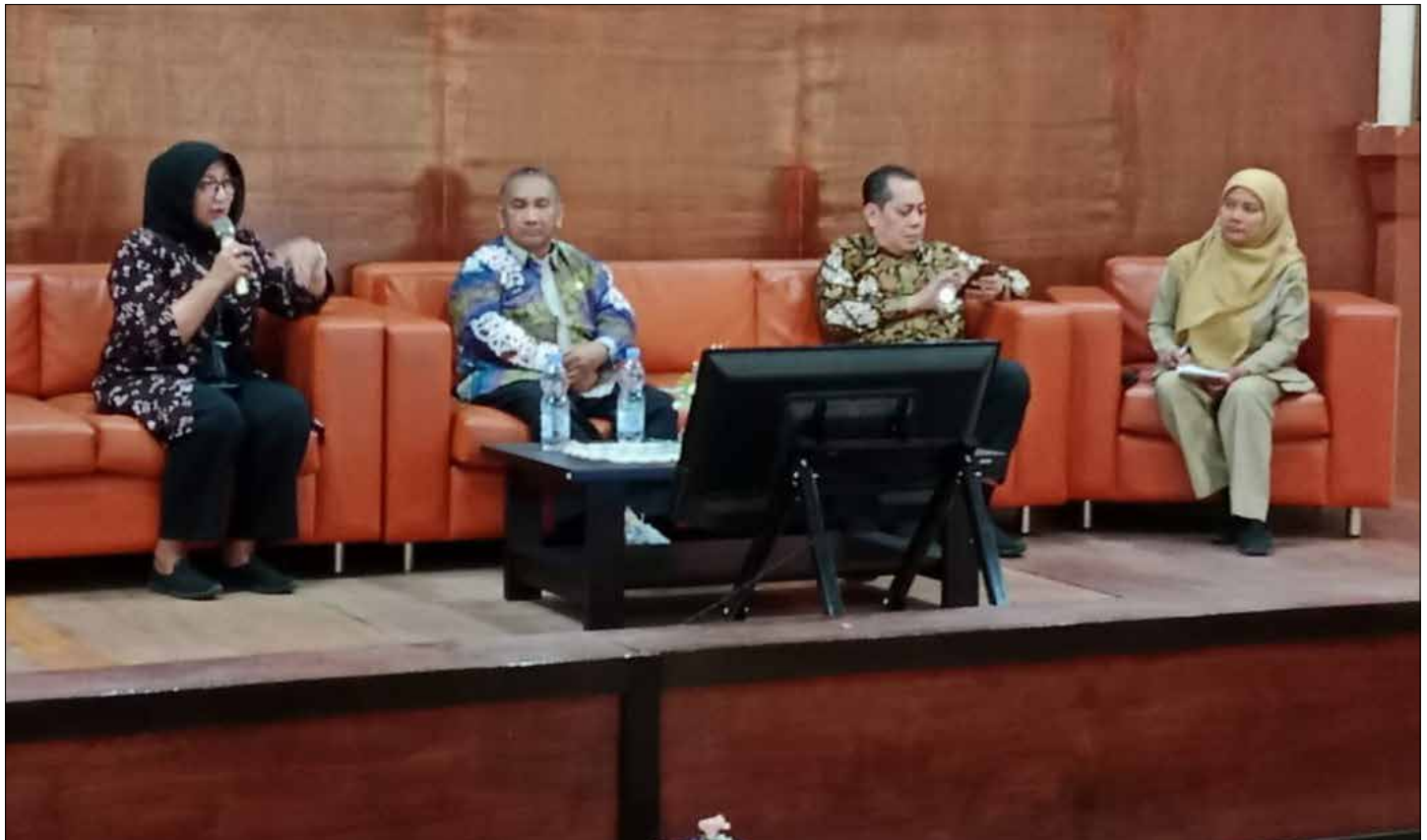
Bimtek Dinas Perpustakaan dan Kearsipan Daerah (DPK) Kalimantan Timur (Kaltim).