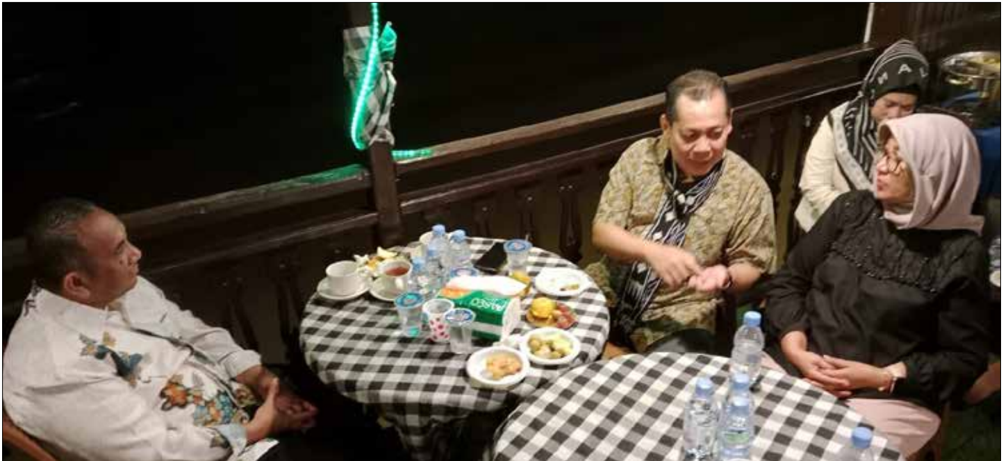
Suasana rapat antara ANRI dan DPK Kaltim di atas kapal Pesut Etam.