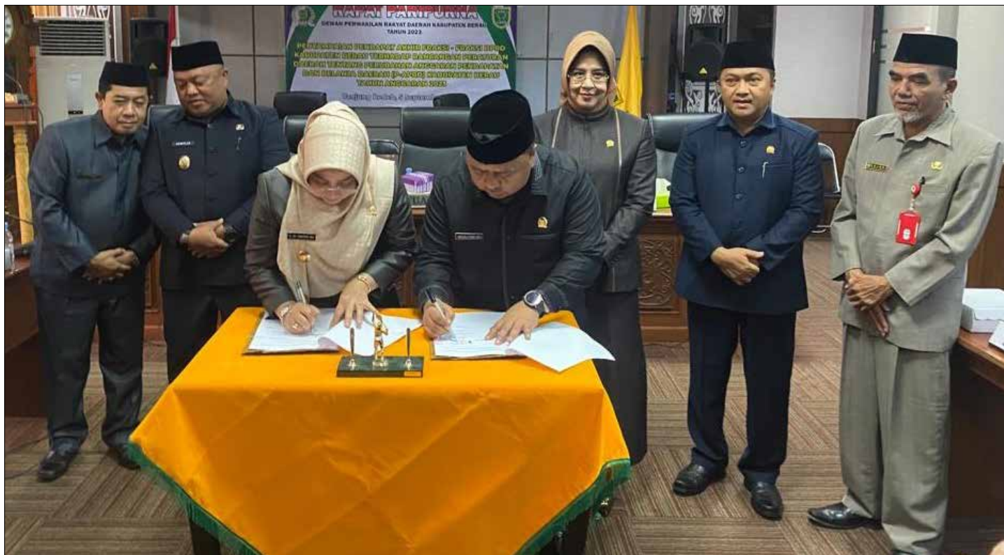
Penandatanganan berita acara persetujuan bersama antara pihak eksekutif dan legislatif.