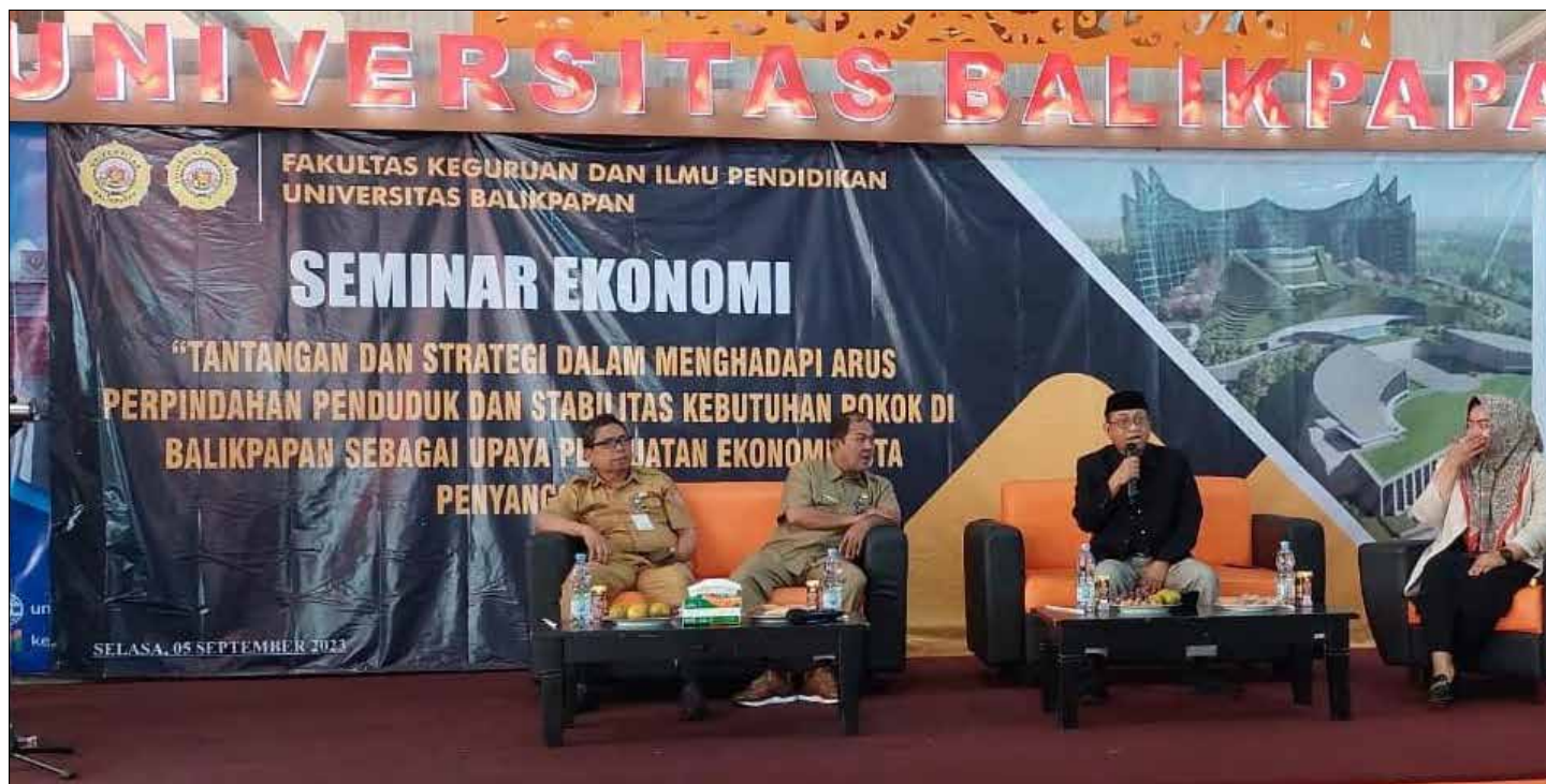
Seminar Ekonomi dengan tema “Tantangan dan Strategi dalam Menghadapi Arus Perpindahan Penduduk dan Stabilitas Kebutuhan Pokok di Balikpapan sebagai upaya penataan ekonomi kota penyangga IKN.