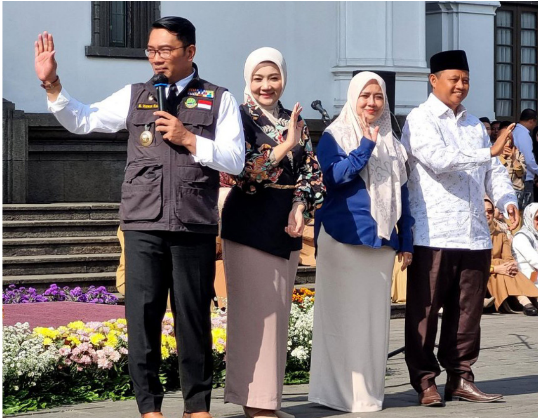
Ridwan Kamil dan istri berpamitan dengan warga.