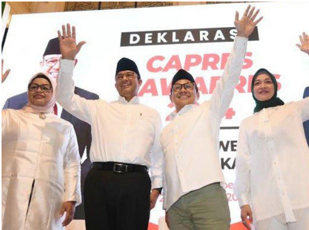
Anies Baswedan dan Muhaimin Iskandar saat deklarasi di Hotel Majapahit (Yamato), Kota Surabaya, Sabtu, 2 September 2023.