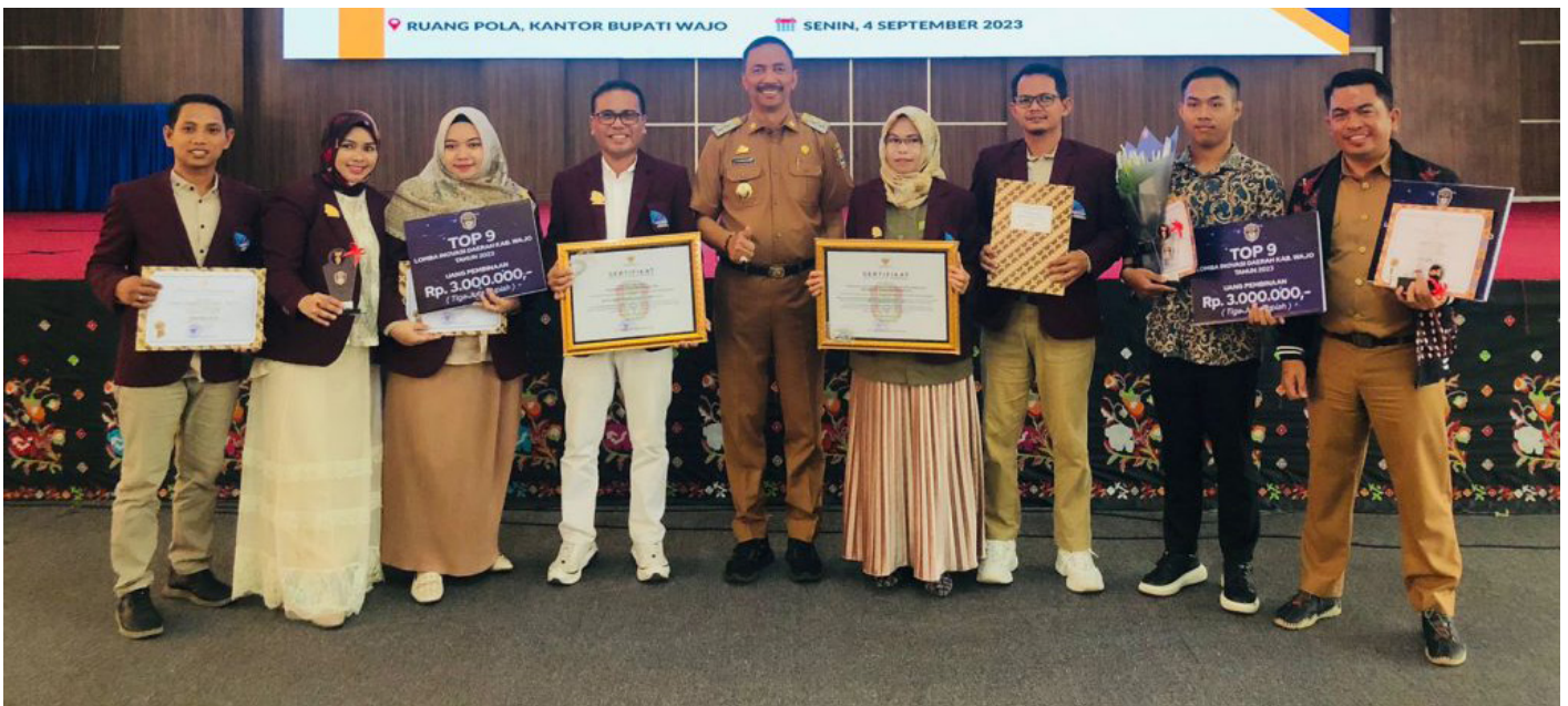
HMS PEMKAB WAJO