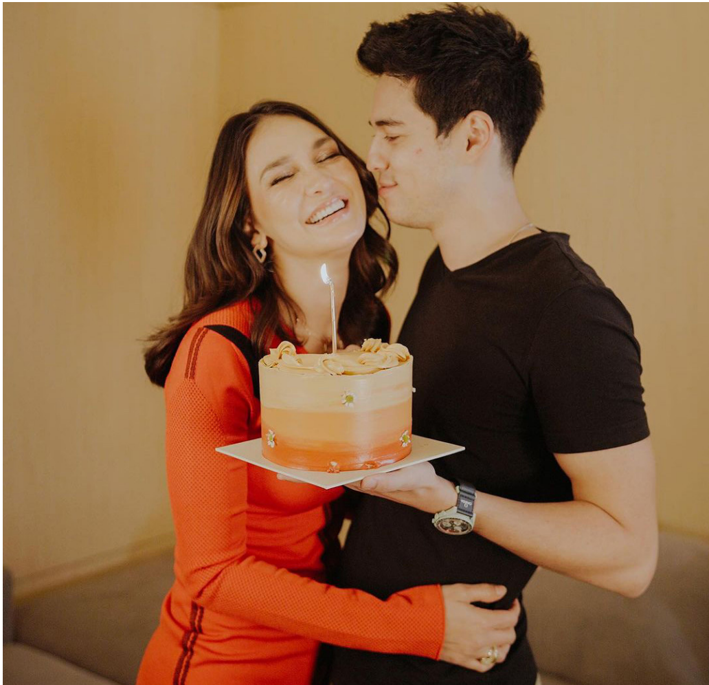
HUBUNGAN SERIUS: Luna Maya dan Maxime Bouttier.