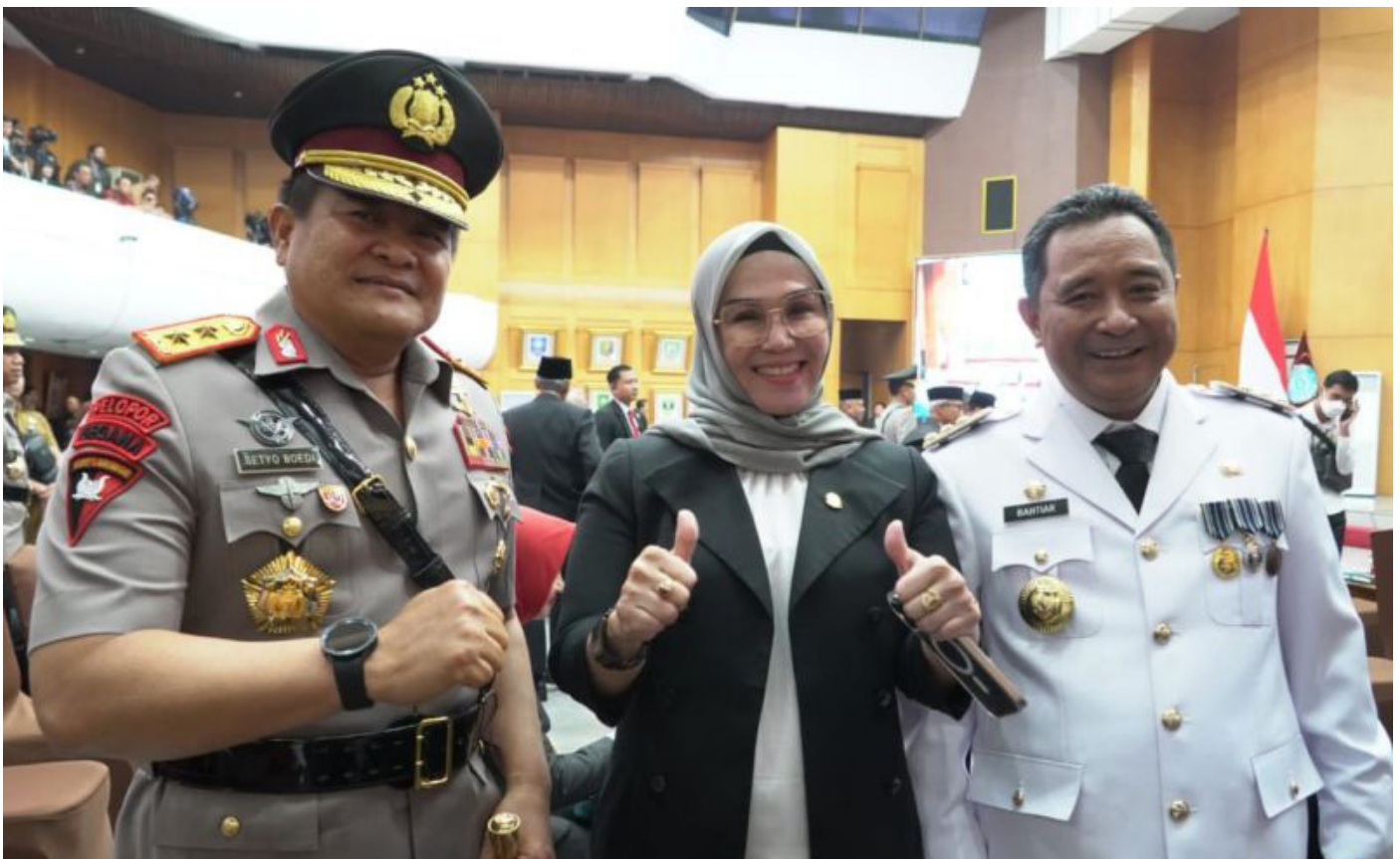
Ketua DPRD Sulsel Andi Ina Kartika Sari (tengah) berfoto mendampingi Pj Gubernur Sulsel Bachtiar Baharuddin (kanan) dan Kapolda Sulsel Irjen Pol Setyo Boedi Moempoeni Harso (kiri) usai pelantikan 10 Pj Gubernur di Jakarta, Selasa (5/9/2023).

Selain itu, tantangan yang akan dihadapi oleh Pejabat Gubernur Sulsel adalah menjalankan tahapan pemilu 2024 dengan baik dan menjaga netralitas Aparatur Sipil Negara (ASN). Ini akan menjadi ujian penting bagi kepemimpinan baru dalam menjalankan tugasnya dalam suasana politik yang kompleks. (KS)