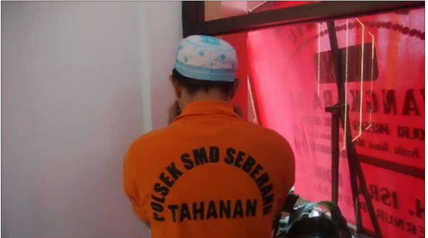
Pelaku TH (38) yang telah ditetapkan sebagai tersangka tindak pencabulan terhadap bocah SD.