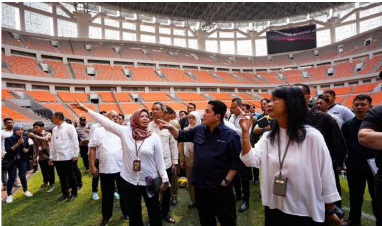
Ketua Umum PSSI Erick Thohir bersama stakeholder sepak bola nasional meninjau kondisi Jakarta International Stadium.