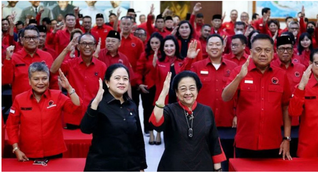
PDIP masih menggodok nama-nama yang nantinya menjadi bacawapres Ganjar Pranowo.