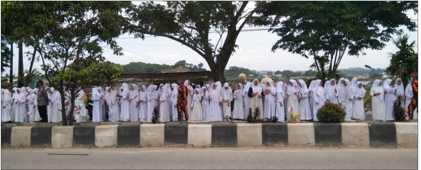
Santri dan Santriwati Menyambut Wakil Presiden Ma'Ruf Amin