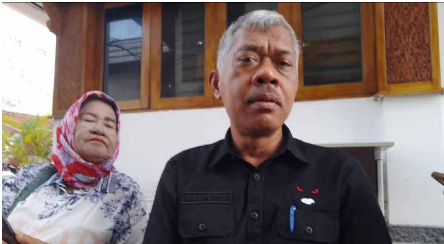
Wakil Ketua DPRD Kota Balikpapan, Budiono