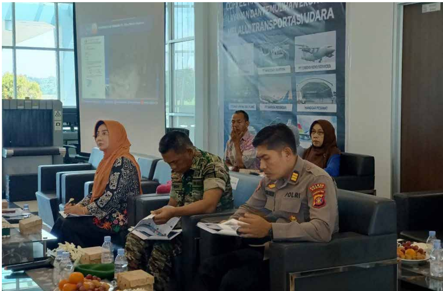
Coffee Morning optimalisasi layanan dan pemulihan ekonomi melalui moda transportasi udara di VIP Room Bandara Kalimantan.