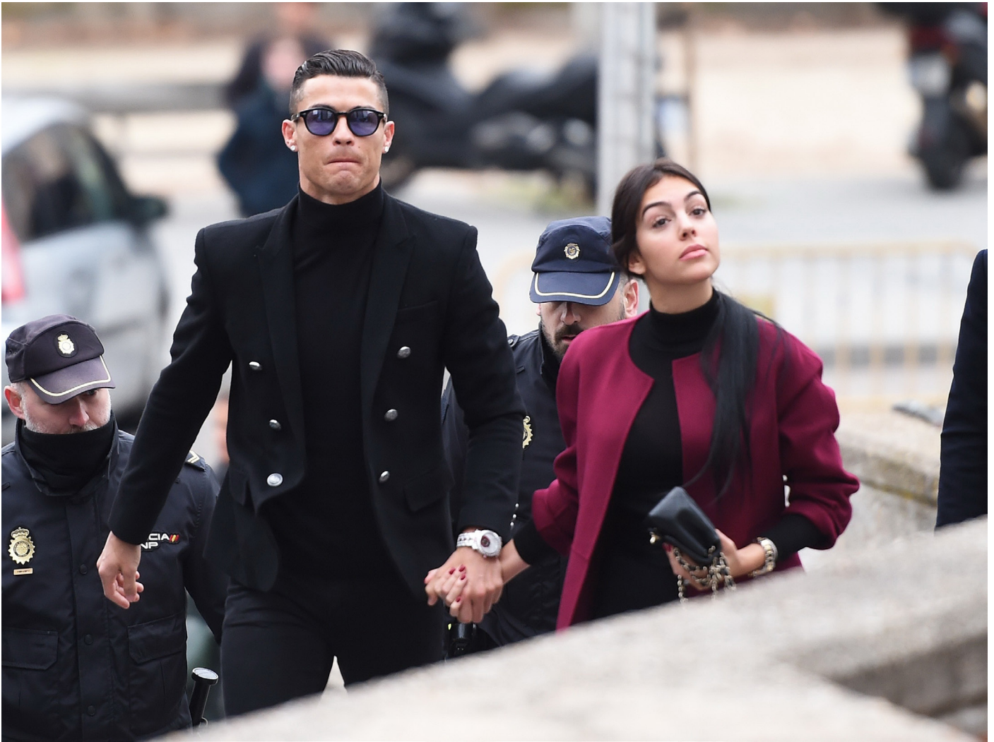
Cristiano Ronaldo dan kekasihnya, Georgina Rodriguez saat berlibur di Istanbul, Turki.