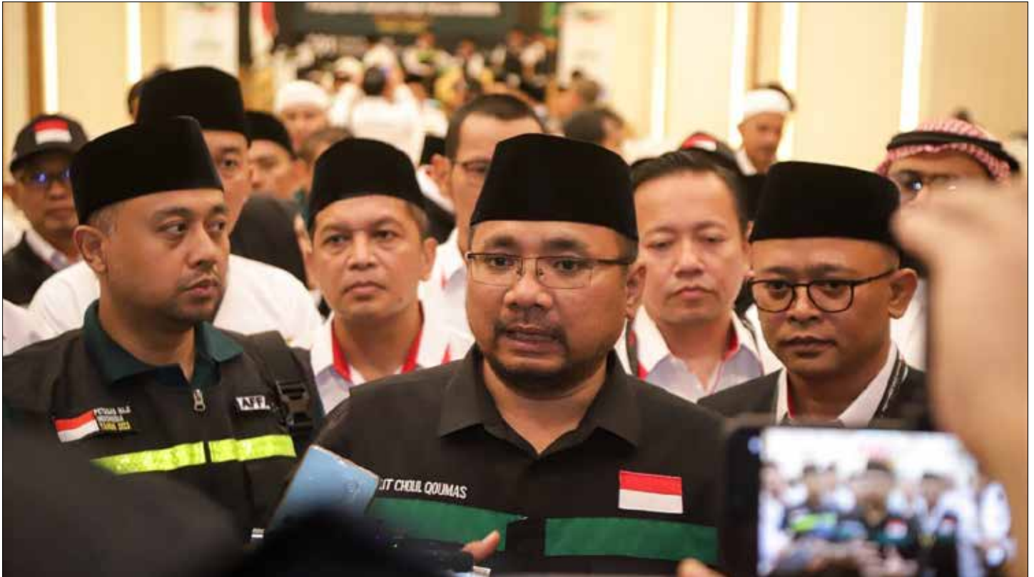
Menteri Agama Yaquut Cholil Qoumas.