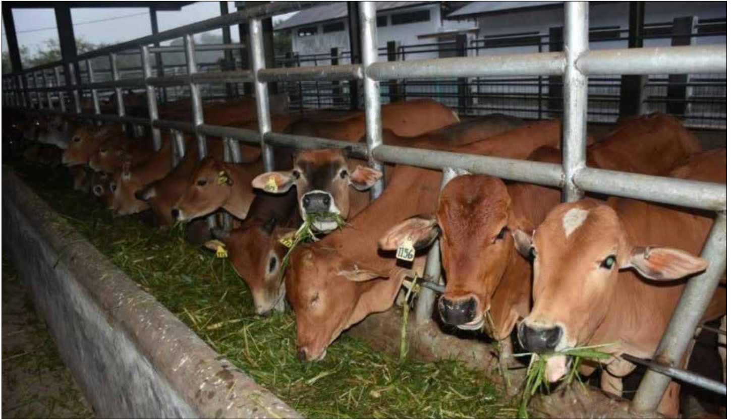
Hewan ternak sapi di Paser.