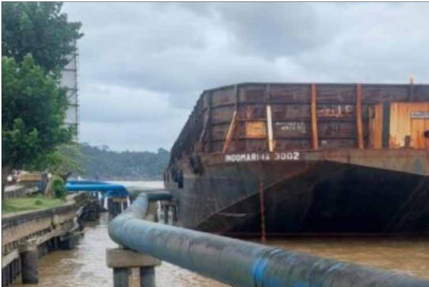
Tongkang yang menabrak pipa Intake Perumdam Tirta Kencana.