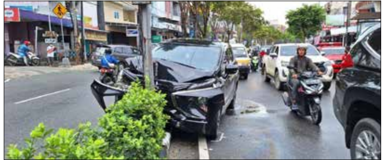
Mobil Mitsubishi Xpander dengan nomor polisi B 2311 PFL ringsek usai hantam tiang listrik di Jalan A Yani, pada Senin (3/7) sekitar pukul 10.00 WITA.

Kendati tidak ada korban jiwa, namun kejadian tetap