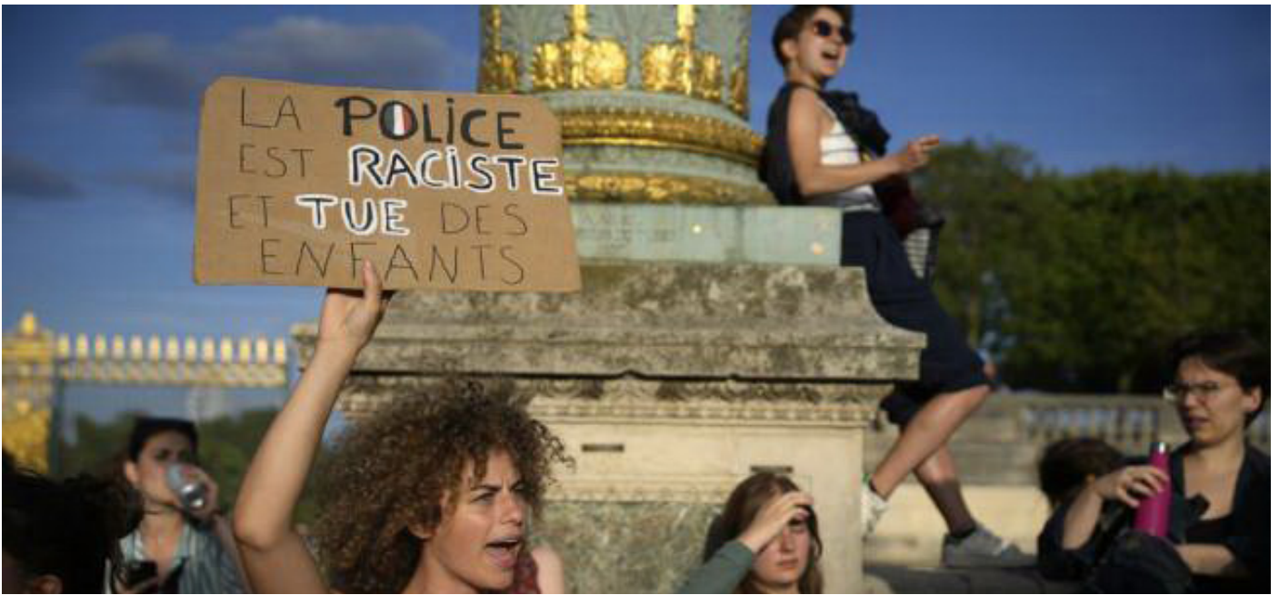
Kematian Nahel yang ditembak seorang polisi menjadi pemantik kerusuhan di Prancis.