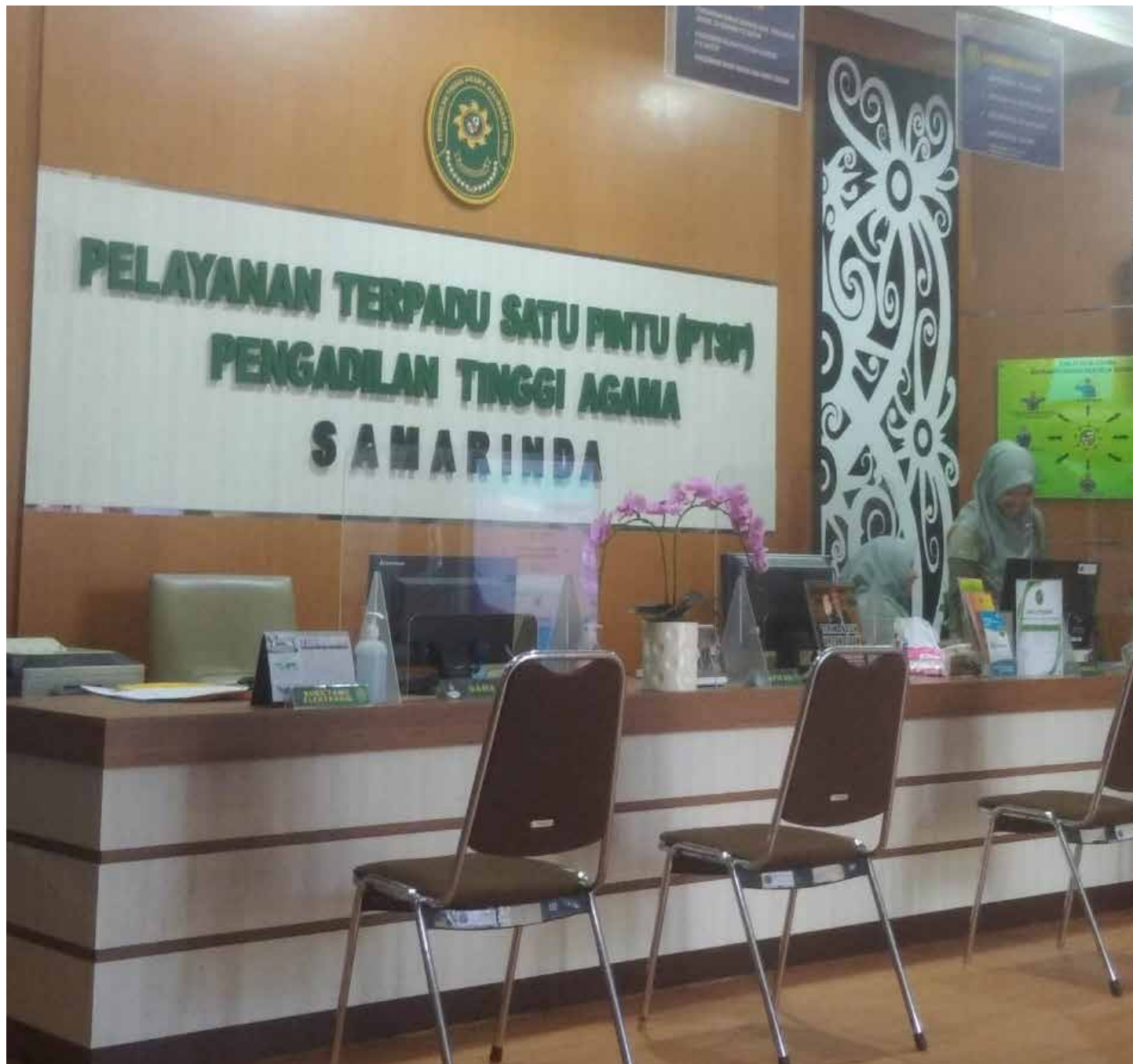
Kantor Pengadilan Tinggi Agama Samarinda.