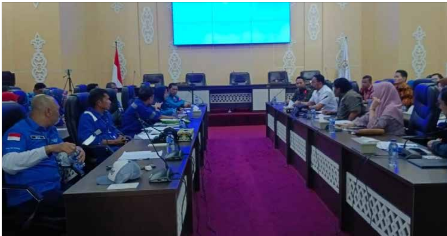
Pertemuan antara SP Naban Bersatu Pertamina dengan Komisi IV DPRD Kota Balikpapan.