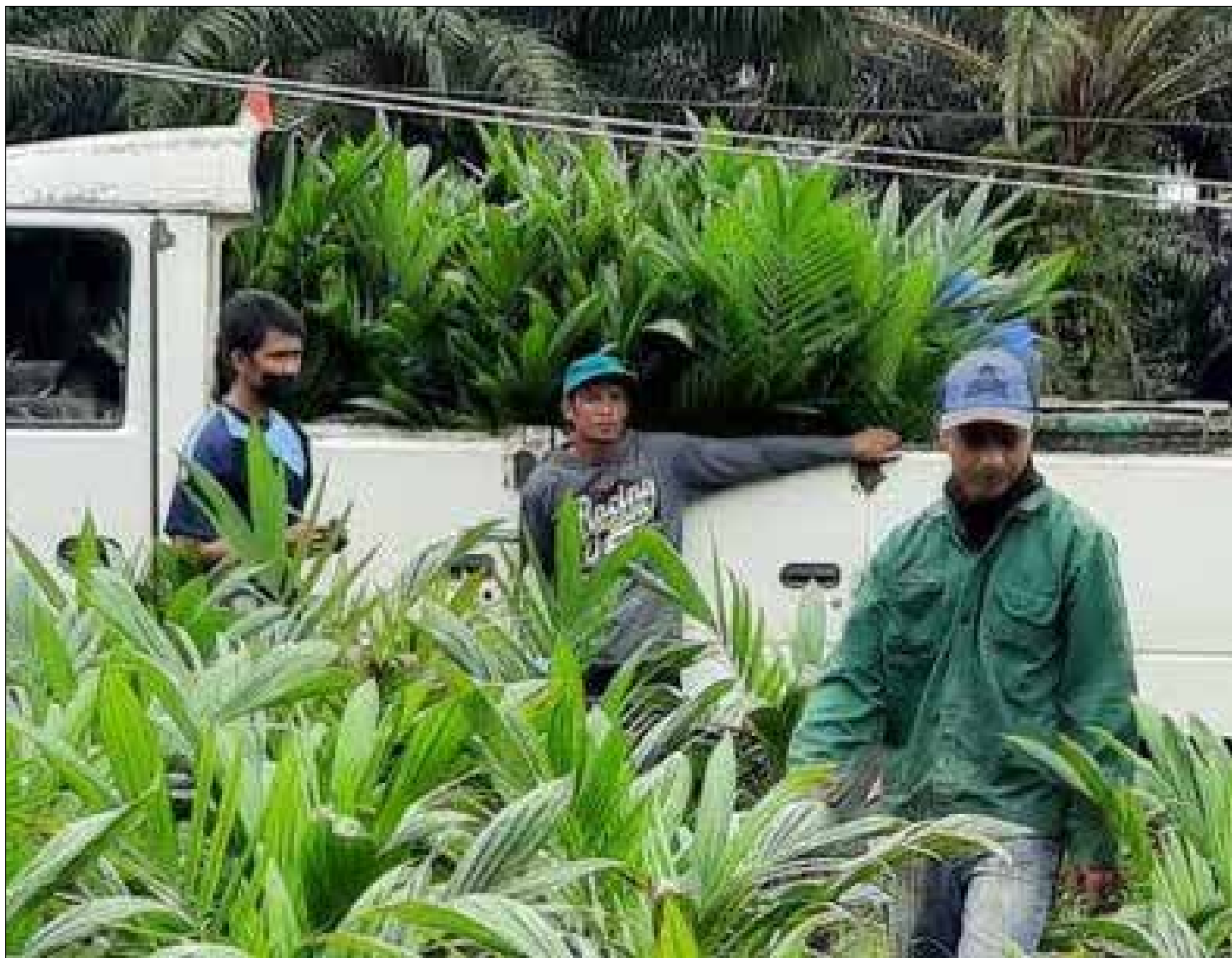
Kelapa sawit dominasi alih fungsi lahan di Paser.