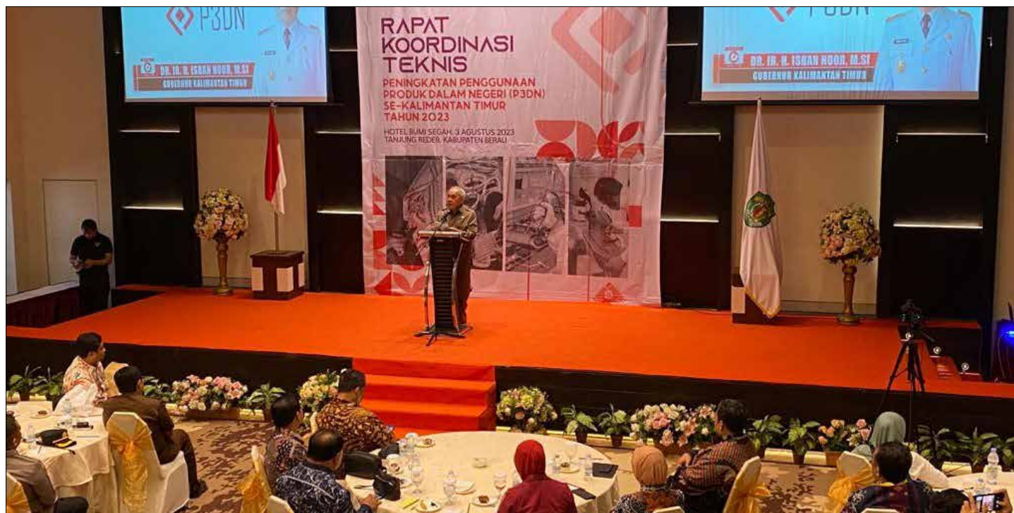
Rakor teknis P3DN se-Kaltim di Hotel Bumi Segah, Kamis (3/8/2023).