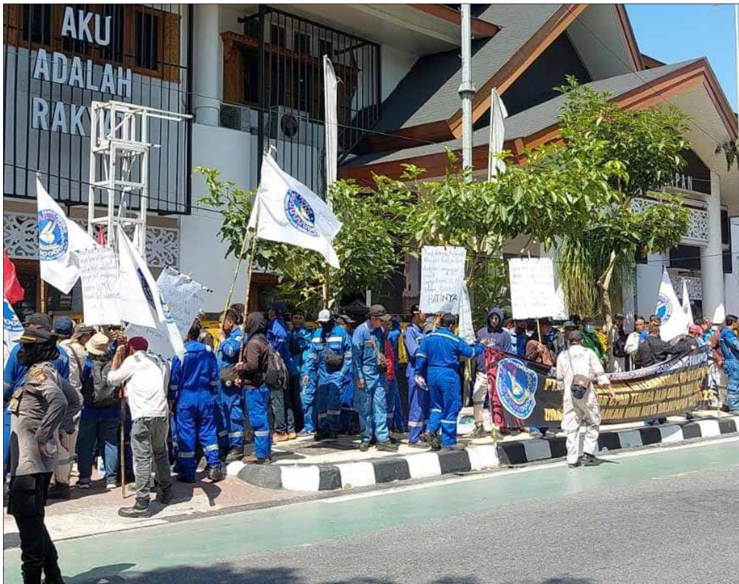
Aksi demo dari SP Naban Bersatu Pertamina di gedung DPRD Kota Balikpapan.