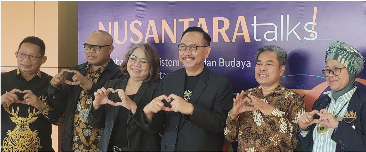
Kepala Otorita Ibu Kota Nusantara Bambang Susantono (ketiga kanan) berfoto bersama sejumlah praktisi seni dan budaya se usai Diskusi Publik bertajuk Membangun Ekosistem Seni dan Budaya di IKN, di Taman Ismail Marzuki, Jakarta, Kamis, 3 Agustus 2023.