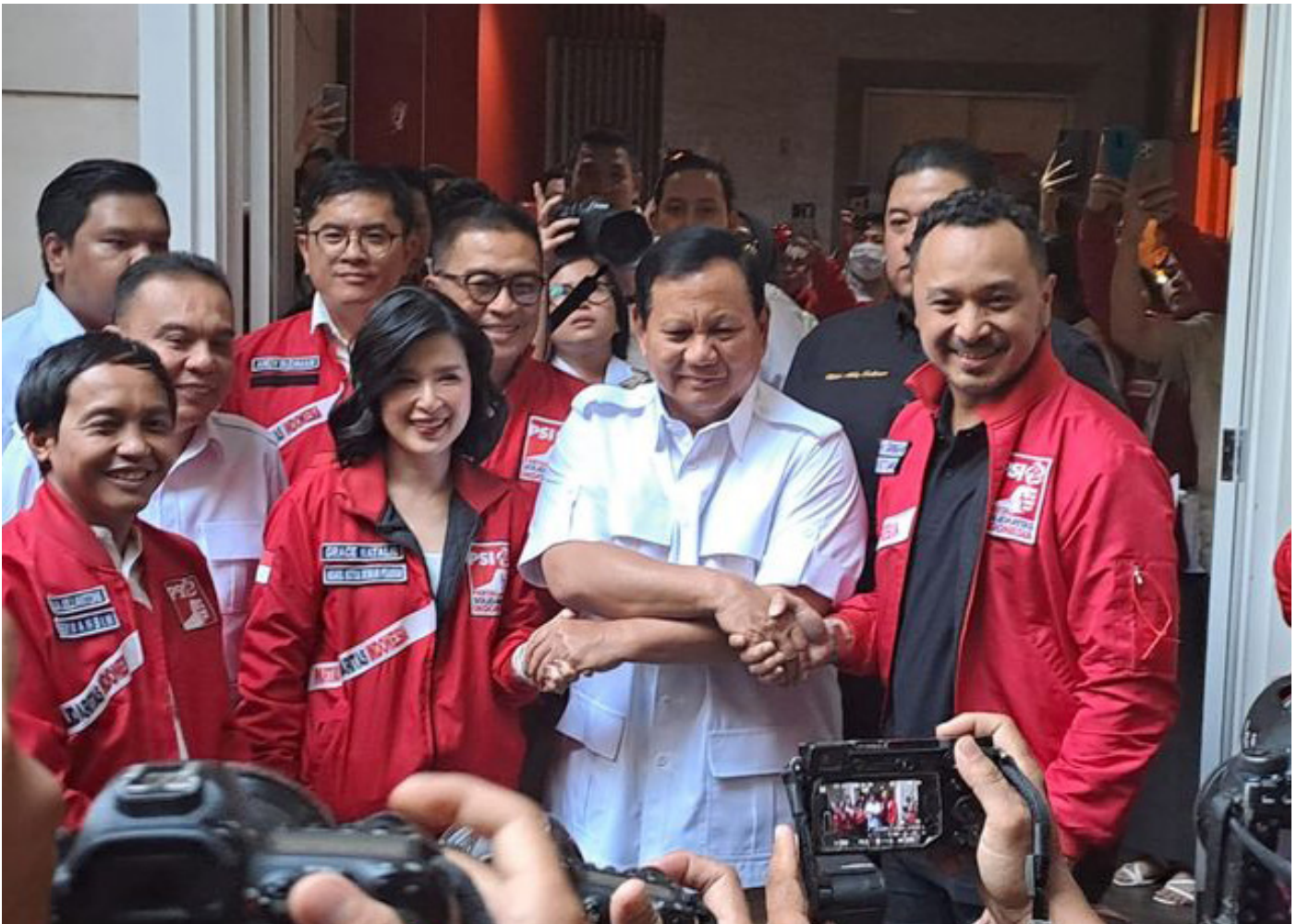
Bakal capres KKIR Prabowo Subianto berkunjung ke kantor DPP PSI.