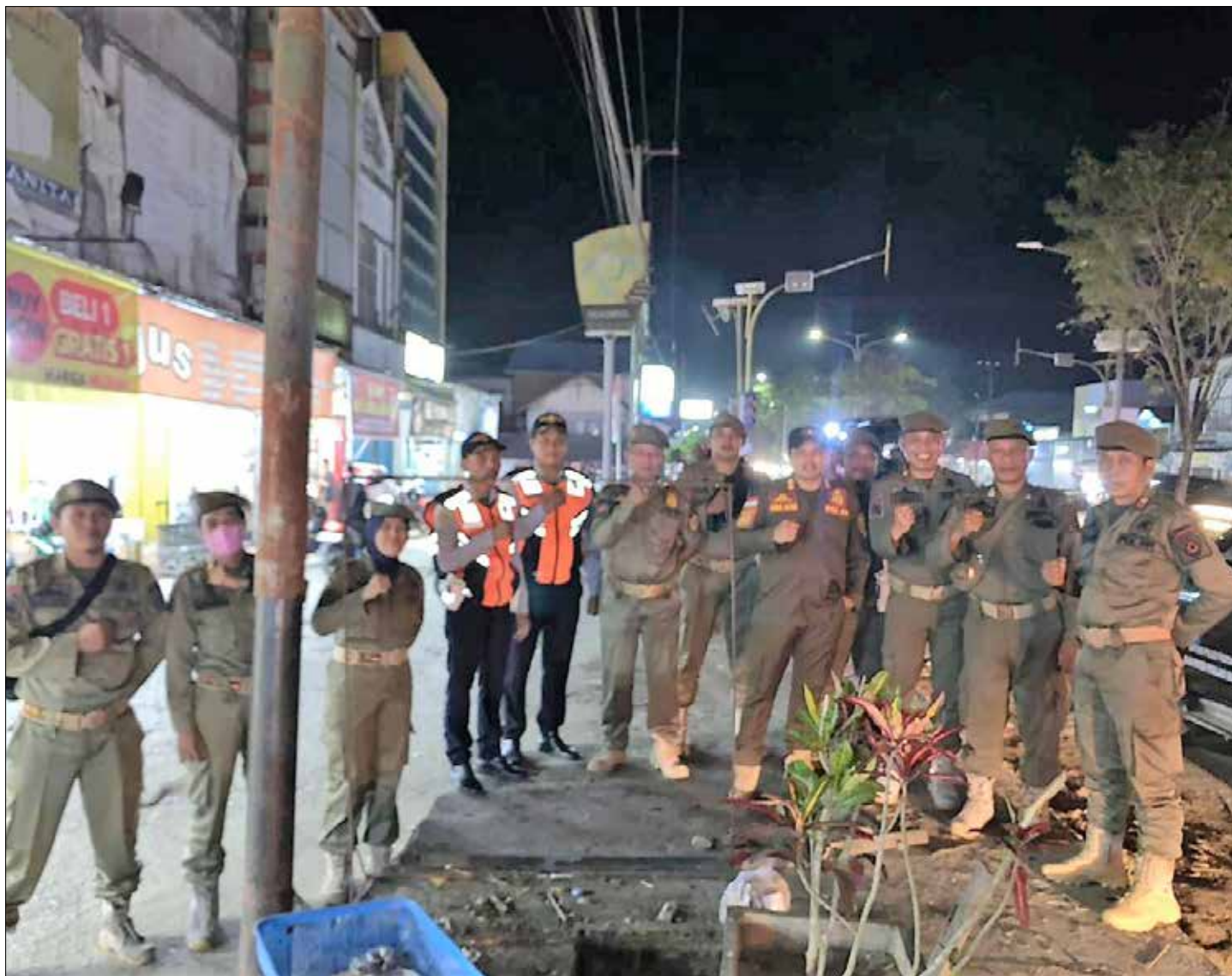
SATPOL PP PPU

Personel Satpol PP PPU bersama im gabungan TNI/Polri dan Dishub PPU saat melakukan patroli cipta kondisi.