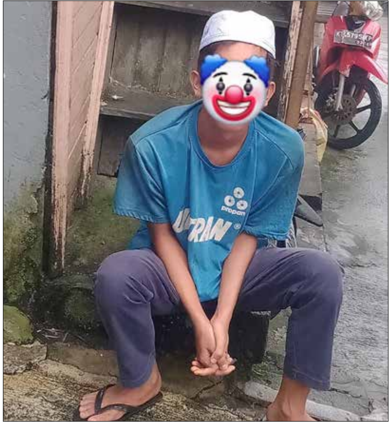
Pelaku usai ditangkap warga atas tindakannya yang nekat masuk kamar perempuan tanpa busana.

"Karena masih anak-anak jadi dilepaskan, tapi kami sudah dapat informasi rumahnya, dia warga Gang Slewangan Klandasan," ujar Kadir lagi.