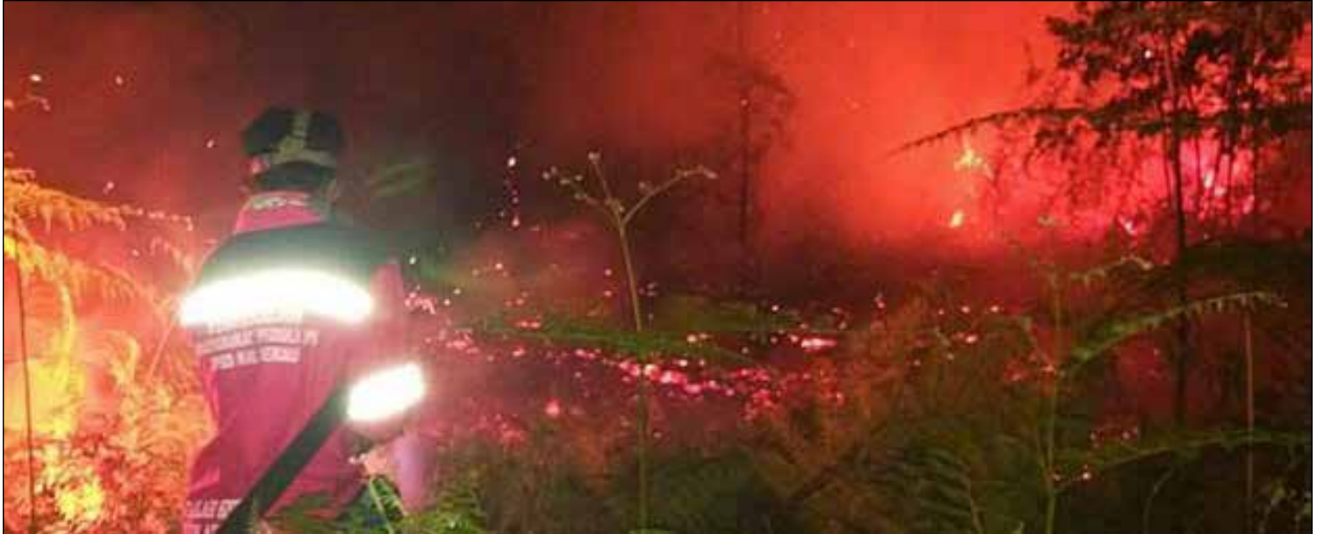
Kebakaran hutan dan lahan yang terjadi di kawasan Kampung Tanjung Batu beberapa waktu lalu.