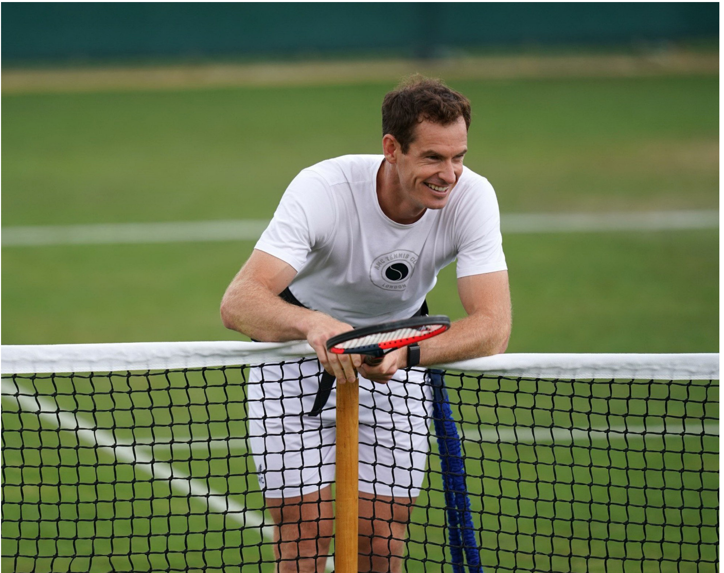
Andy Murray bersiap tampil di Wimbledon, menghadapi Ryan Peniston.