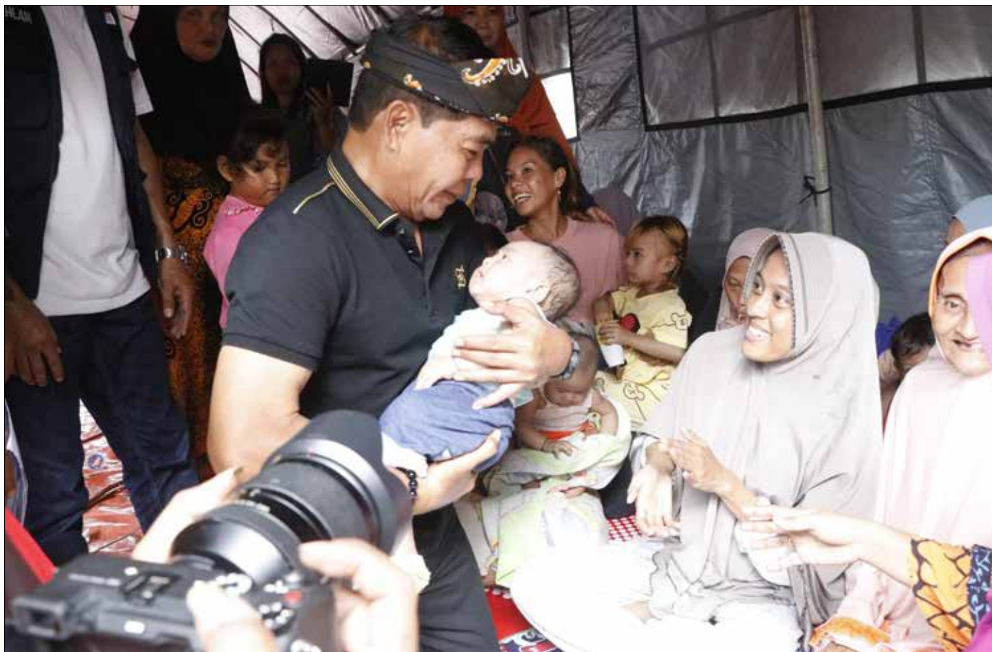
Gubernur Kaltara, Zainal Paliwang meninjau lokasi kebakaran di RT 21 Jembatan Bongkok, Kelurahan Karang Anyar Pantai, Kecamatan Tarakan Barat pada Jumat (30/6).