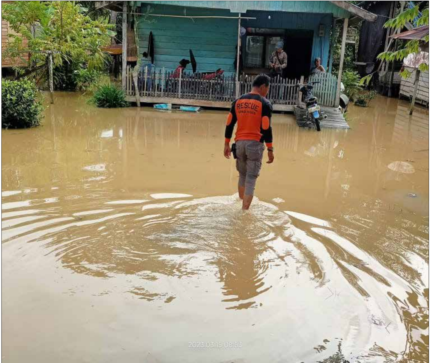
Kondisi banjir di Kecamatan Long Kali, Maret 2023 lalu.