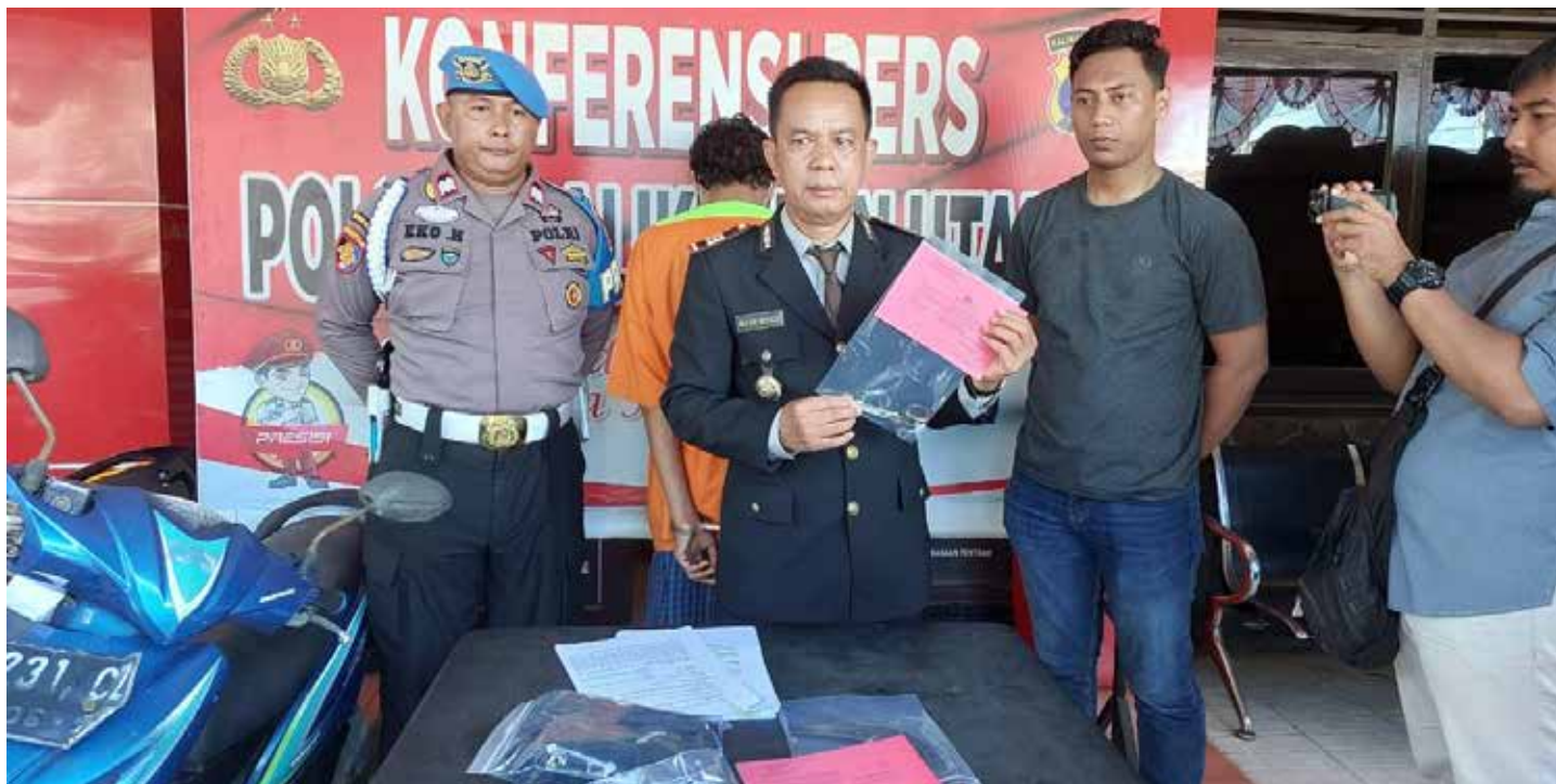
Pelaku IW yang merupakan pencuri kotak infaq juga spesialis pelaku curanmor antar kota.