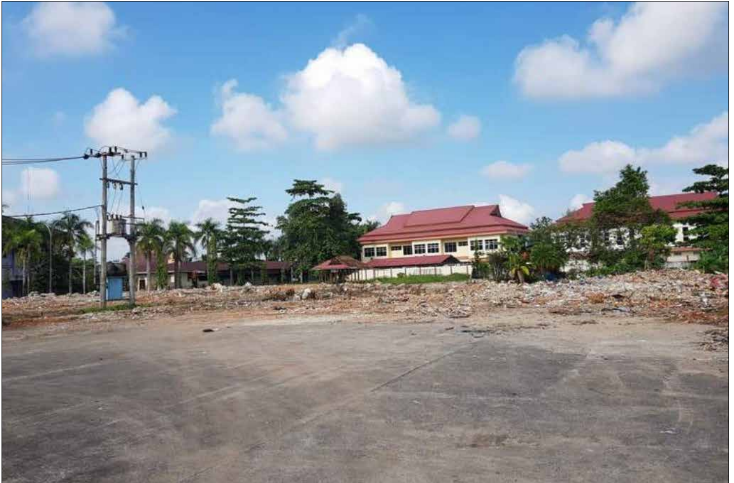
Lokasi pembangunan gedung perpustakaan baru.