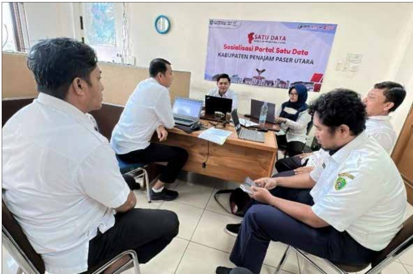
DOK DISKOMINFO PPU

Rapat persiapan penyusunan dokumen SPSS beberapa waktu lalu.