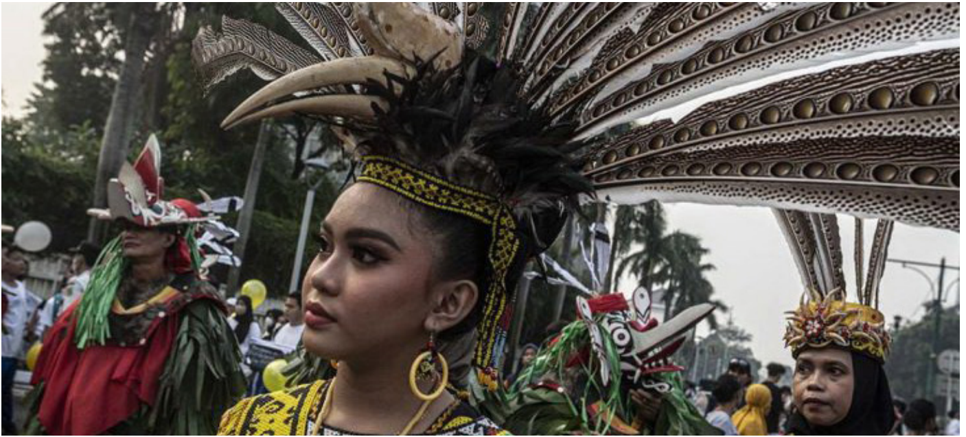
Tim Kesenian UPTD Taman Budaya Dinas Pendidikan dan Kebudayaan Kaltim mengikuti karnaval budaya di kawasan Bundaran HI, Jakarta, Minggu, 25 Juni 2023