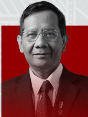
Prof. Dr. Mohammad Mahfud MD, S.H., S.U., M.I.P. Menteri Koordinator Bidang Politik, Hukum, dan Keamanan Republik Indonesia ** Subject to confirmation