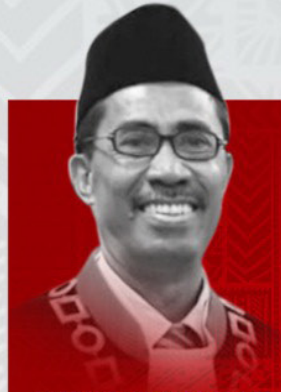
Dr. Daniel Yusmic Pancastaki Foekh, S.H., M.Hum Hakim Mahkamah Konstitusi