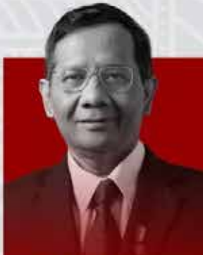
Prof. Dr. Mohammad Mahfud MD, S.H., S.U., M.J.P. Menteri Koordinator Bidang Politik, Hukum, dan Keamanan Republik Indonesia Subject to confirmation