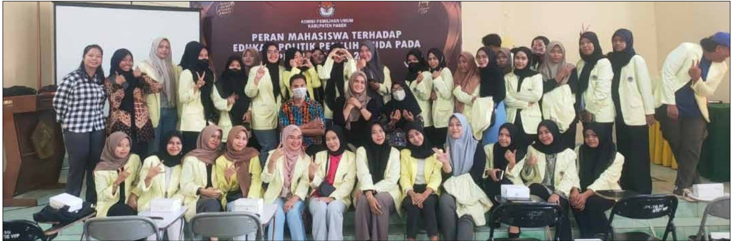
Komisioner KPU Kabupaten Paser saat berdialog dengan Mahasiswa.