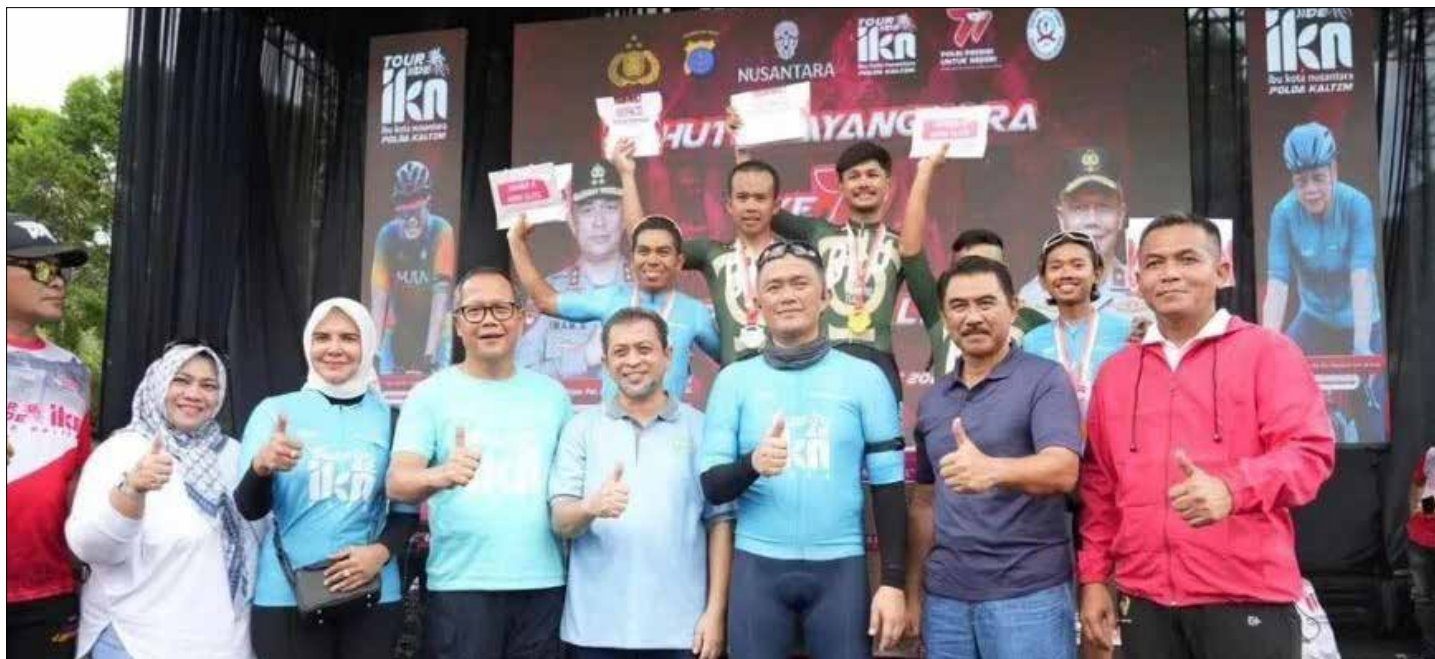
Balap Sepeda Tour de IKN 2023 Meriahkan HUT Bhayangkara ke-77 di Kaltim, Wagub dan Kapolda Beri Hadiah.