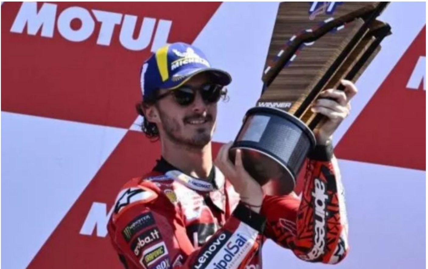
Francesco Bagnaia berhasil menjadi yang tercepat di GP Belanda.