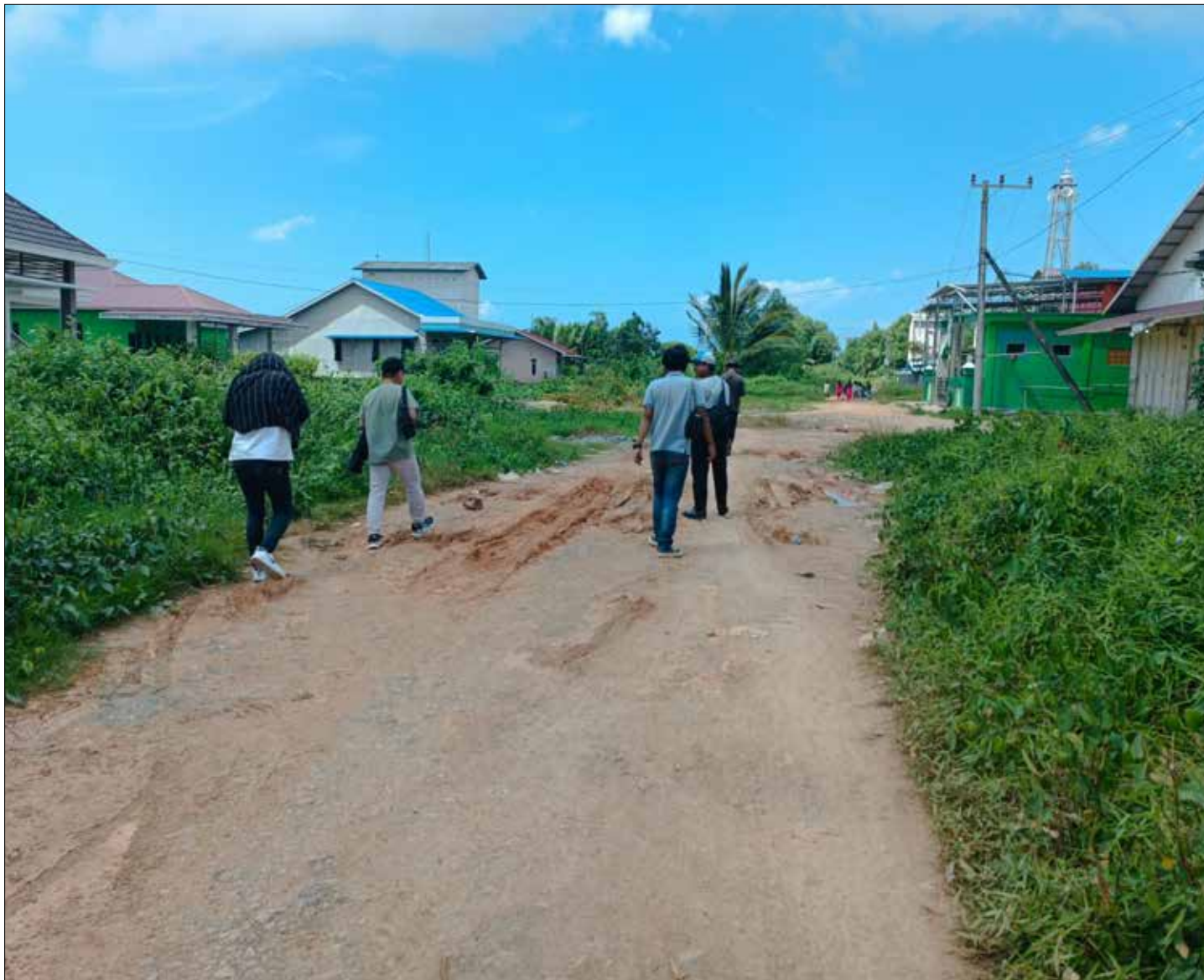
Kondisi jalan di Desa Muara Pasir