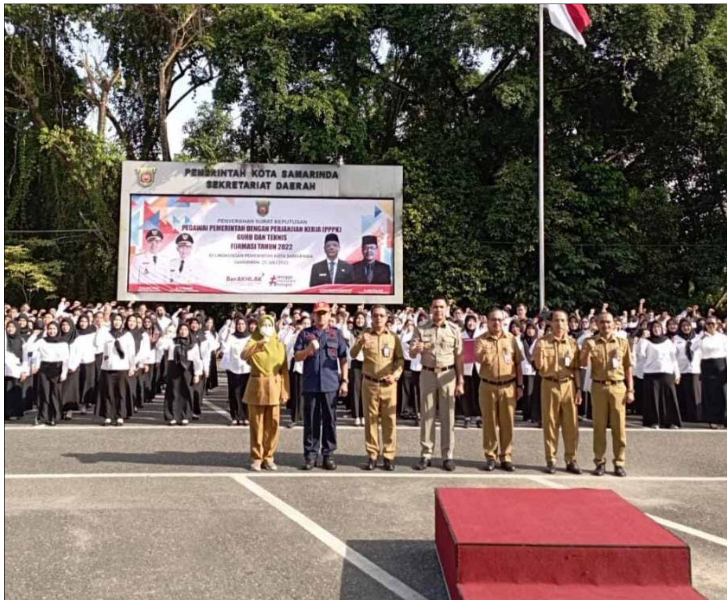
Suasana pelantikan 644 PPPK di lingkungan Pemkot Samarinda, di halaman Balaikota Samarinda, Selasa (25/7/2023).