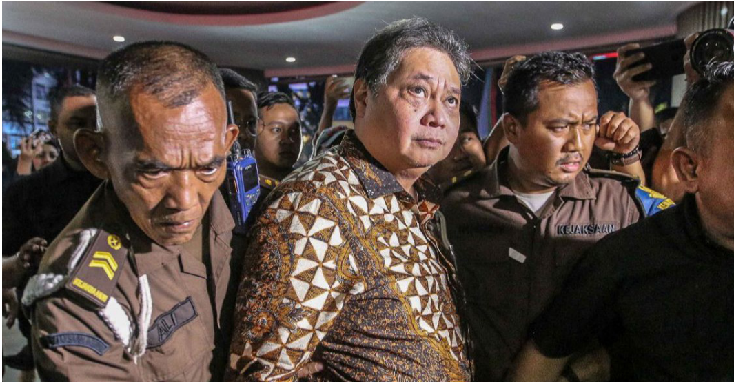
Airlangga Hartarto menjalani pemeriksaan di Kejaksaan terkait kasus korupsi izin ekspor Crude Palm Oil (CPO) dan produk turunannya.