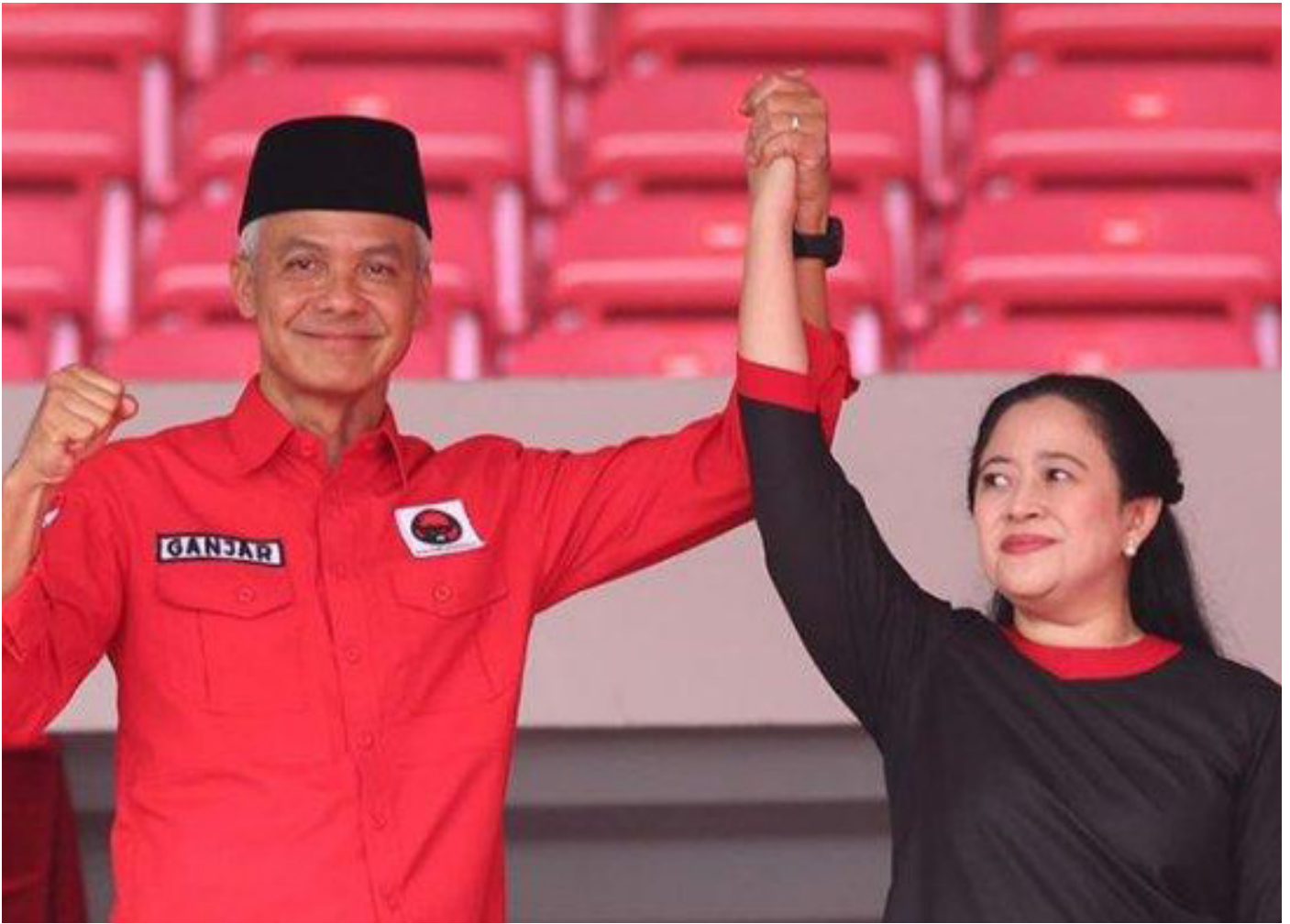
Puan Maharani bersama bakal capres PDIP Perjuangan Ganjar Pranowo.