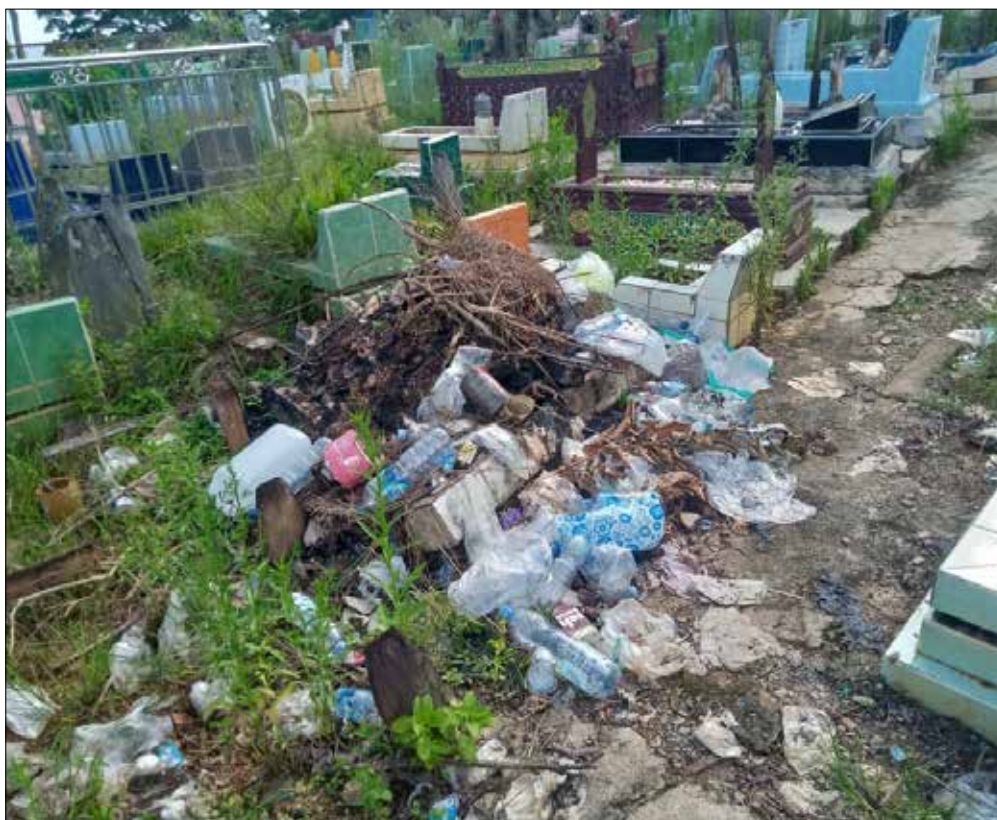
Penumpukan sampah di TPU Semumun.

Sementara itu, beberapa waktu lalu, tumpukan sampah di Tempat Pemakaman Umum (TPU) Semumun, Jalan Jendral Sudirman, Kelurahan Tanah Grogot juga demikian. Penumpukan tanpa pengangkutan