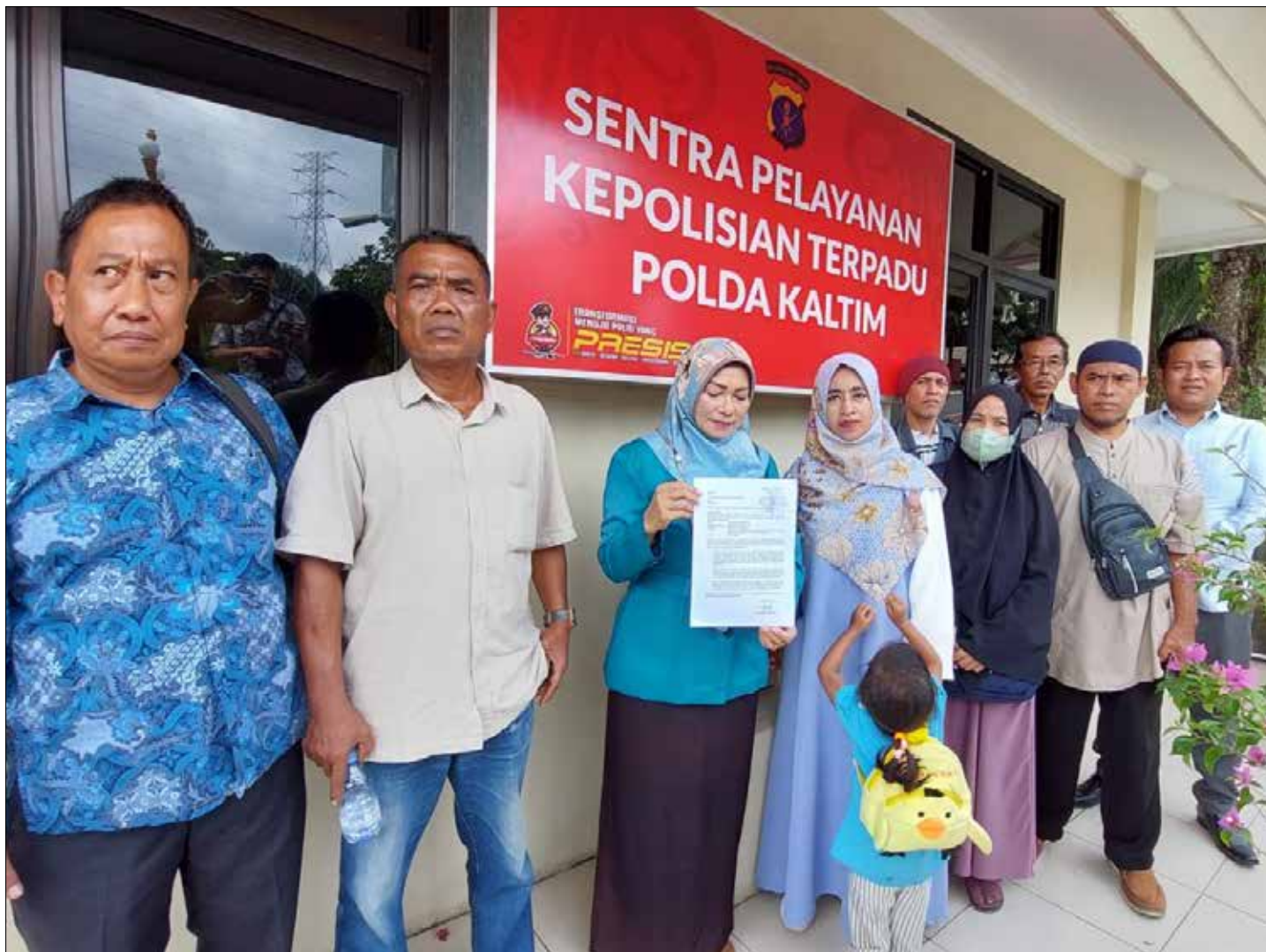
Warga RT 52 GPA mendatangi Polda Kaltim untuk membuat laporan dugaan pidana kepada pengembang Daun Village.