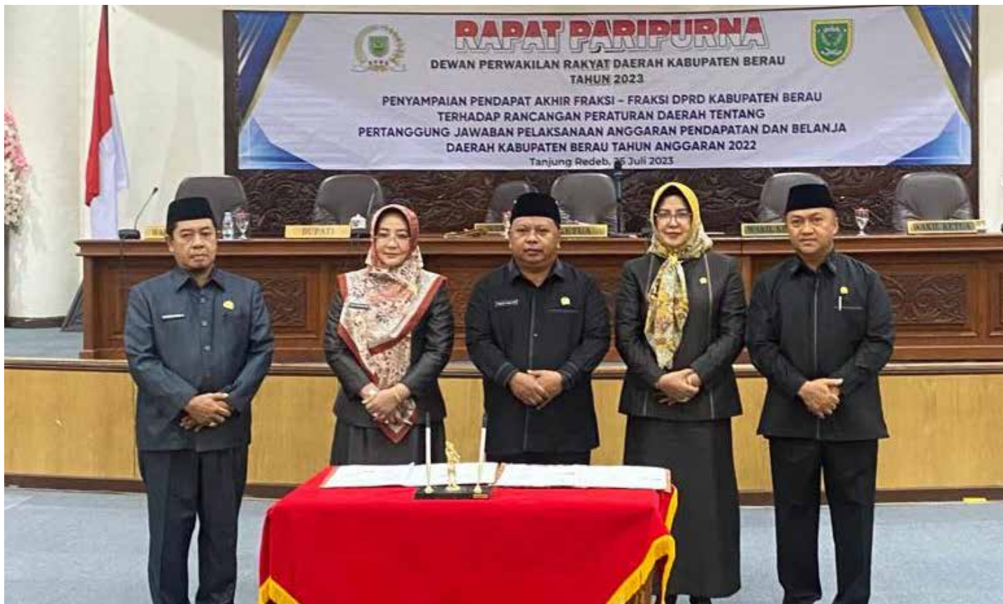
Rapat paripurna menyampaikan akhir fraksi terhadap Raperda Pertanggungjawaban APBD Berau 2022, Selasa (25/7/2023).