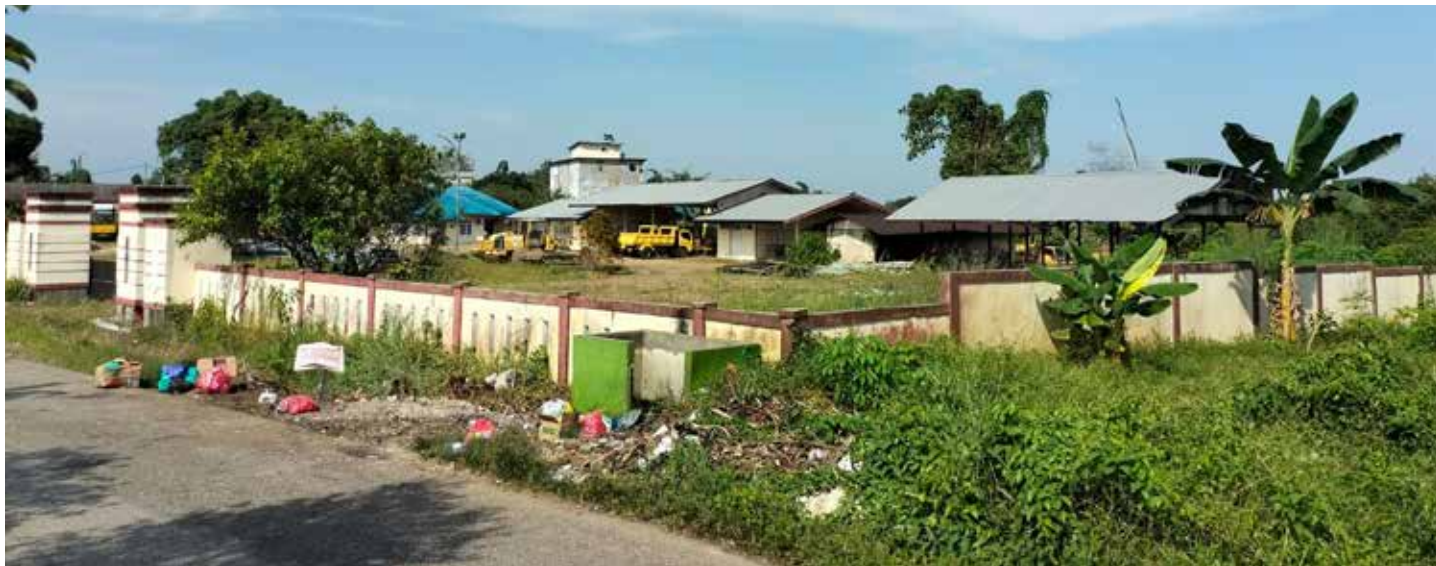
Penumpukan sampah di salah satu TPS, Desa Tapis.