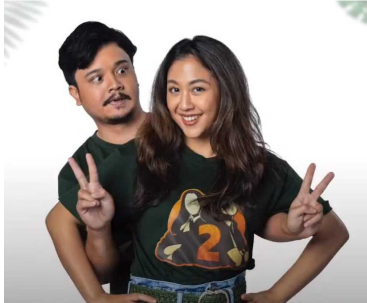
Sherina Munaf dan Derby Romero kembali beradu akting dalam Petualangan Sherina 2.