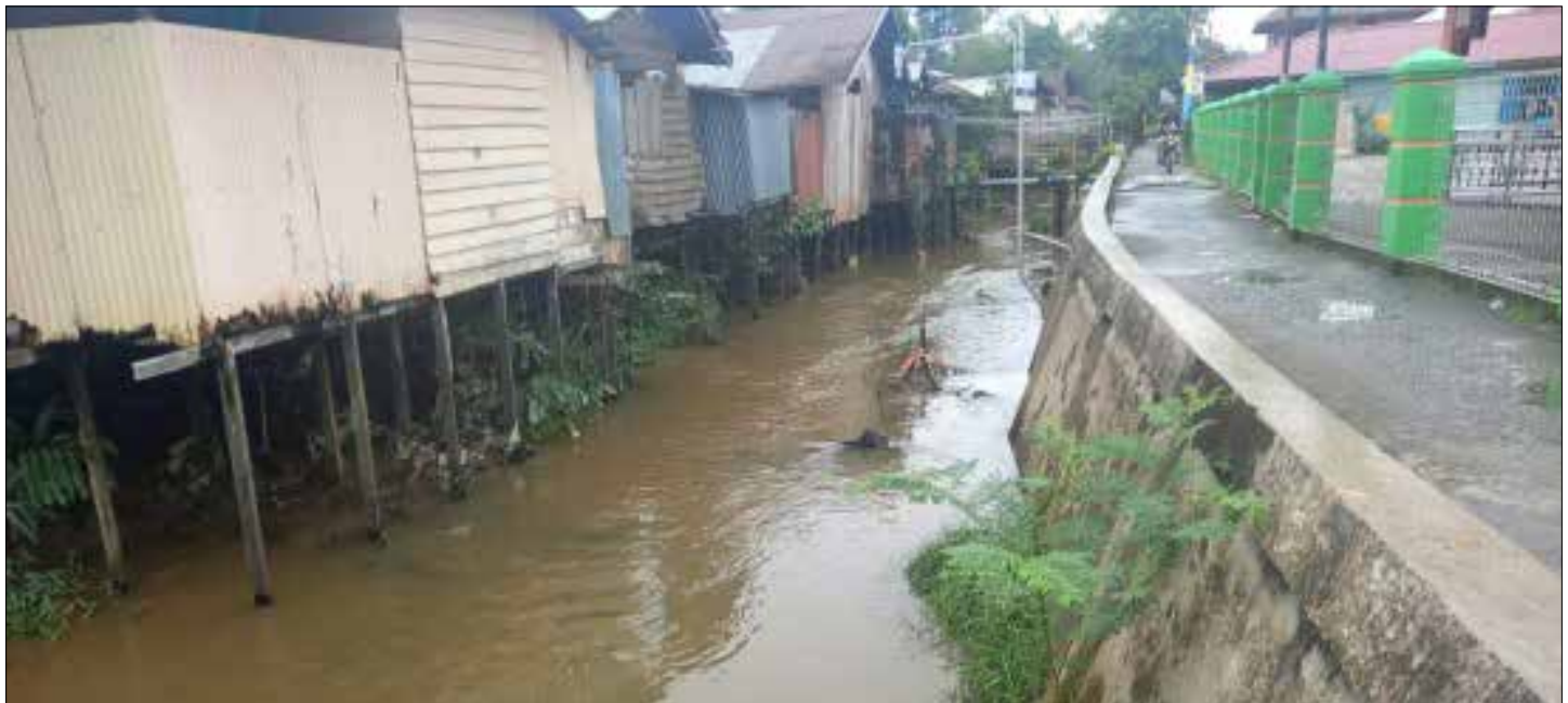
Bantaran Sungai Guntung.