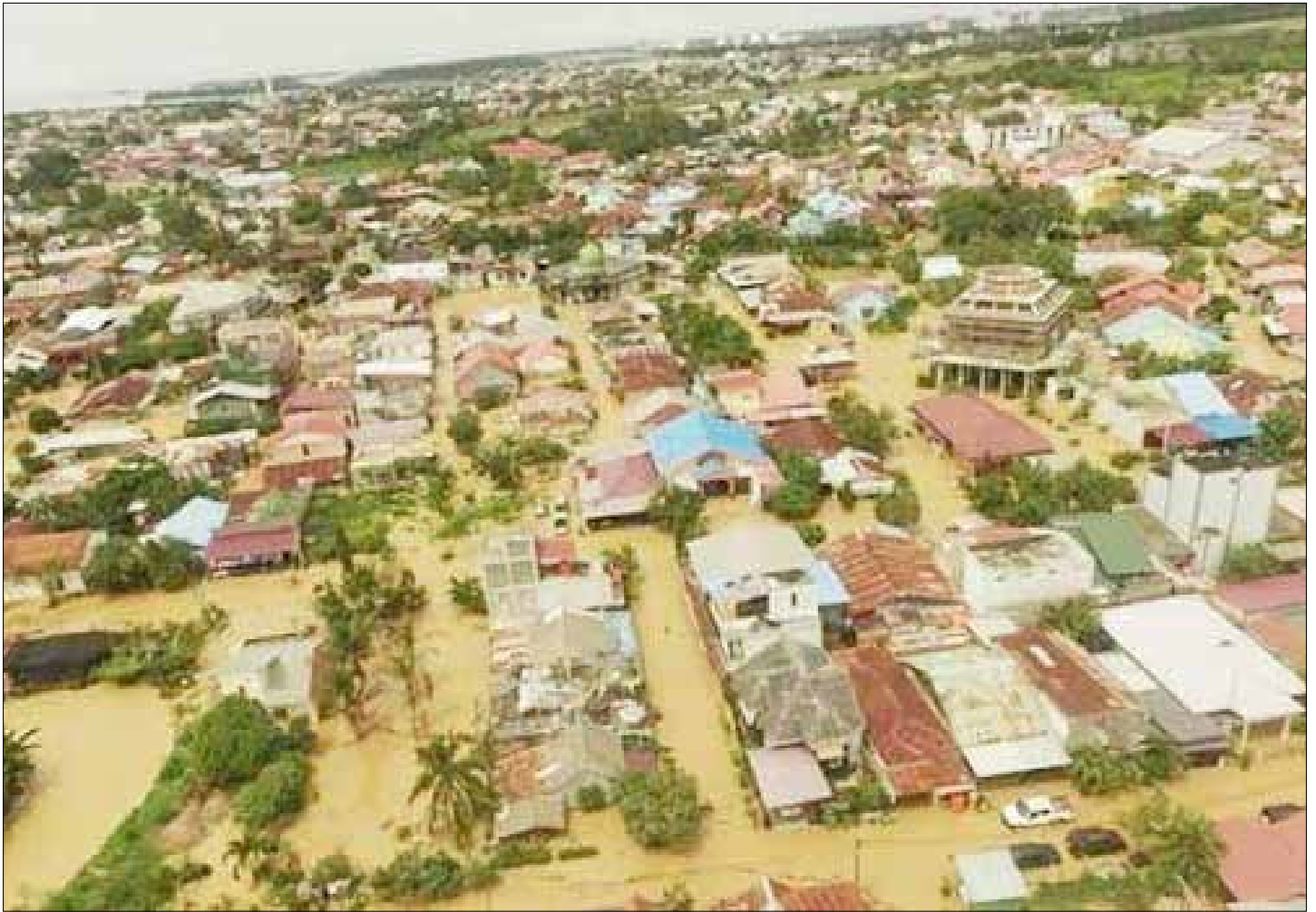
Banjir di Kota Bontang.