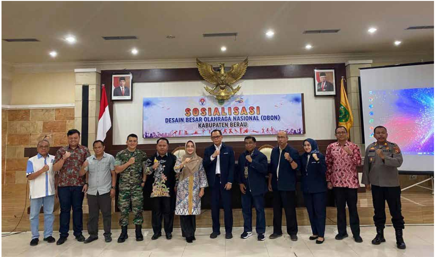
Sosialisasi DBON di Balai Mufakat Tanjung Redeb, Berau, Jumat (25/8/2023).