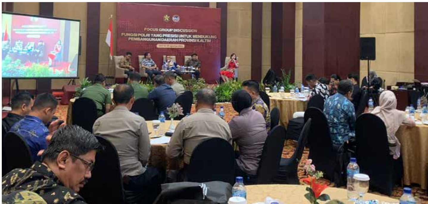
Kegiatan FGD Serdik Sespimen Polri Angkatan Ke-63.