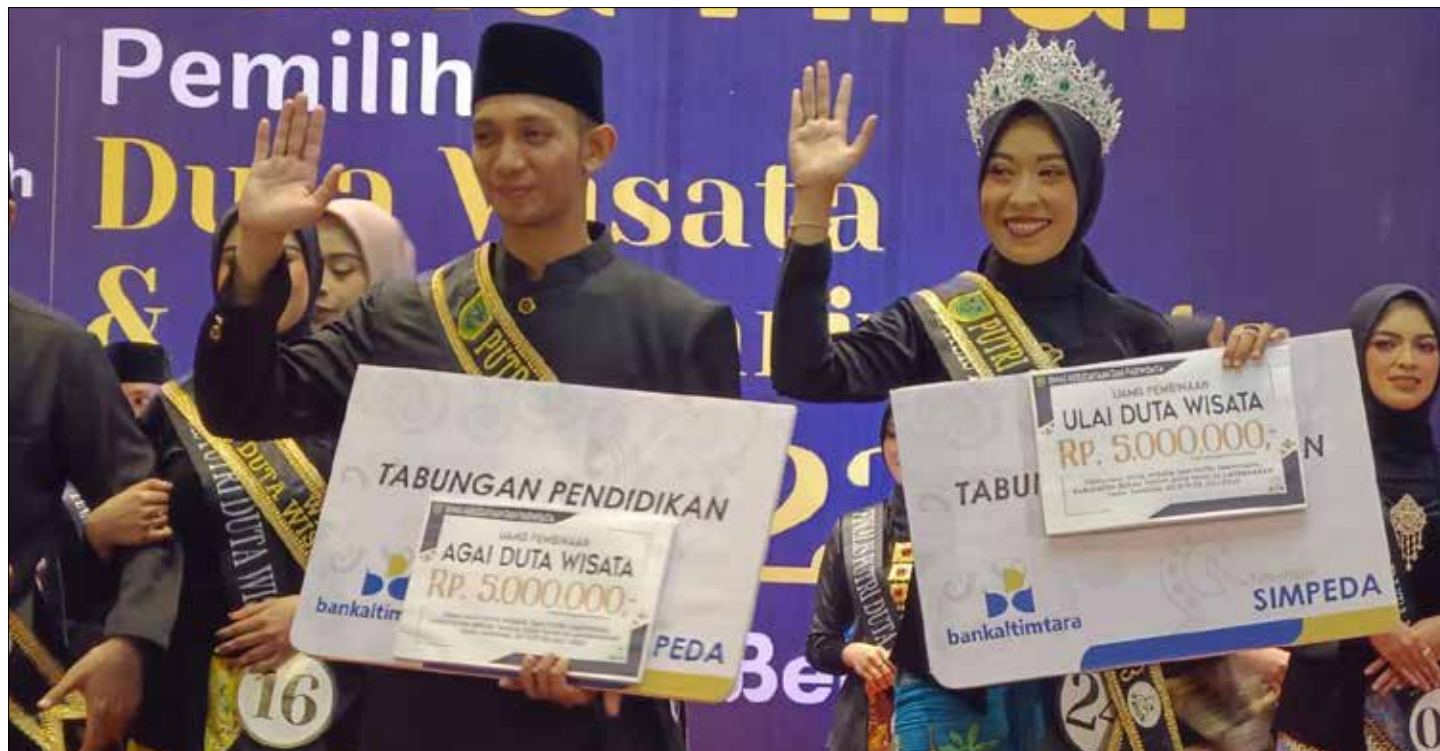
Pemilihan Duta Wisata dan Putri Pariwisata Kabupaten Berau tahun 2023 berlangsung meriah di Tokyo Ballroom Hotel Bumi Segah, Minggu (24/7/2023).