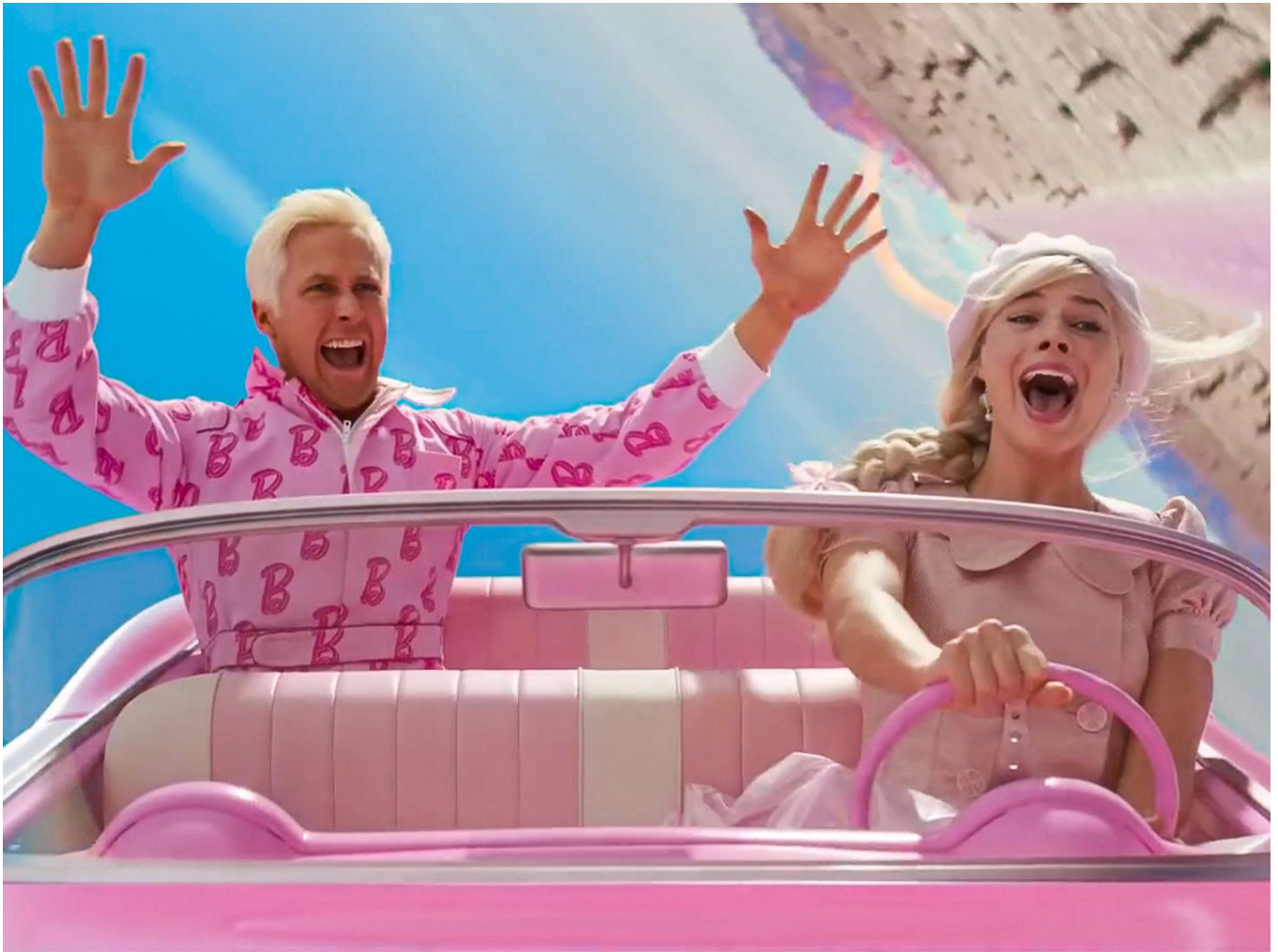
Margot Robbie dan Ryan Gosling tampil apik dalam film Barbie.