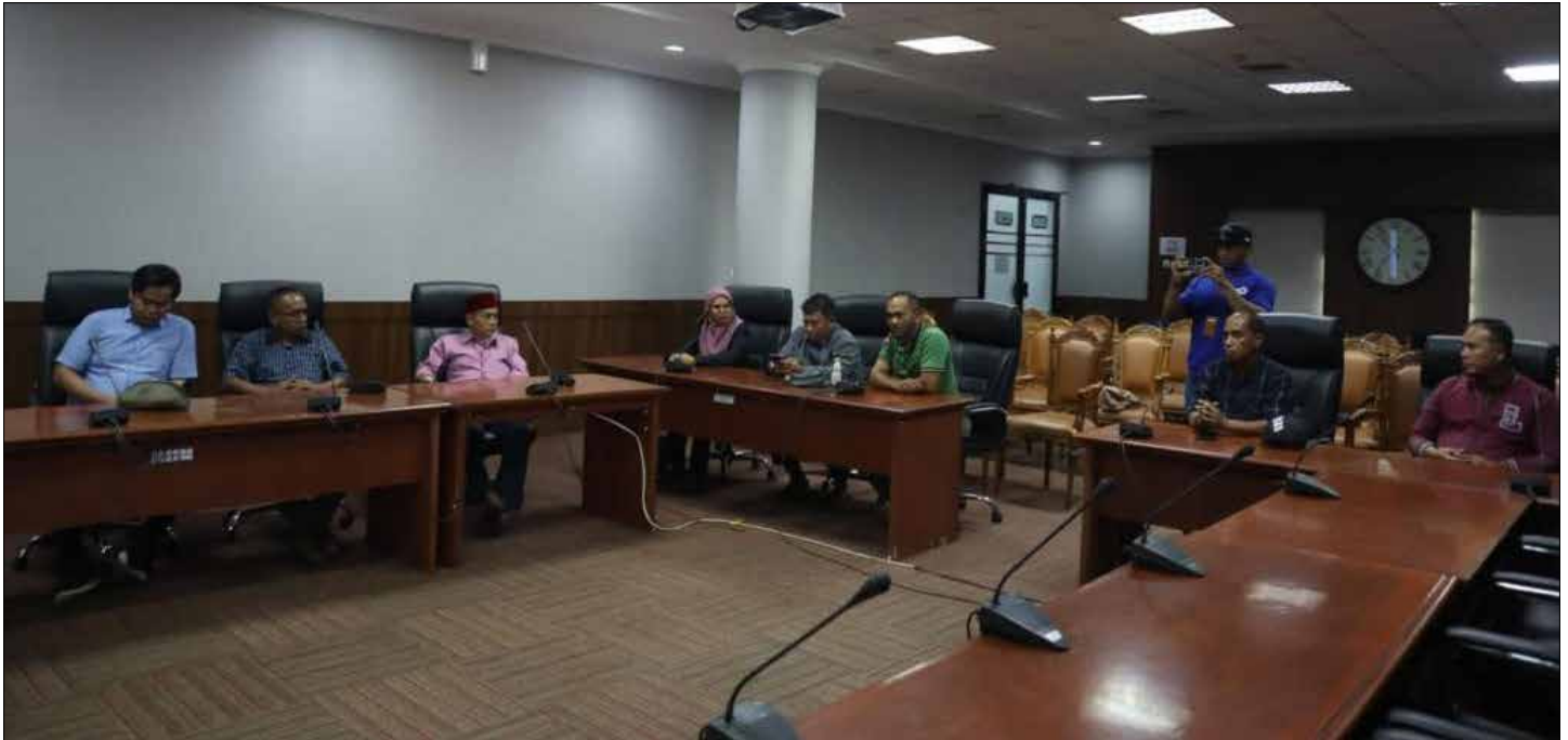
Suasana RDP antara Anggota Komisi II DPRD Berau dan DLHK Berau, mengenai penanganan TPA Bujangga di Kelurahan Rinding, Senin (24/7/2023).