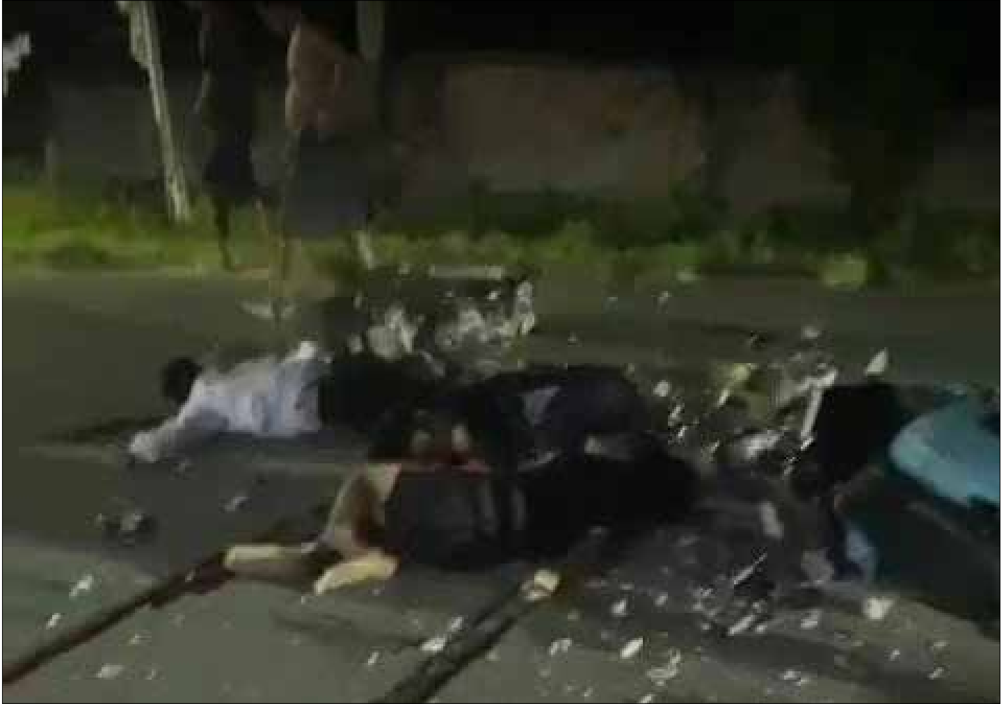
Kecelakaan lalulintas di Jalan Mulawarman, Lamaru. Seorang pengendara meninggal ditempat.