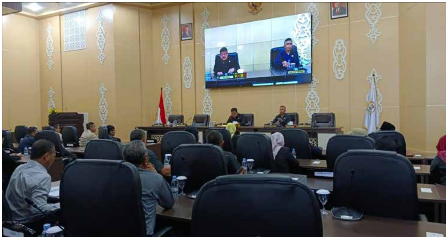
Suasana Rapat Paripurma ke-14 Masa Sidang II Tahun 2023 dengan agenda Pembentukan Panitia Pemilihan (Panlih) Wakil Wali Kota Balikpapan Sisa Masa Jabatan Tahun 2021-2024.