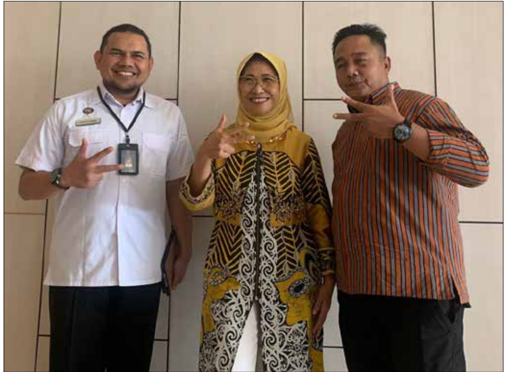
Wakil Ketua Komisi X DPR RI, Hetifah Sjaifudian, bersama para pelaku perfilman Kaltim.

"Industri film ini kan bisa menghasilkan, maka dari itu kami mendorong agar produksi film lokal bisa sampai ke nasional bahkan internasional. Kalau kita tidak memanfaatkan momentum ini sangat di-