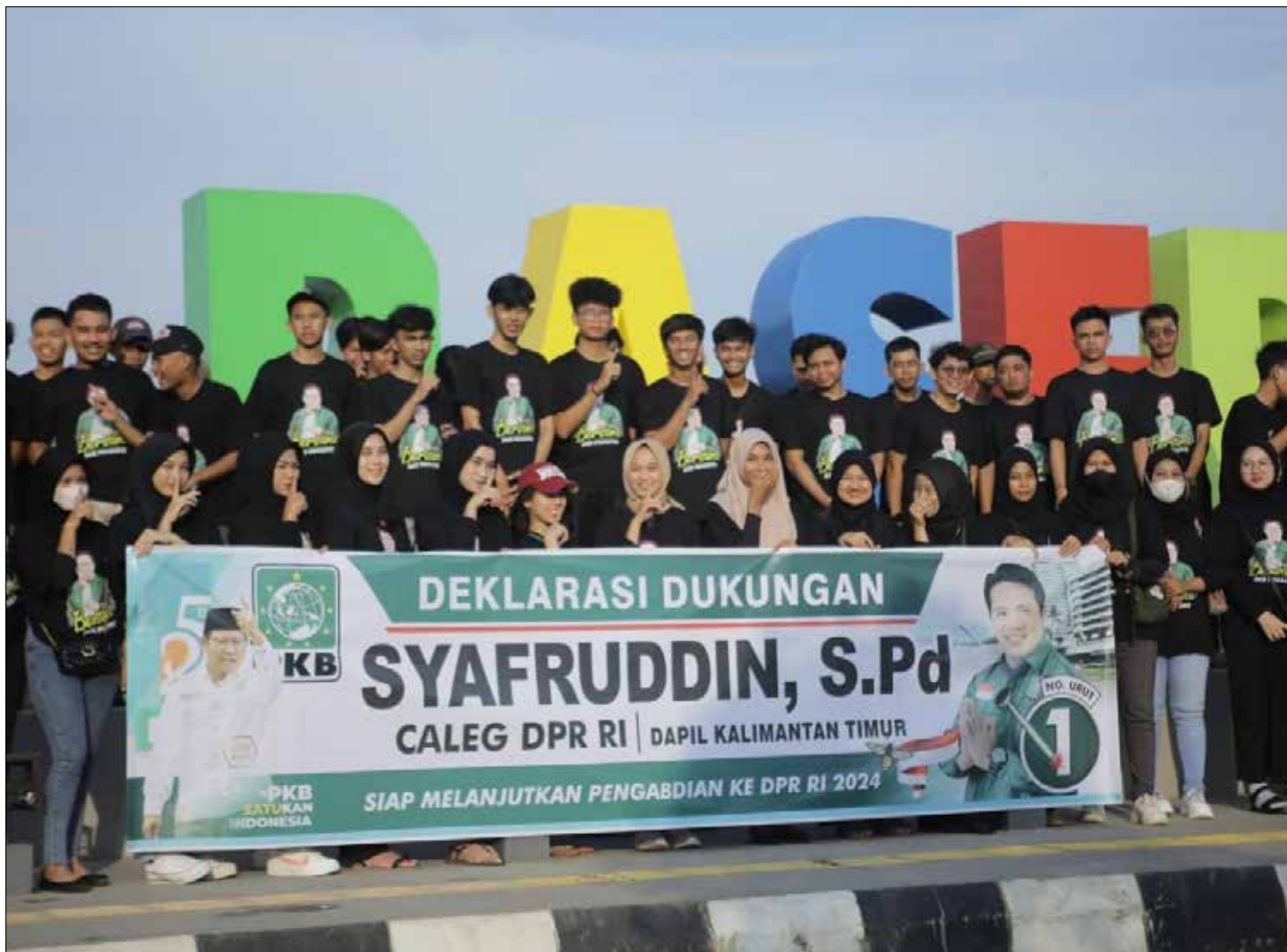
Dukungan Komunitas Zilenial dan Milenial Paser