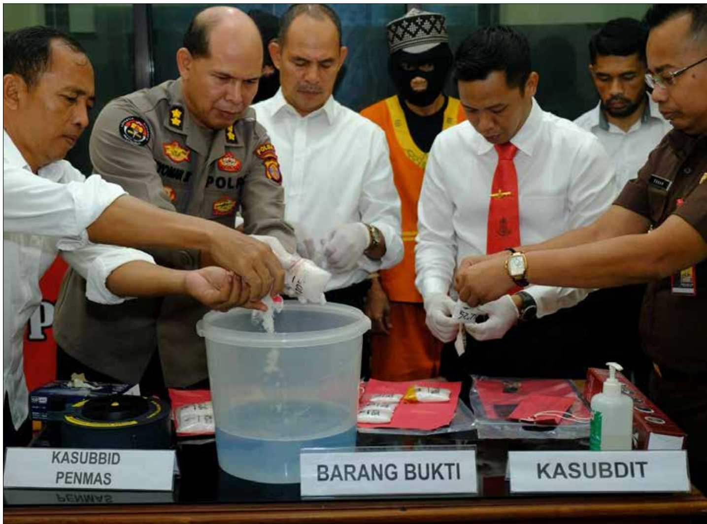
Proses pemusnahan barang bukti narkoba jenis sabu seberat 1.042 gram.