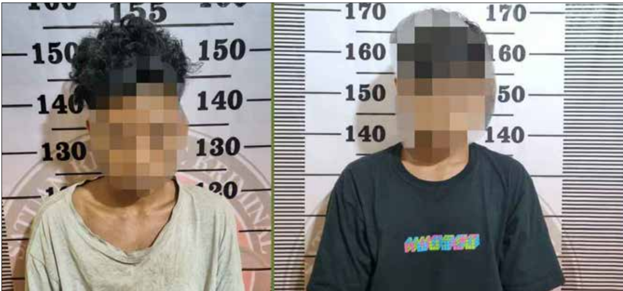
Dua pelaku pencurian kelapa sawit di Kecamatan Segah. Mobil Hilux warna putih yang digunakan kedua pelaku melancarkan aksinya mencuri kelapa sawit.

Pelaku SU dan DT saat ini ditahan pihak kepolisian untuk menjalani proses hukum lebih lanjut. Penyelidikan masih berlangsung guna mengungkap apakah masih ada pelaku lain yang terlibat dalam aksi pencurian ini. (dez)