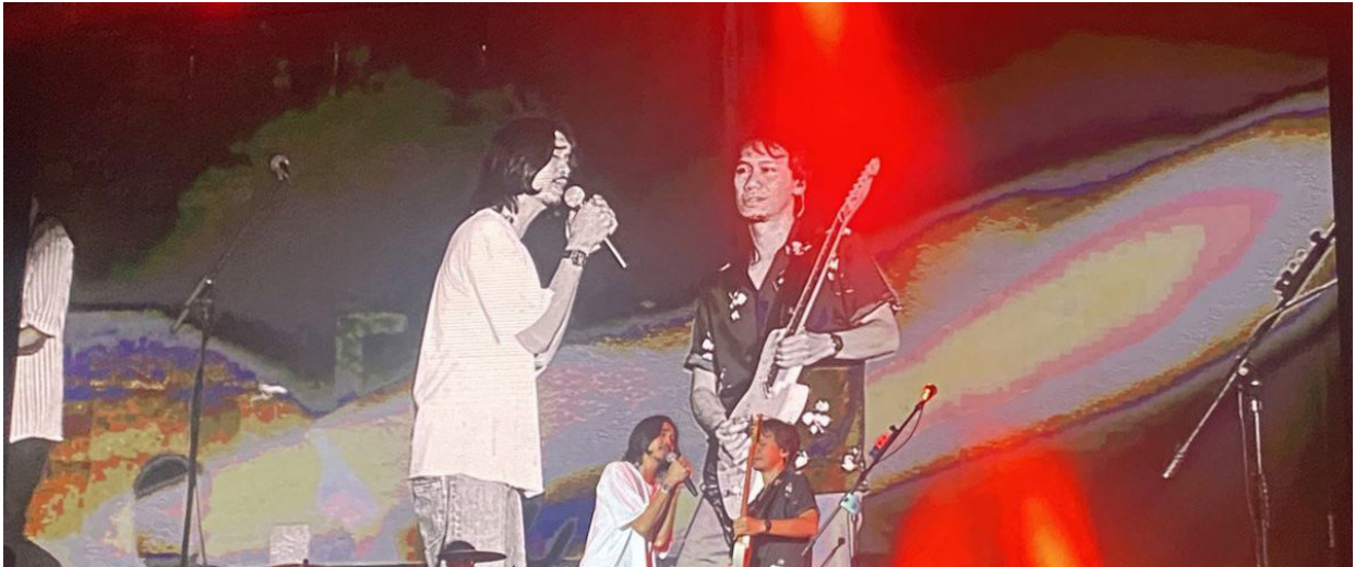
Penampilan Sheila on 7 di GBK Sports Complex, Senayan, Jakarta, dalam event We the Fest 2023