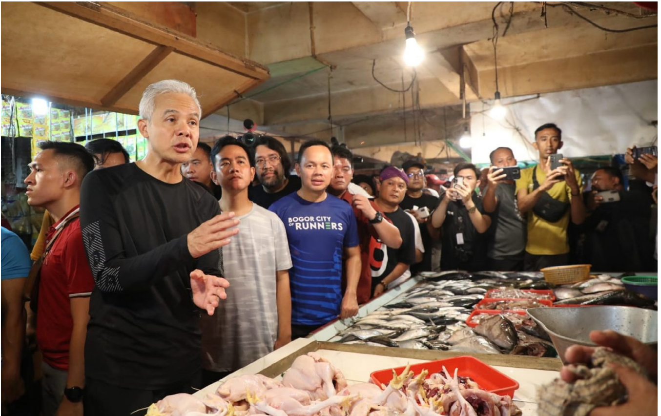
Ganjar Pranowo blusukan di Pasar Citeureup, Kabupaten Bogor. Dia didampingi Wali Kota Bogor Bima Arya dan Wali Kota Solo Gibran Rakabuming Raka.