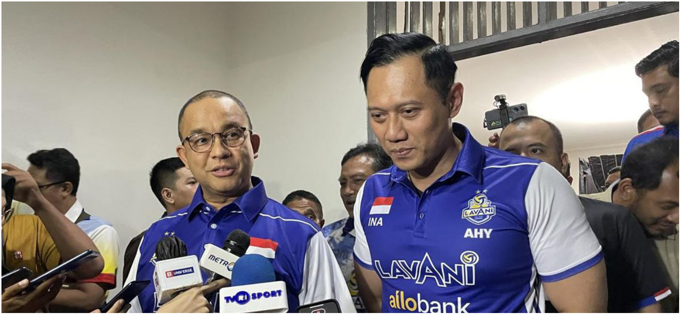
Agus Harimurti Yudhoyono dan Koalisi Perubahan untuk Persatuan memastikan akan mengawal Anies Baswedan maju dalam Pilpres 2024.