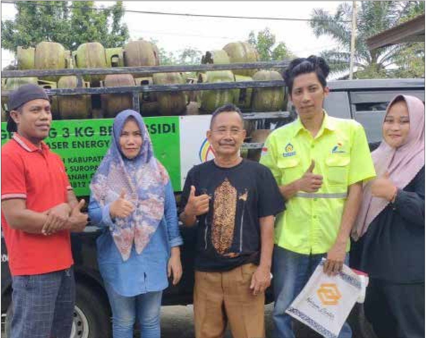
Pangkalan elpiji di Paser.