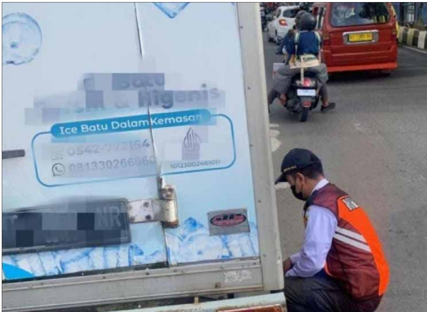
Dokumentasi Dishub Samarinda saat melakukan pengembosan ban kendaraan mobil box di Jalan Dr Sutomo.