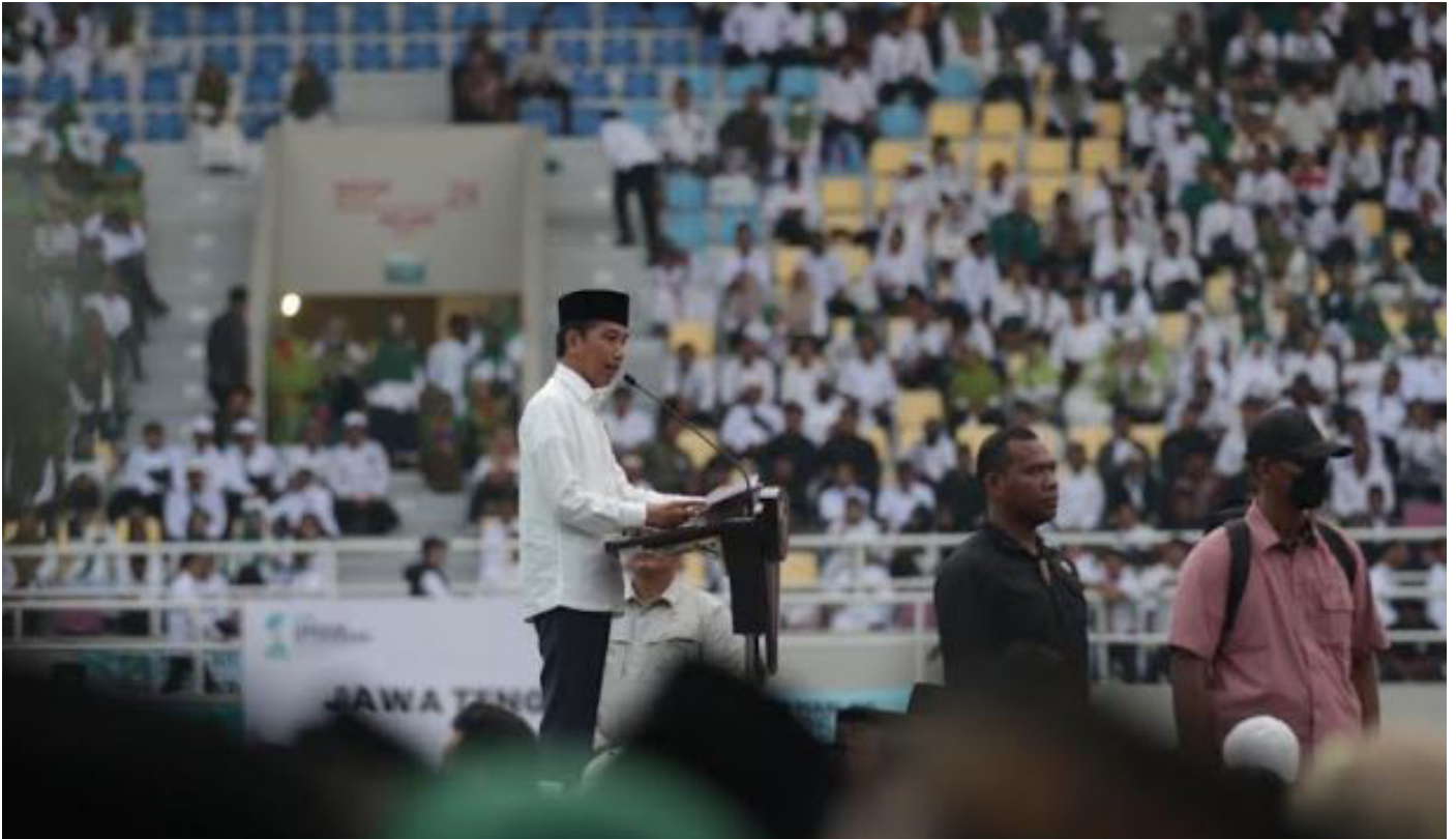
Presiden Joko Widodo saat menghadiri peringatan Harlah ke-25 PKB di Stadion Manahan, Solo.