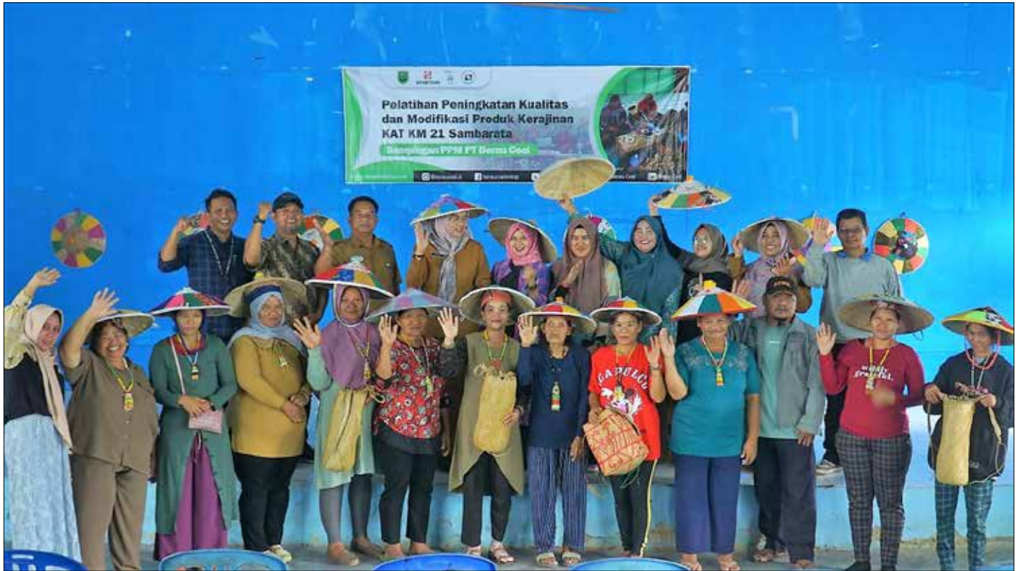
Foto bersama saat pelatihan peningkatan kualitas dan modifikasi produk kerajinan KAT Km 21 Sambarata oleh PT Berau Coal.