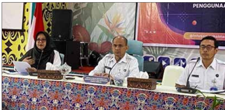
Suasana konferensi pers di Balai Rehabilitasi BNN Tanah Merah.

Sebab Kombes Pol Sutarso mengatakan, balai rehabilitasi tidak hanya memastikan klien sembuh saja. Melainkan juga memastikan balita dan sang ibu tetap diterima di masyarakat. "Balai rehabilitasi tidak hanya berbicara clinenya bisa sembuh, tapi bagaimana mereka tetap dapat diterima dan sejahtera secara ekonomi saat kembali ke tengah kehidupan bermasyarakat," pungkasnya. (vic)