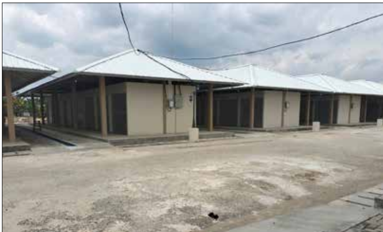
Bangunan baru di Pasar Induk Penyembolum Senaken.

Diharapkan, dengan adanya gedung baru di pusat perdagangan tradisional Kabupaten Paser ini, bisa lebih tertata dan rapih. Selain itu, Yusuf mengakui pihaknya masih membahas terkait penempatan para pedagang yang sudah direlokasi sebelumnya.