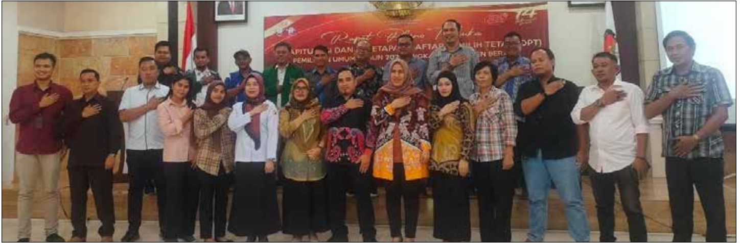
Foto bersama saat rapat pleno terbuka rekapitulasi dan penetapan DPT Pemilu 2024.