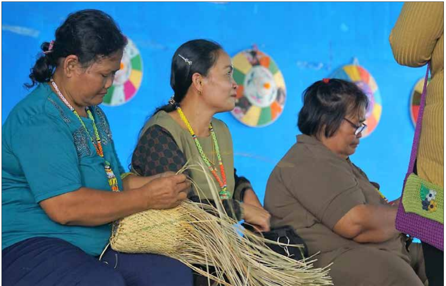
PT Berau Coal beri pendampingan kepada KAT Km 21 Sambarata.

"Dukungan yang diberikan adalah modal kerajinan tangan hingga pendampingan. Dari pelatihan yang diberikan juga dapat meningkatkan kualitas produk kami. Saya harap bantuan yang diberikan dapat berkelanjutan, sehingga memberi dampak baik terhadap ekonomi kami," tandasnya. (adv/dez)