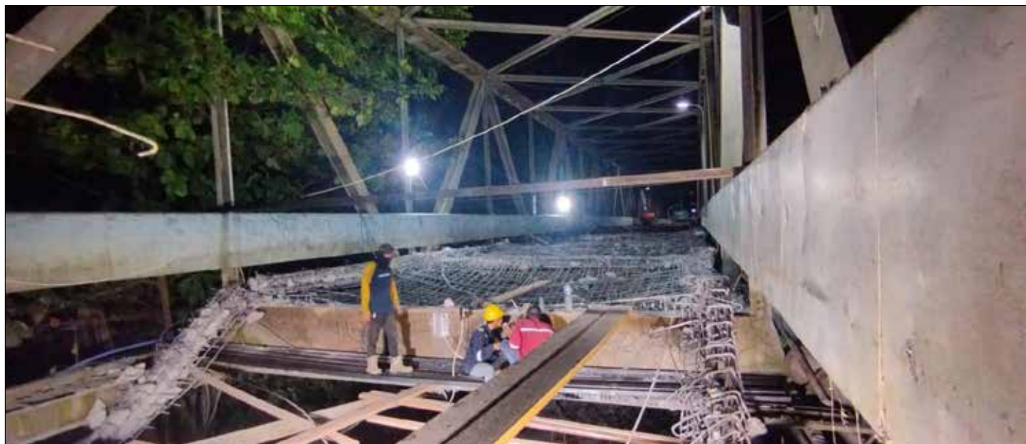
Proses pengerjaan pembobokan Jembatan Sambaliung beberapa waktu lalu.