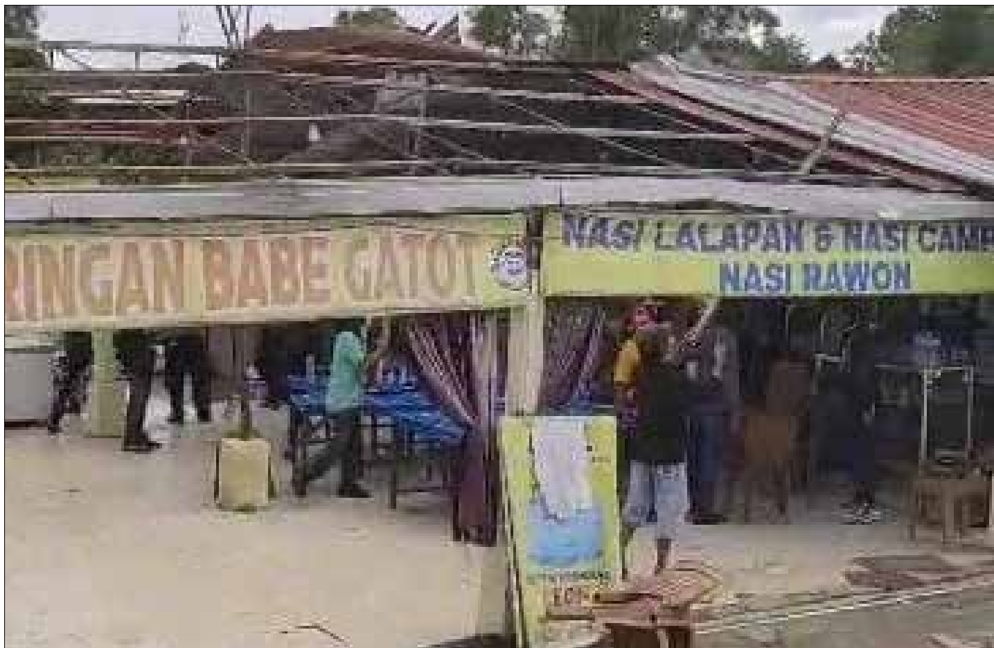
Pembongkaran lapak angkringan di kawasan Jalan MT Haryono tepatnya di depan Global Sport Balikpapan.