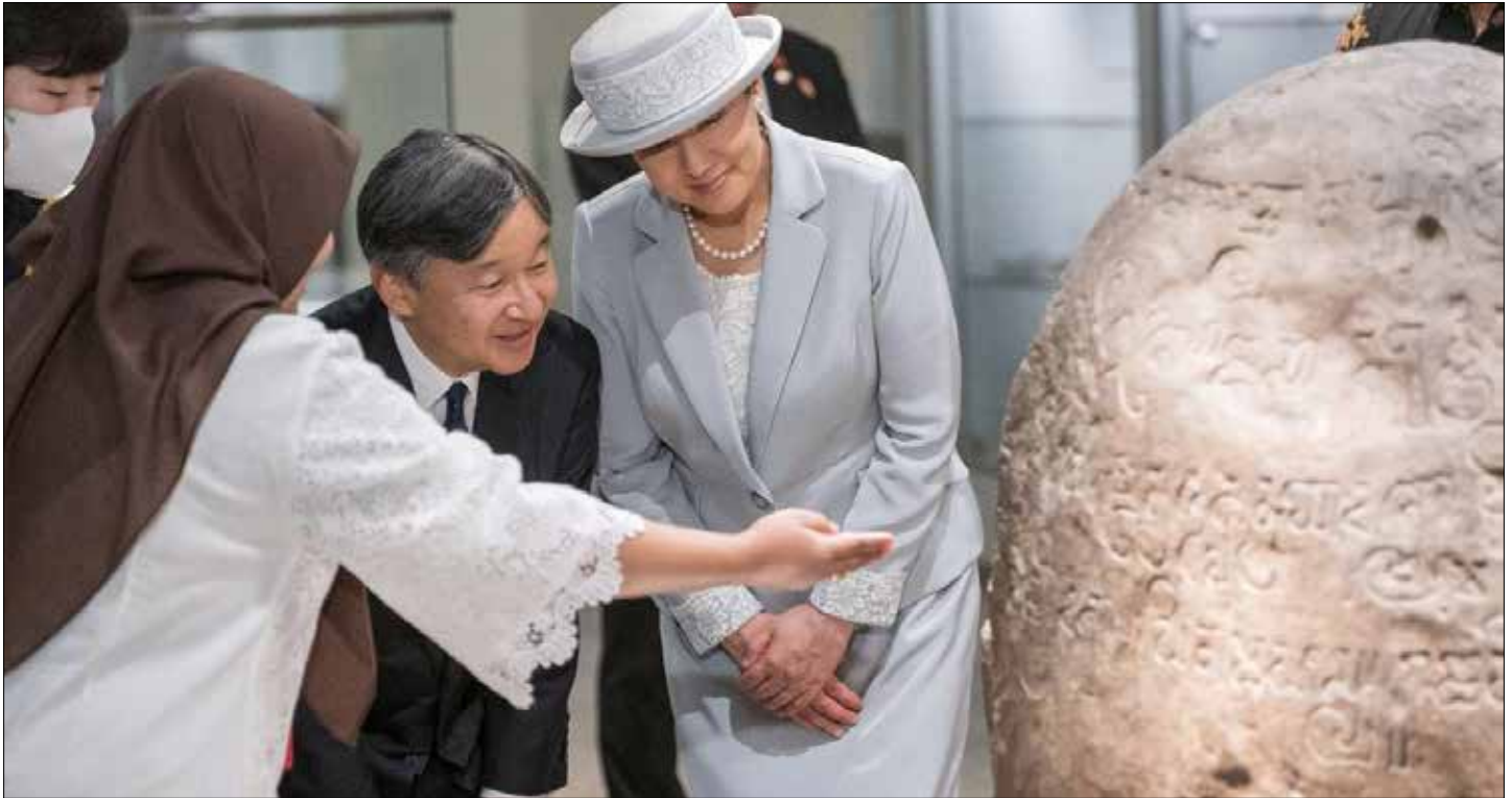
Kaisar Jepang Naruhito dan Permaisuri Masako saat melihat salah satu koleksi prasasti di Museum Nasional.