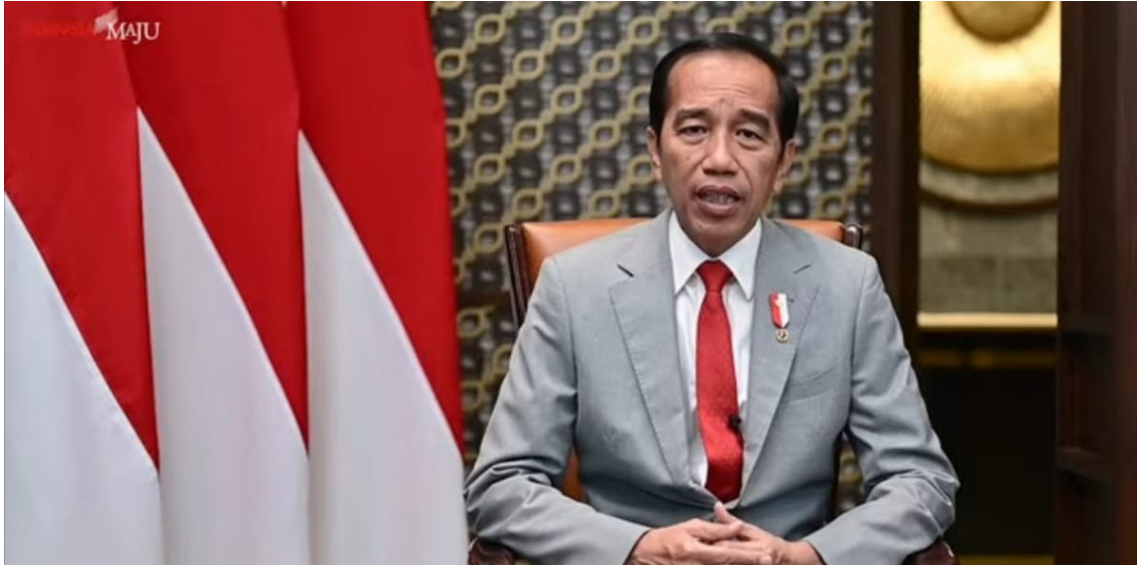
Presiden Joko Widodo mengumumkan bahwa pemerintah telah secara resmi mencabut status pandemi Covid-19 di Indonesia, Rabu, 21 Juni 2023.