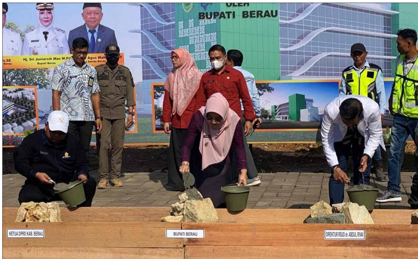
Peletakan batu pertama pengembangan bangunan fisik BLUD RSUD dr Abdul Rivai, Kamis (20/7).