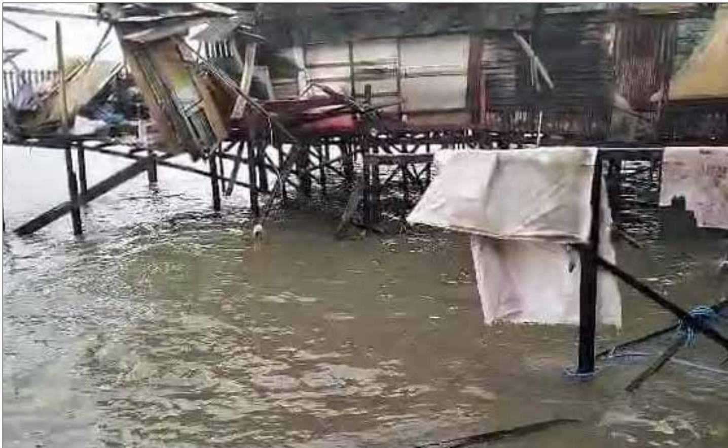
Sebuah rumah di RT 6 Kelurahan Klandasan Ulu, Balikpapan Kota ambruk usai di hantam gelombang, Jumat (21/7).