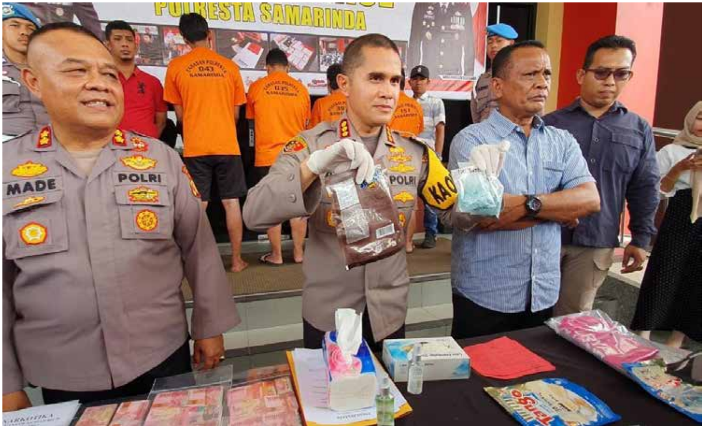
Kombes Pol Ary Fadli saat merilis kasus ungkapan peredaran narkoba di Halaman Polresta Samarinda, Kamis (20/7/2023).