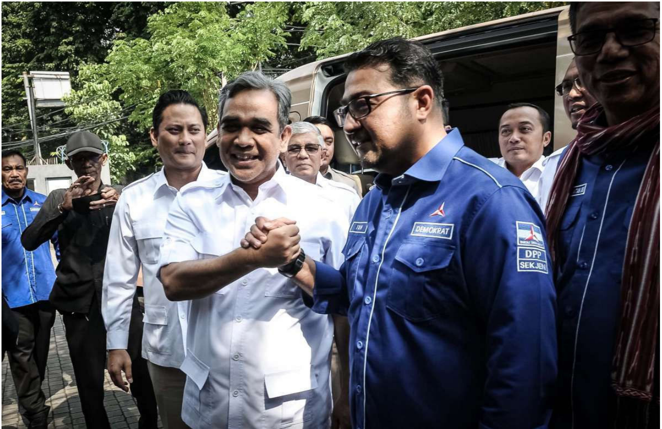
Sekjen Gerindra Ahmad Muzani dan Sekjen Partai Demokrat Teuku Riefky Harsya solid dengan koalisi masing-masing.