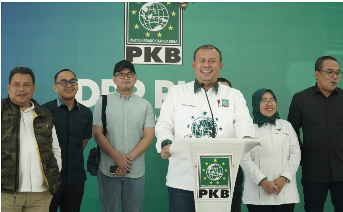
Ketua Fraksi PKB DPR RI Cucun Ahmad Syamsurijal dalam konferensi pers di kantor DPP PKB, Jalan Raden Saleh, Jakarta Pusat, Kamis, 20 Juli 2023.