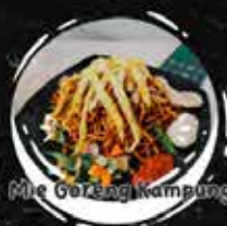
Mie Goreng Kampung