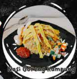
Nasi Goreng Kampung