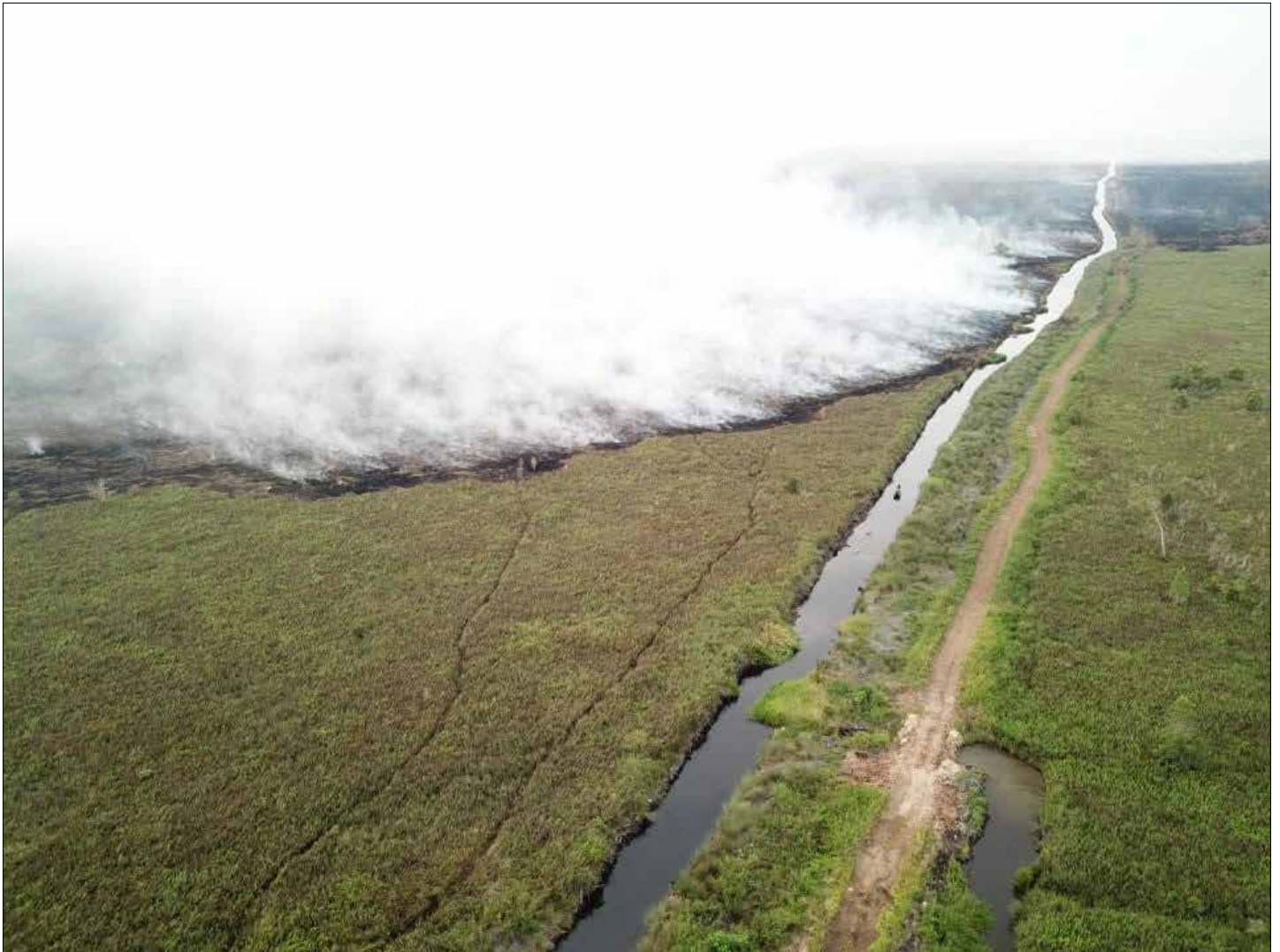
Lokasi kebakaran hutan dan lahan (karhutla) di Desa Sabintulung.