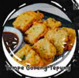
Tempe Goreng Tepung