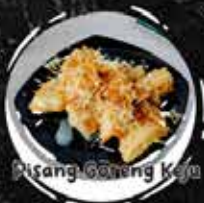
Pisang Goreng Keju