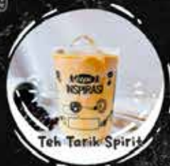
Teh Tarik Spirit