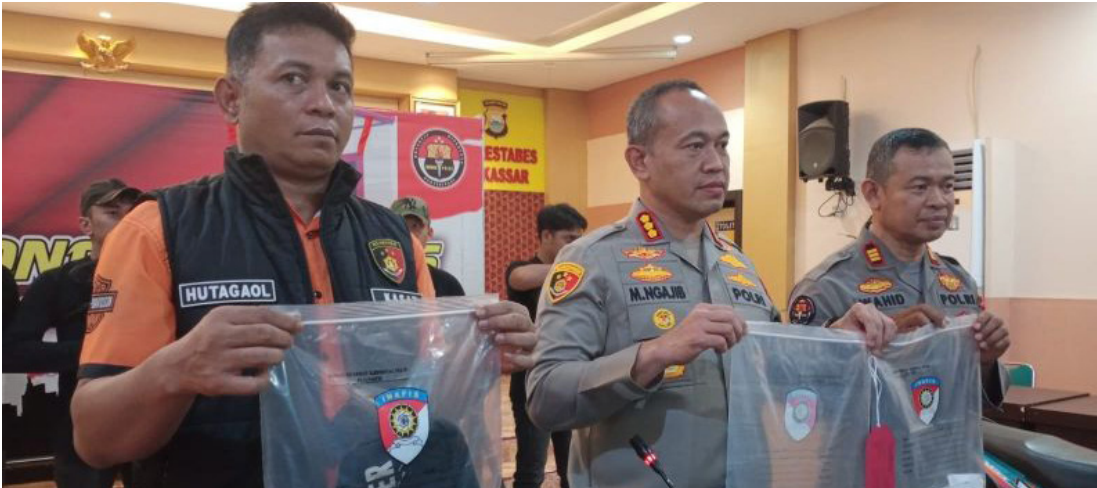
Kapolrestabes Makassar Kombes Pol Mokhammad Ngajib (tengah) didampingi jajarannya saat merilis kasus tindak pidana kejahatan di Mapolrestabes Makassar, Sulawesi Selatan, Minggu (17/9/2023).