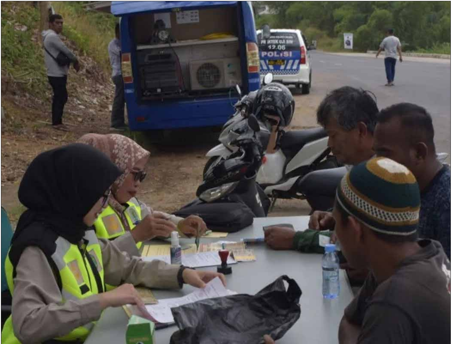
Pengendara saat diperiksa petugas untuk membayar pajak.