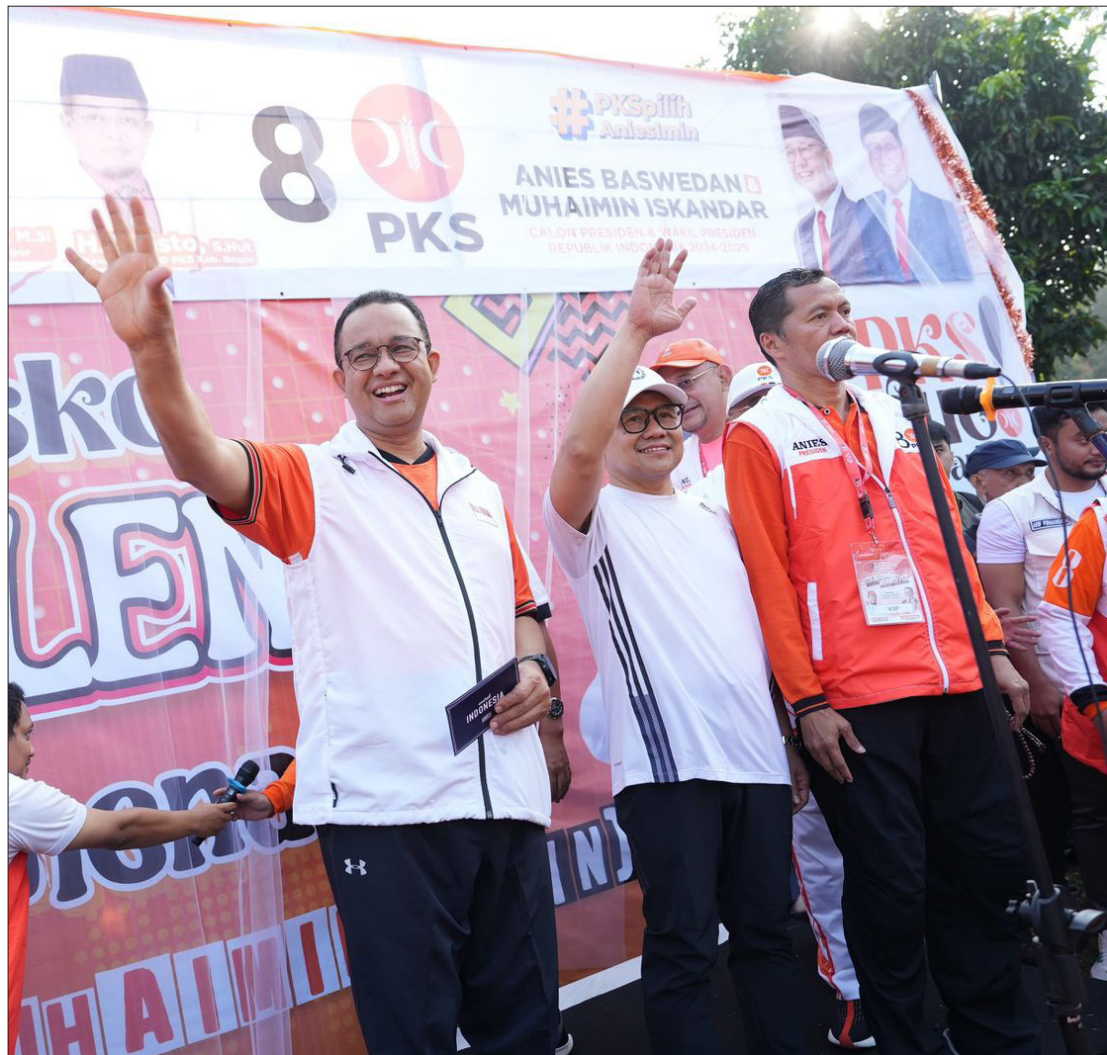
Anies Baswedan dan Muhaimin Iskandar meresmikan Posko Milenial di Bogor, Jawa Barat.