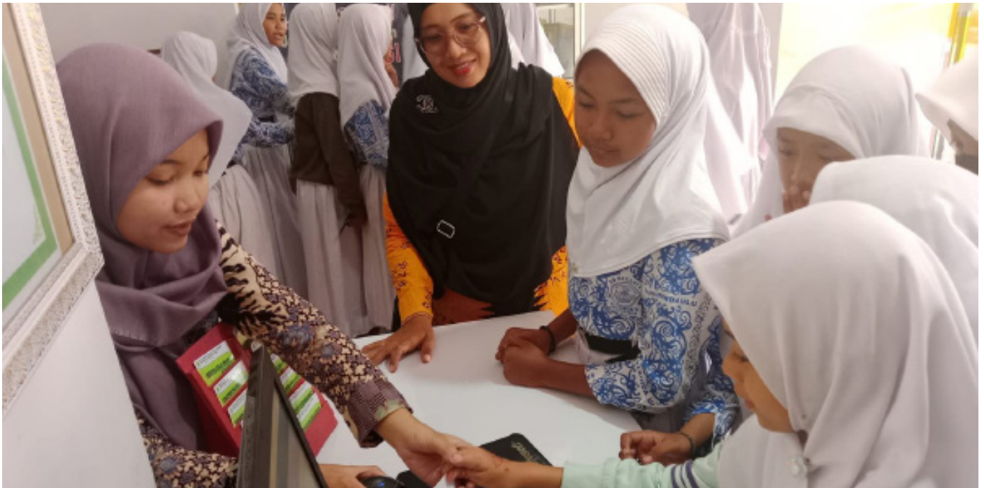
Murid-Murid SDN010 Samarinda Ulu saat masuk ke Perpustakaan yang dipandu petugas perpustakaan.