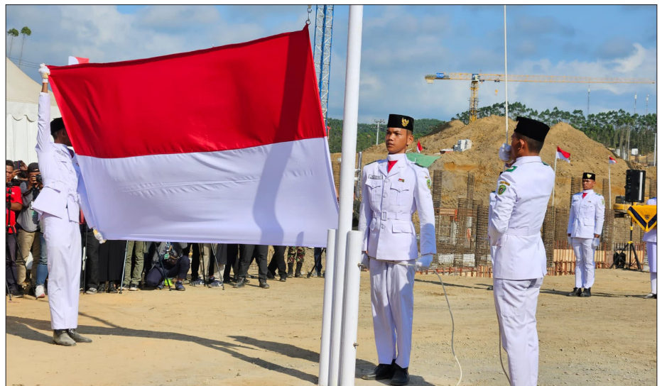
Anggota Purna-Paskibraka PPU bertugas di IKN.