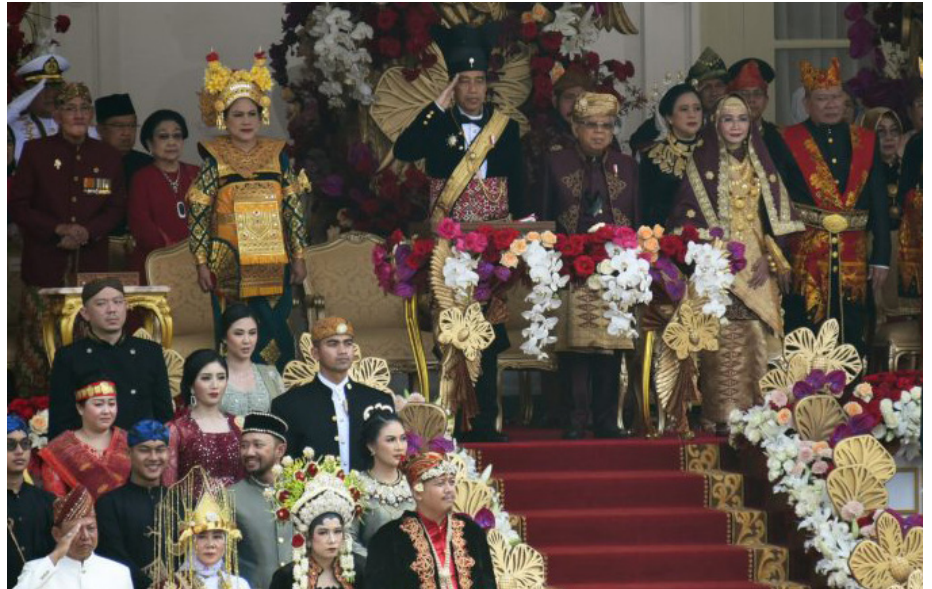
Presiden Joko Widodo mengenakan pakaian dari Kasunanan Surakarta saat menjadi inspektur upacara.

Optimisme pindahan ke IKN ditunjukkan pula dari sisi anggaran. Pemerintah mengalokasikan Rp 40,6 triliun untuk pembangunan IKN pada 2024. Menteri Keuangan Sri Mulyani Indrawati menuturkan, nominal itu termasuk anggaran yang dialokasikan melalui Kementerian PUPR sebesar Rp 35,7 triliun. Sesuai rencana, dana sebe-