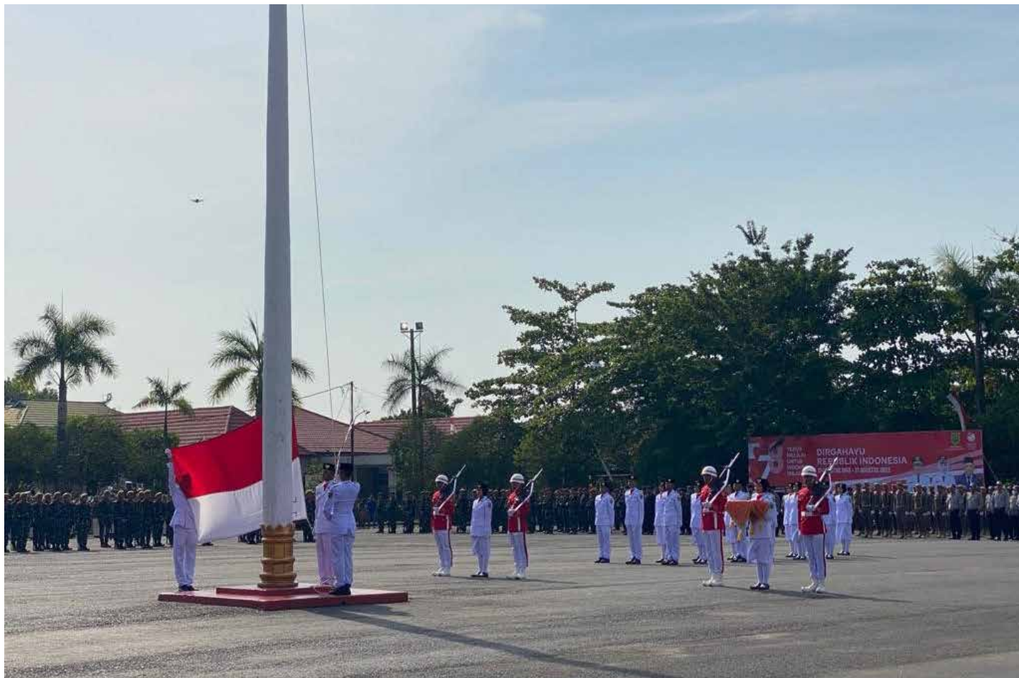
Pengibaran bendera merah putih di Lapangan Pemuda, Kamis (17/8/2024).