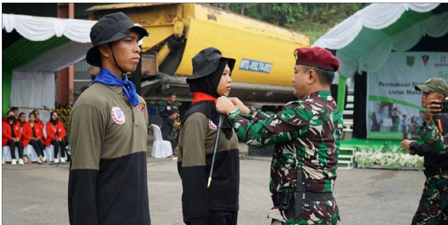
Suasana program Bintalsik yang dipimpin oleh jajaran Skadron/13 Serbu.

"Semoga bisa belajar dengan baik dan kedepannya bisa membanggakan keluarga saya," pungkasnya. (adv/dez)