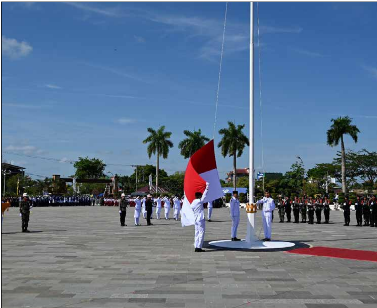
Pengibaran bendera Merah Putih.