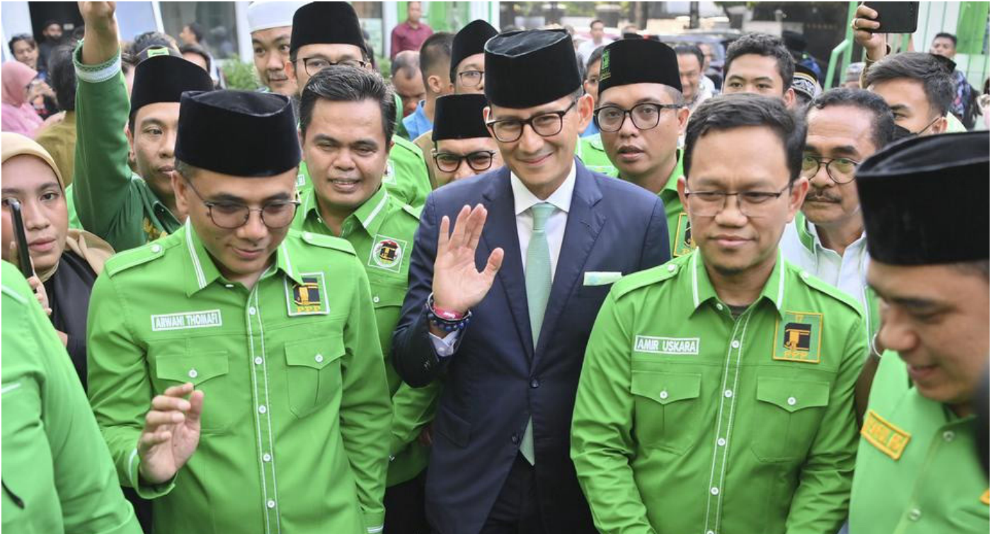
Posisi dan tugas Sandiaga Salahuddin Uno di PPP akan ditentukan di rapimnas.