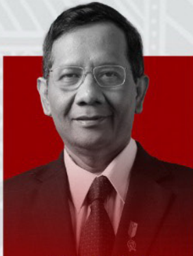
Prof. Dr. Mohammad Mahfud MD, S.H., S.U., M.I.P. Menteri Koordinator Bidang Politik, Hukum, dan Keamanan Republik Indonesia ** Subject to confirmation