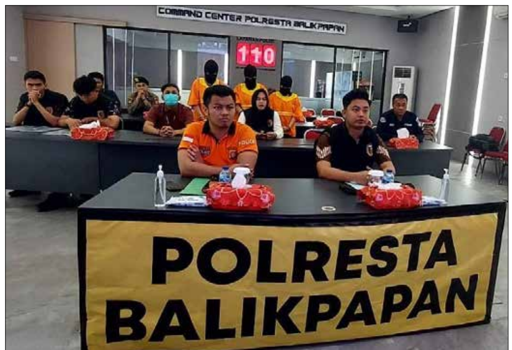
Preskon Polresta Balikpapan perihal kasus TPPO di Kota Balikpapan.

Masih di lokasi yang sama, pengungkap kasus TPPO yang kedua pada 8 Juni 2023. Kepolisian kembali membongkar 1 kasus tindak pidana perdagangan orang dengan tersangka seorang wanita berinisial MS (32) yang dibekuk ke-