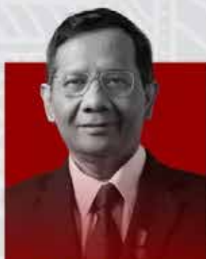
Prof. Dr. Mohammad Mahfud MD, S.H., S.U., M.J.P. Menteri Koordinator Bidang Politik, Hukum, dan Keamanan Republik Indonesia Subject to confirmation