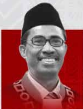
Dr. Daniel Yusmic Pancastaki Fookh, S.H., M.Hum Nasib Mahkamah Konstitusi