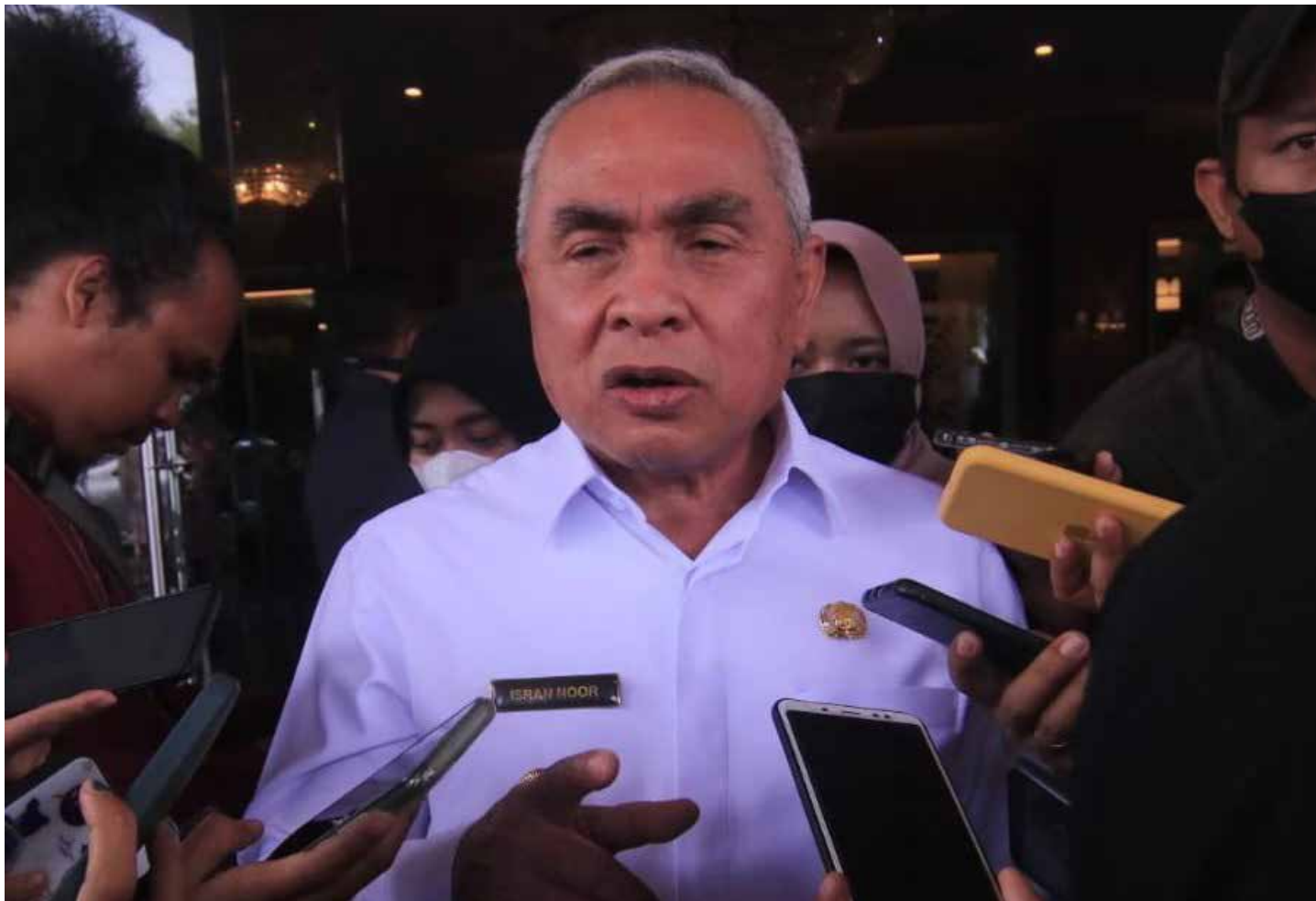
Gubernur Kaltim Isran Noor