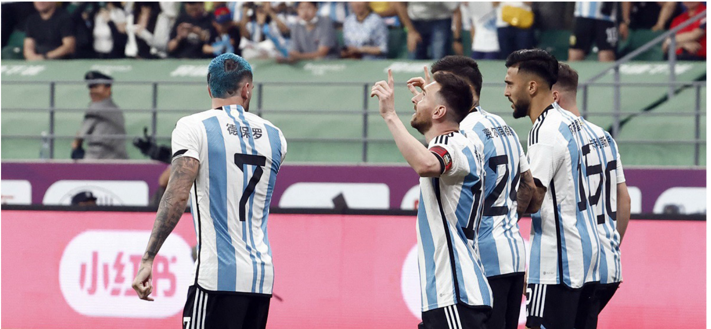
Aksi Lionel Messi saat menghadapi Australia. Argentina diprediksi menurunkan pemain pelapis saat bersua Indonesia, Senin, 19 Juni 2023.