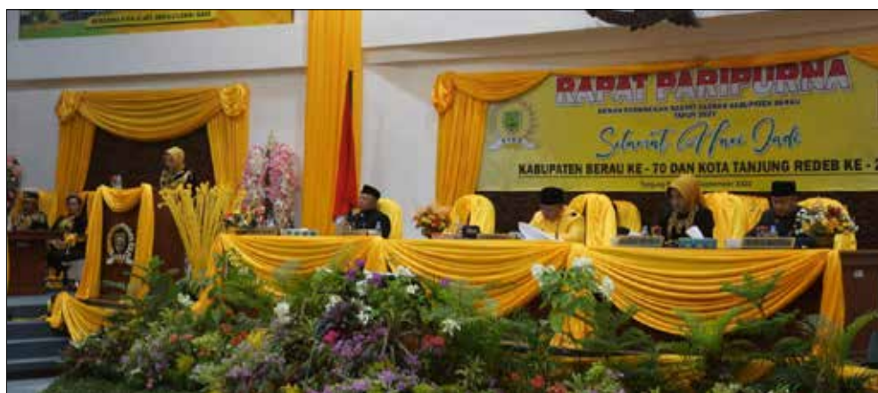
Rapat Paripurna DPRD Berau dalam rangka hari jadi ke-70 tahun Kabupaten Berau dan ke-213 tahun Kota Tanjung Redeb.