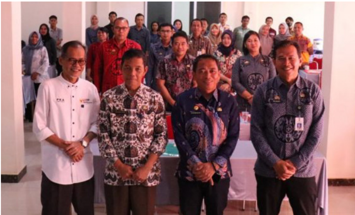
Pembekalan Teknis Peraturan Perundang-Undangan