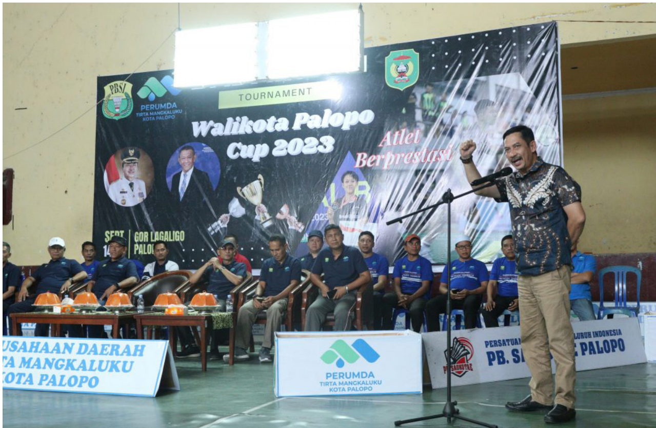
Pembukaan Badminton Tournament Walikota Palopo Cup 2023 (15/9/23)