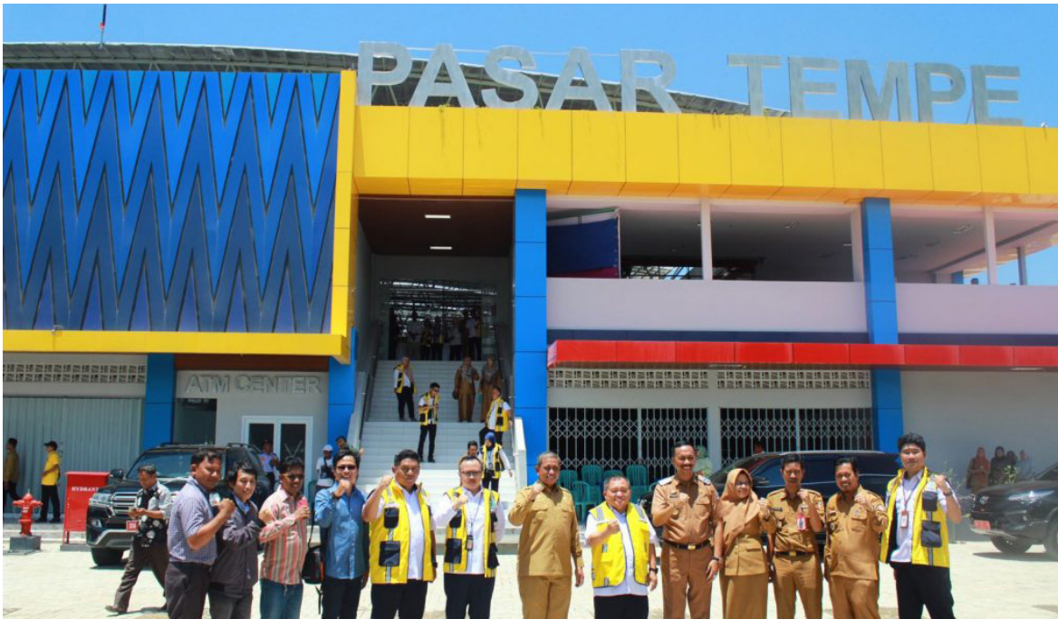
Jajaran Pemkab Wajo beserta BPPW Sulsel di depan Pasar Tempe, Wajo