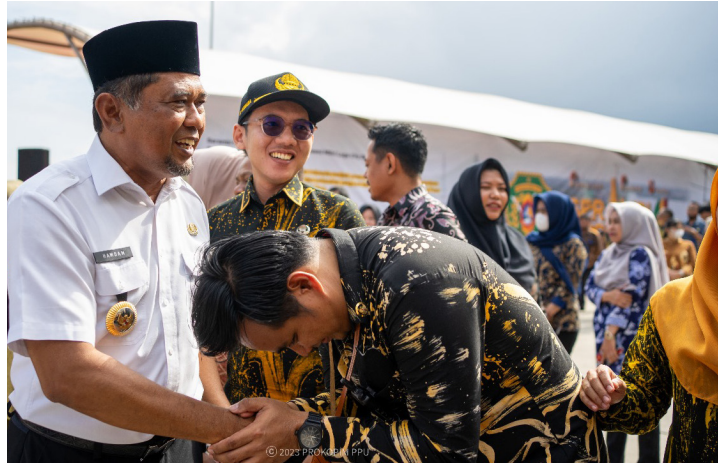
Humas Setkab PPU for MediaKaltimGroup

Usai apel besar, Bupati PPU bersalaman dengan seluruh pegawai Pemkab PPU.