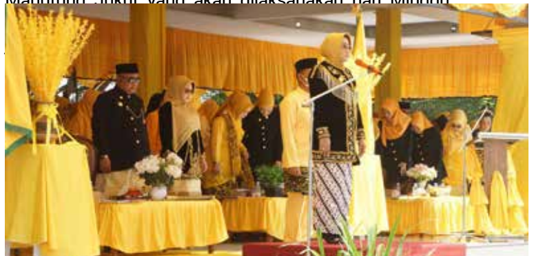
Peringatan hari jadi Kabupaten Berau yang ke-70 tahun dan Kota Tanjung Redeb yang ke-213 tahun.

"Serangkaian acara sudah kita laksanakan, seperti Menkuat Banua sudah dilakukan kemarin (14/9/2023) dan hari ini Upacara peringatan Hari Jadi Kabupaten Berau, tinggal Manutung Jukut yang akan dilaksanakan hari Minggu