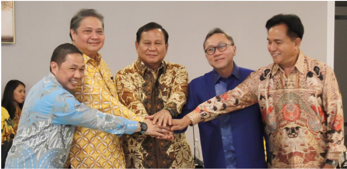
Pertemuan para ketua parpol dari Koalisi Indonesia Maju.