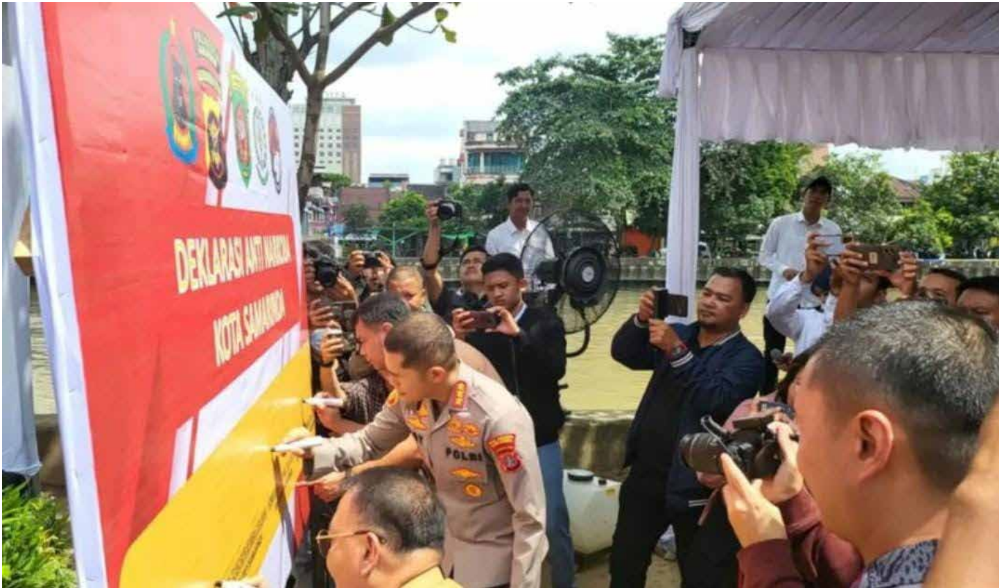
Peresmian Sungai Dama sebagai Kampung Bebas Narkoba.