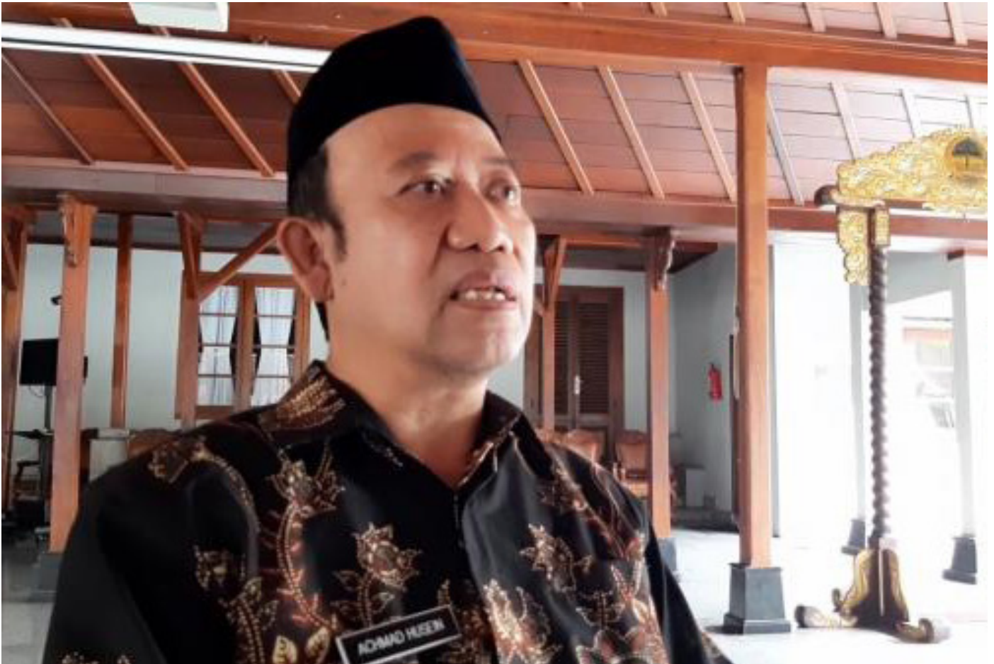
Bupati Banyumas Achmad Husein.