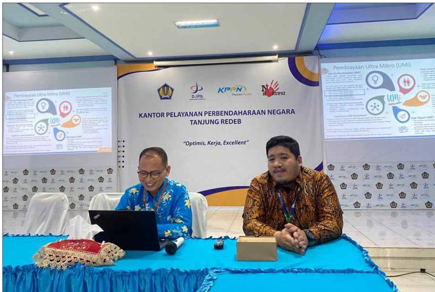
Audiensi dan rilis data UMi di Kabupaten Berau oleh KPPN Tanjung Redeb.