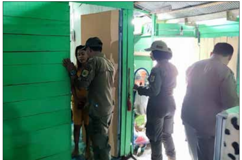
Petugas saat memeriksa salah seorang PSK yang terjaring.

Pewartu : Bhakti Sihombing, Editor : Nicha Ratnasari