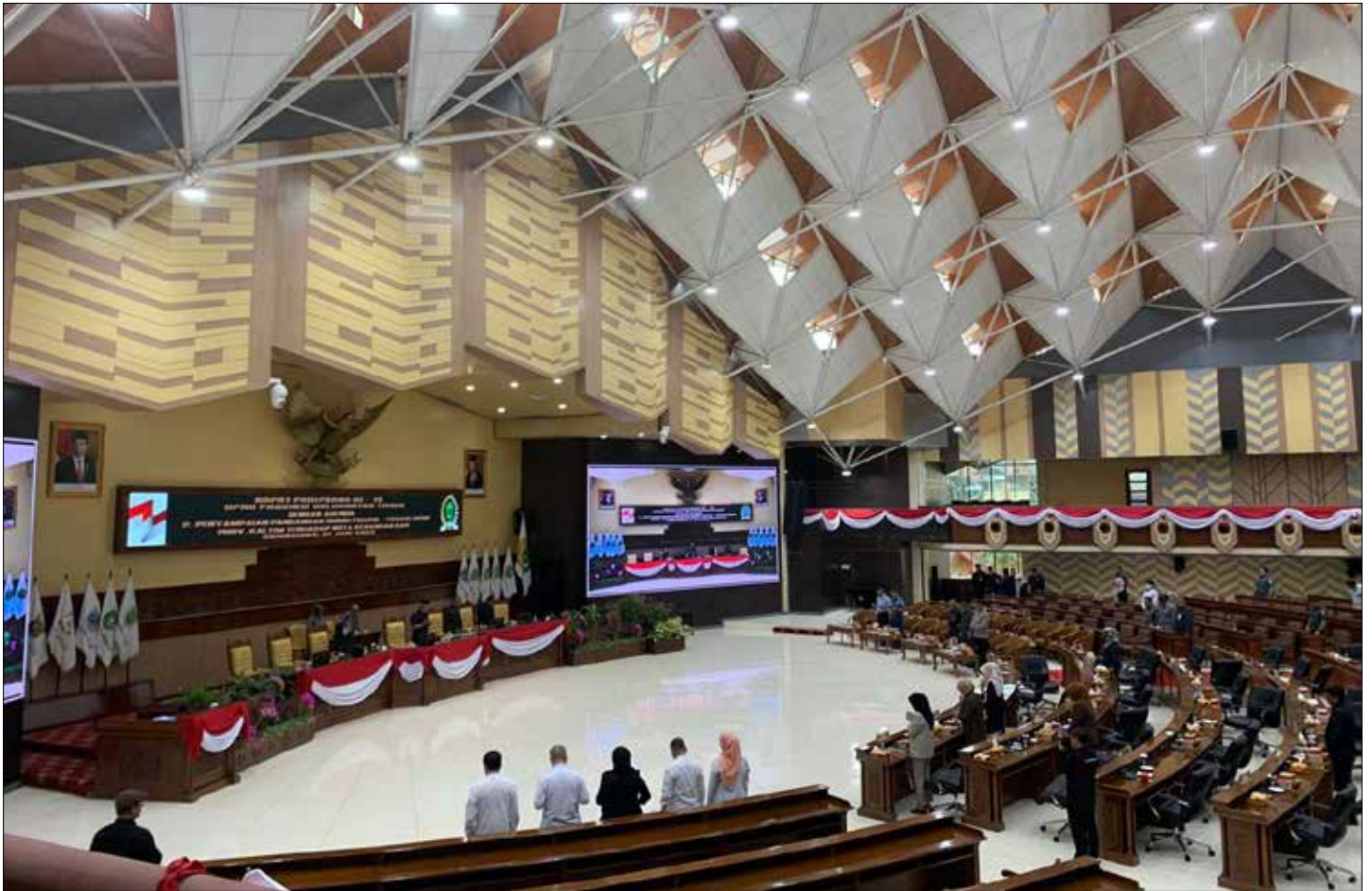
Pelaksanaan Rapat Paripurna ke-24 DPRD, Jumat (11/8/2023).