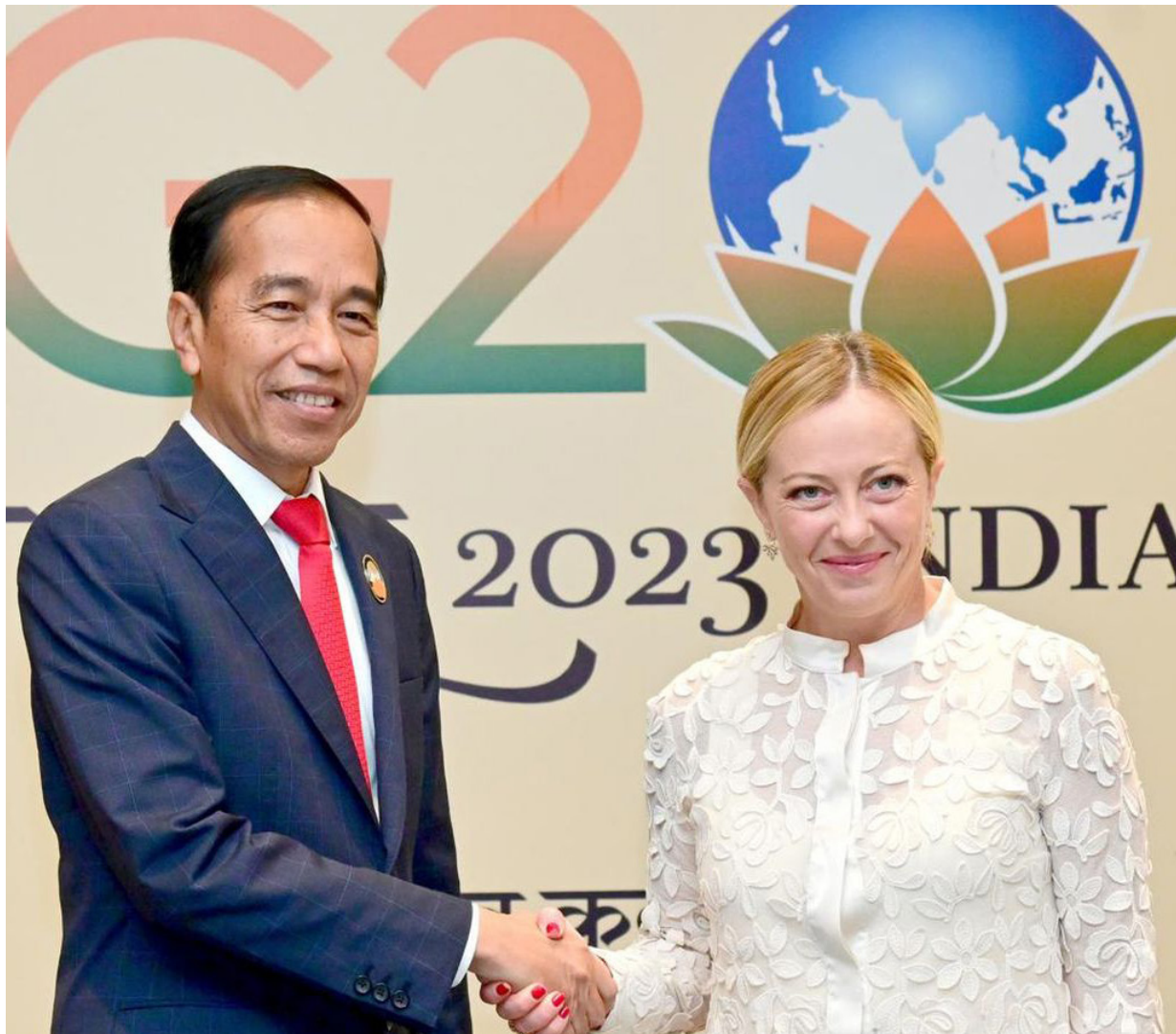
Presiden Joko Widodo Bersama Perdana Menteri Italia Giorgia Meloni.