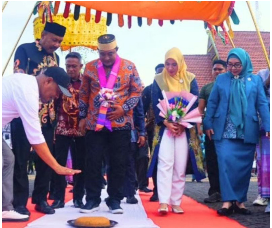
Pj. Gubernur Sulsel Bahtiar Baharuddin bersama istri disambut dengan acara adat ketika pulang kampung ke Bone.

Selanjutnya, Wakil Bupati mengungkapkan permohonan maaf dari Bupati yang sedang menjalankan tugas dinas luar, dan ia