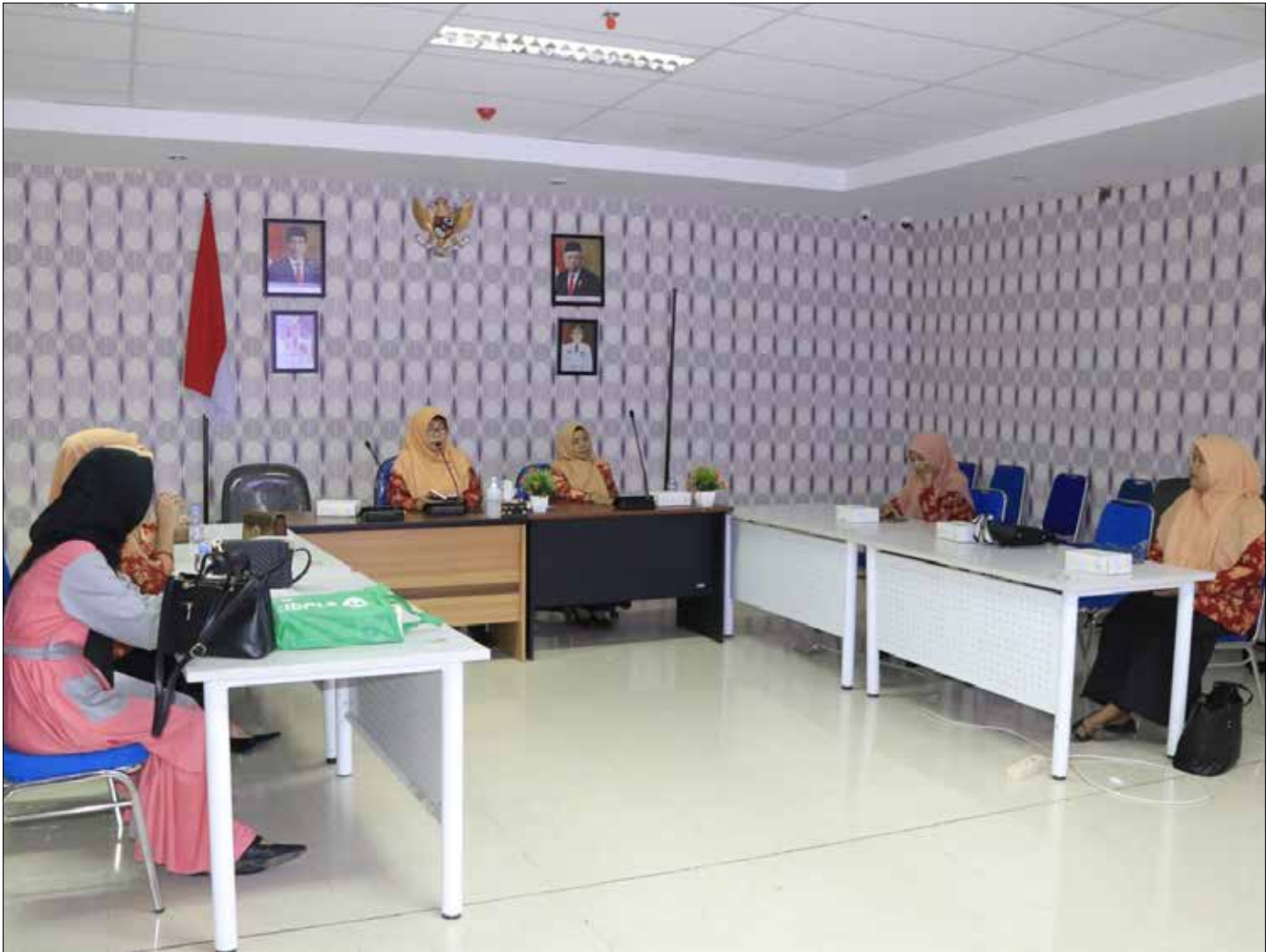
PERTEUMUAN: DWP DKISP Provinsi Kaltara menggelar pemahaman Konsep Dasar Gender, Jumat (8/8).