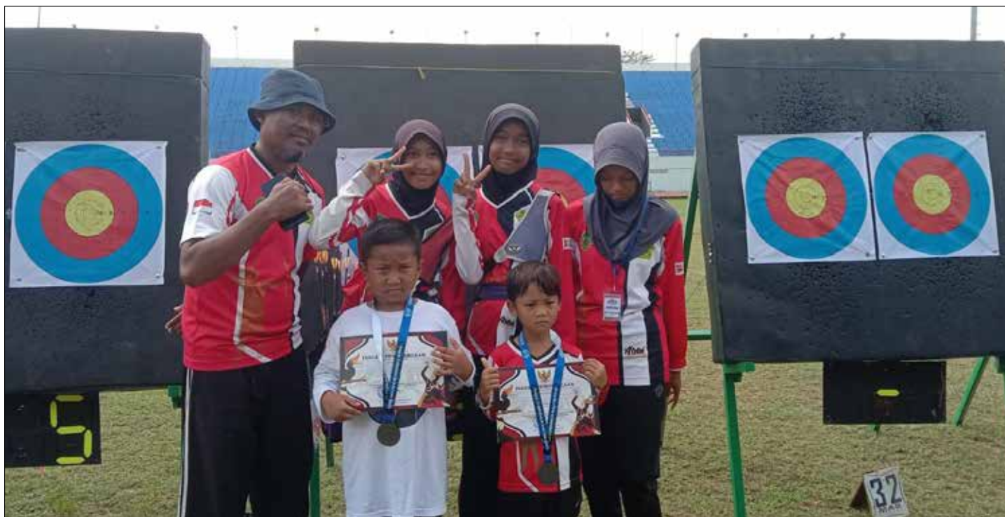
Atlet muda PPU saat penyerahan medali di ajang Piala Gubernur.