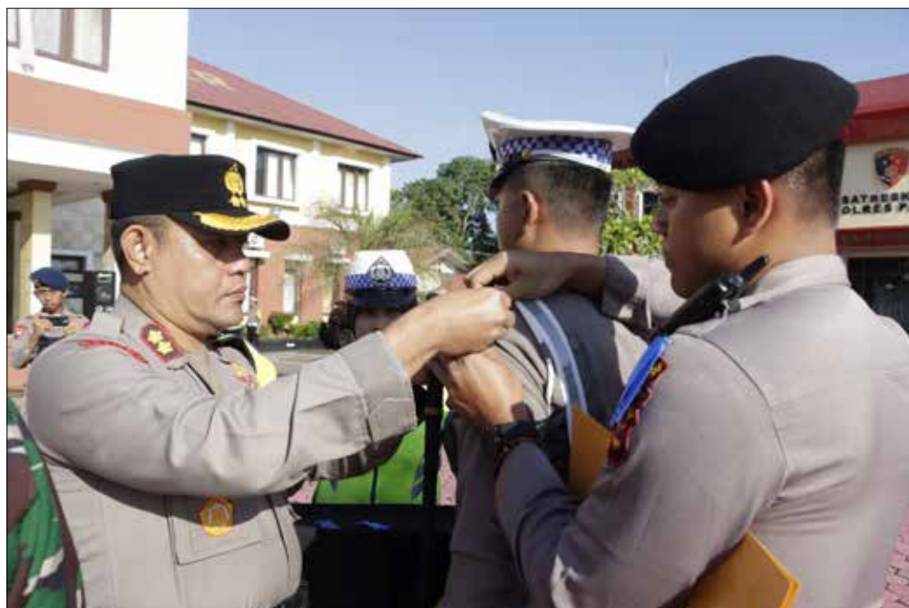
Penyematan pita randa Operasi Patuh Mahakam dimulai.

“Ada juga pengendara mobil yang tidak menggunakan sabuk