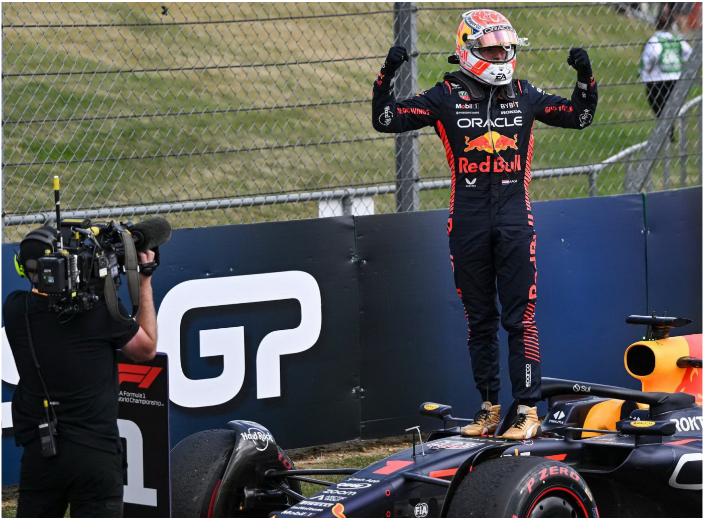
Max Verstappen mencatatkan waktu tercepat di Sirkuit Silverstone, Inggris.