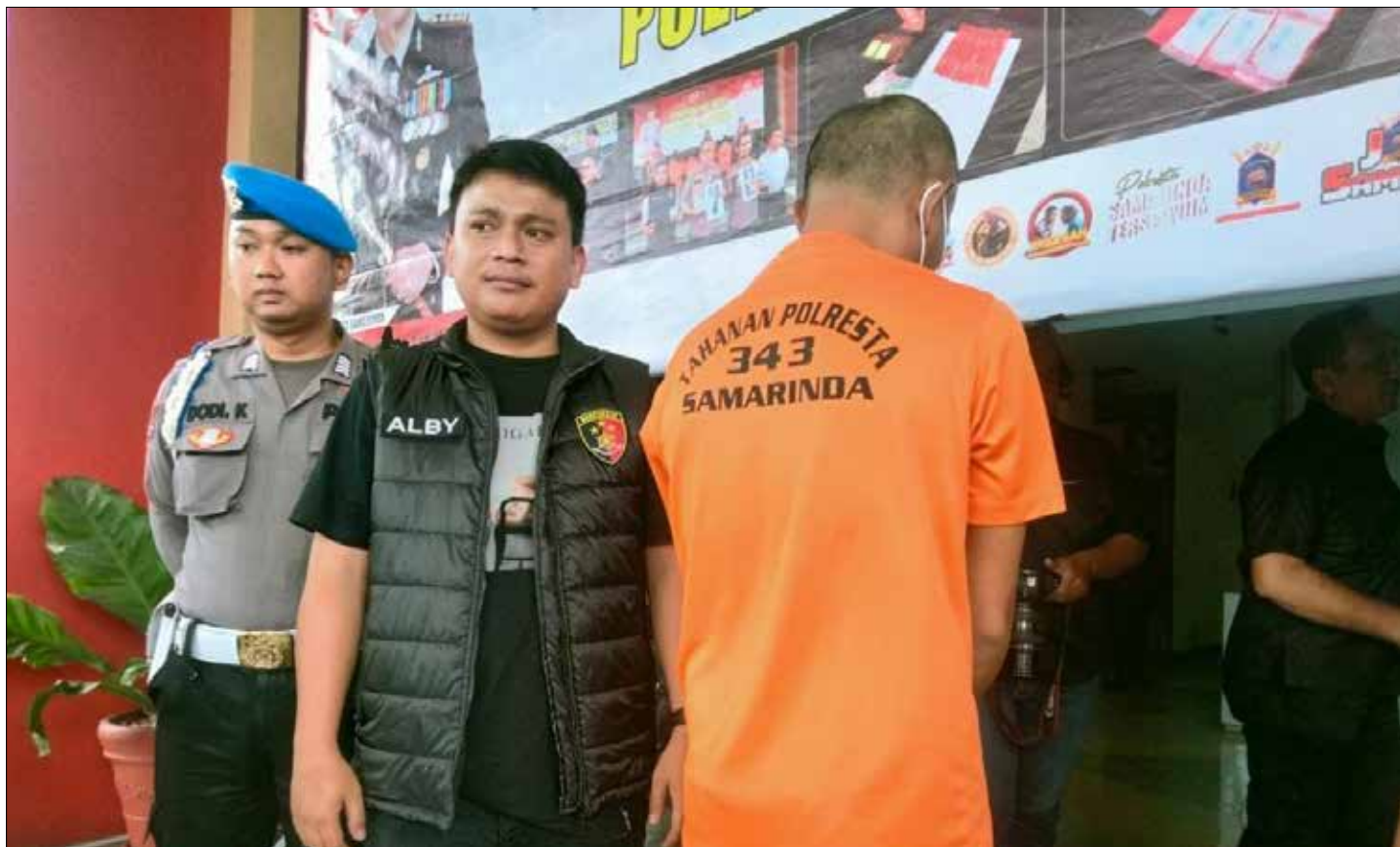
Pelaku WK saat dihadirkan dalam pers rilis di Halaman Polresta Samarinda.