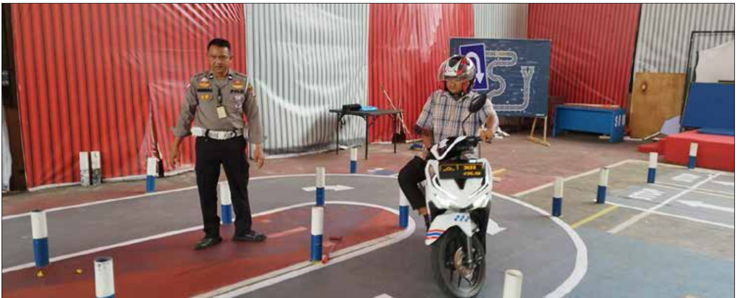
Uji praktik dengan trek baru di Lapangan Indoor Polres Paser.

Pewarta : Bhakti Sihombing Editor : Nicha Ratnasari