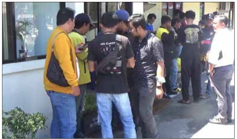
Belasan driver online saat mendatangi Polresta Balikpapan untuk melaporkan kasus dugaan pelecehan rekannya terhadap pelajar di Balikpapan.

Maxim Indonesia mengajak para penggunanya untuk selalu aktif memberikan laporan jika mengalami kendala atau keluhan saat menggunakan aplikasi. Perusahaan ini telah menyediakan layanan pengaduan melalui feedback di aplikasi dan juga tim Customer Service yang siap melayani di setiap kota operasional. (MK)