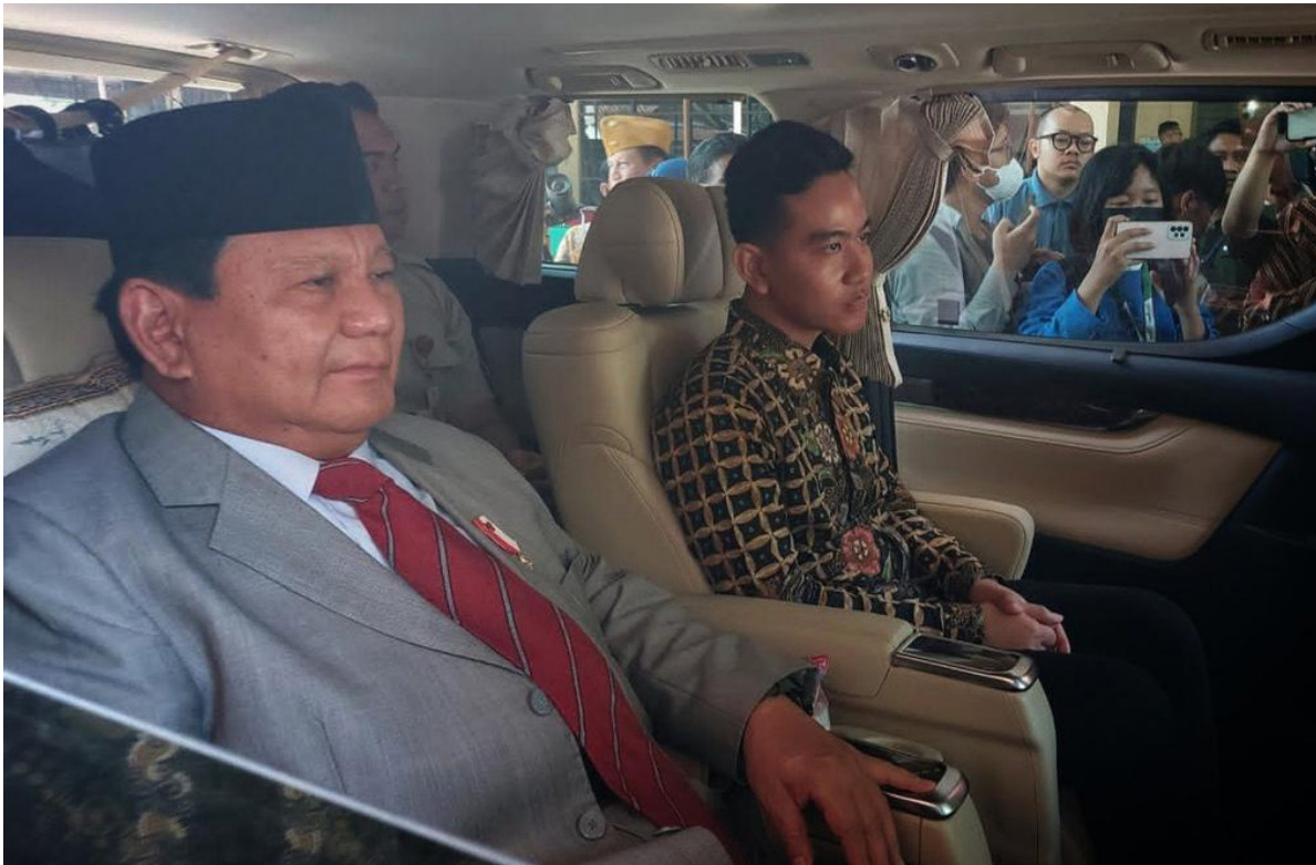
Prabowo Subianto dan Gibran Rakabuming Raka menghadiri Hari Veteran Nasional di Universitas Sebelas Maret (UNS).