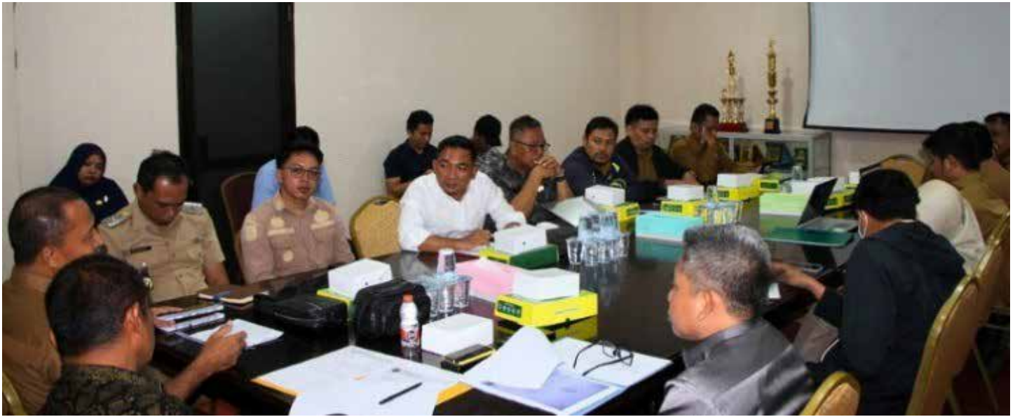
DISKOMINFO PPU FOR MEDIAKALTIMGROUP

Rapat kerja lintas sektor pemerintah yang digelar baru-baru ini.