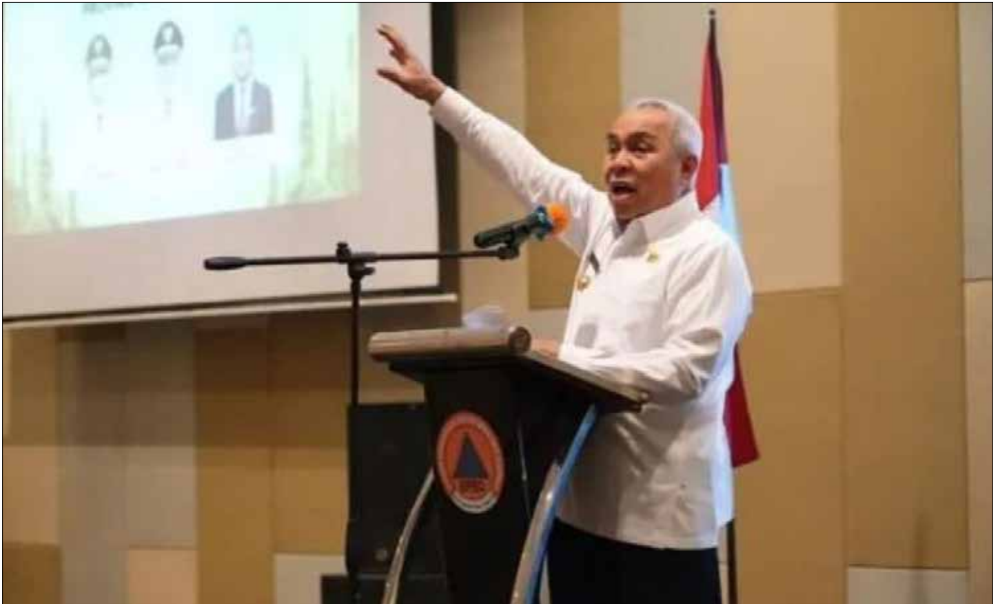
Gubernur Kaltim, Ir Isran Noor