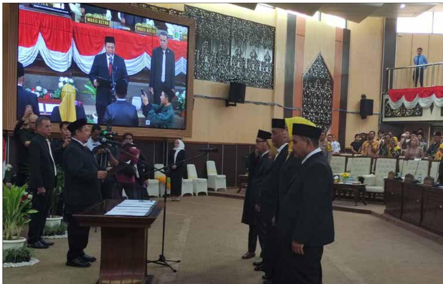
Suasana PAW 5 anggota DPRD Kukar.