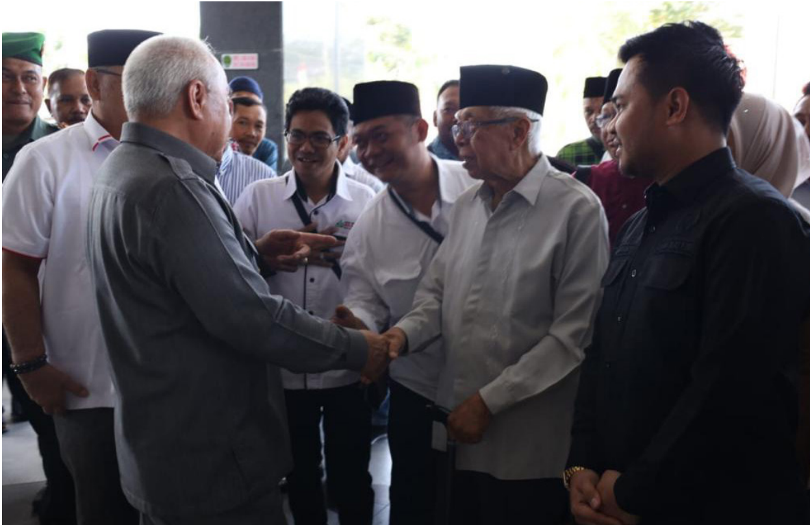
Isran bersama tokoh-tokoh Kaltim.