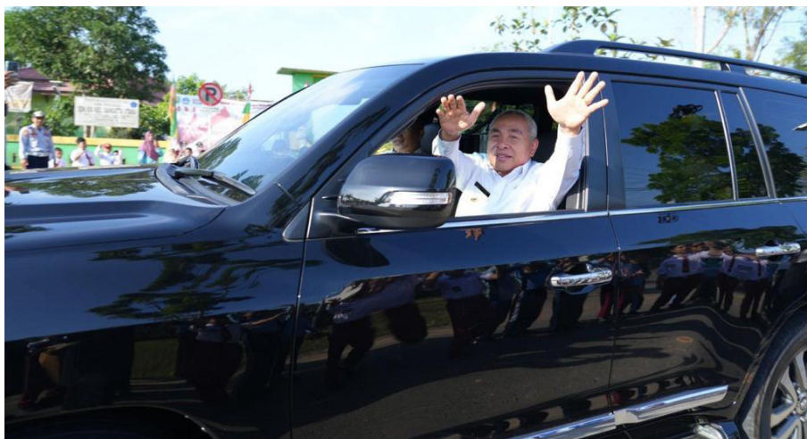
Lambaian Gubernur Kaltim Isran Noor.

Mengingat pemilihan kepala daerah serentak baru dilak-