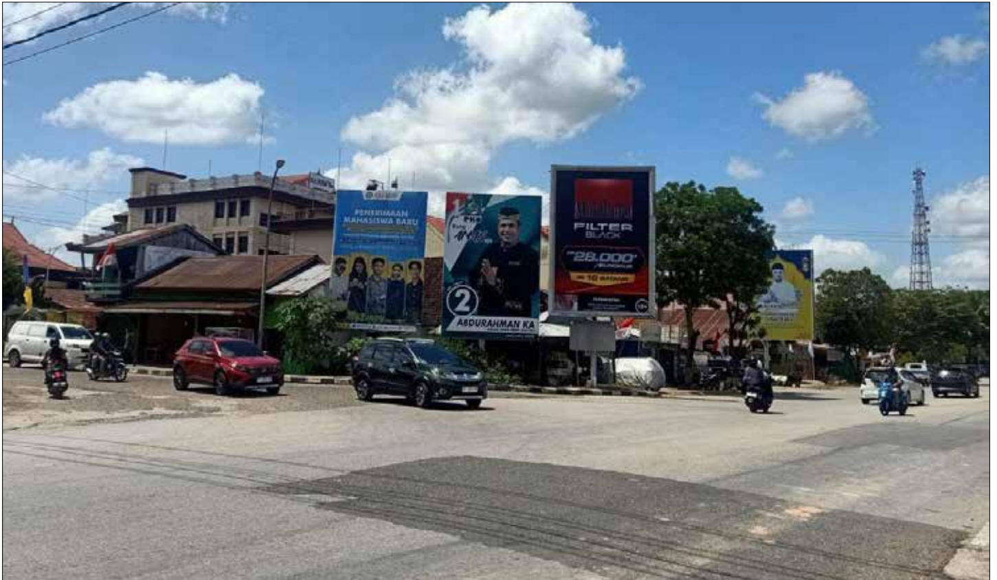
Baliho yang dianggap sosialisasi di Jalan Jendral Sudirman, Tanah Grogot.